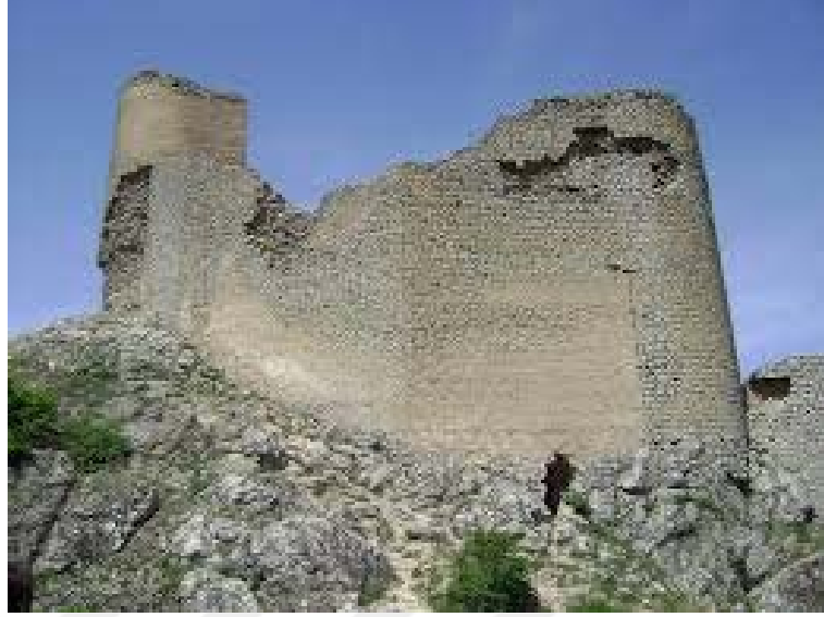
Şekil 3, Çırak Kale