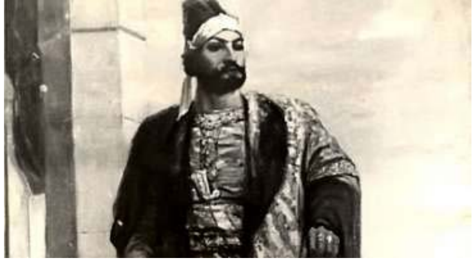
Şekil 2, Feteli Han