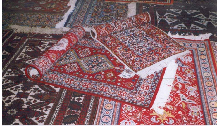
Quba xalçaları. Carpets of Guba. Кубинские ковры.