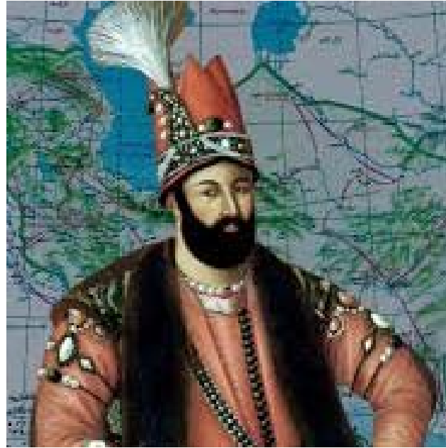
Şəkil 1. Nadir Şah.