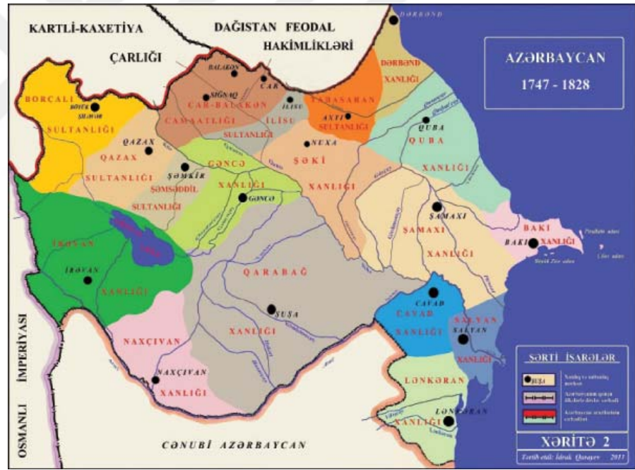
Şekil, Azərbaycan Hanlıkları'nın Umumi Haritası.