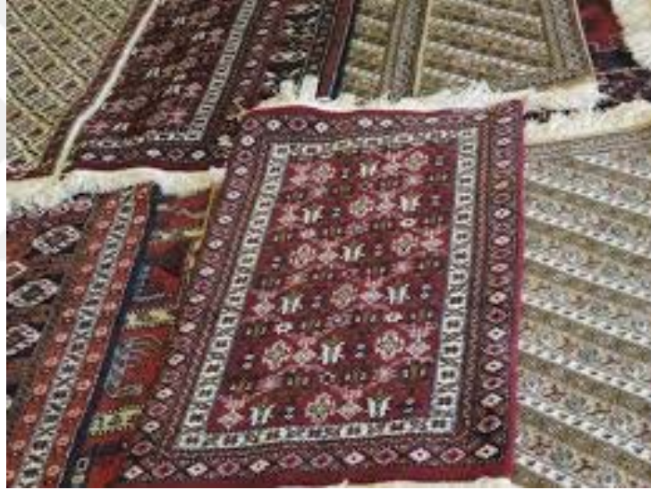
Şekil 5-6, Kuba Halıları