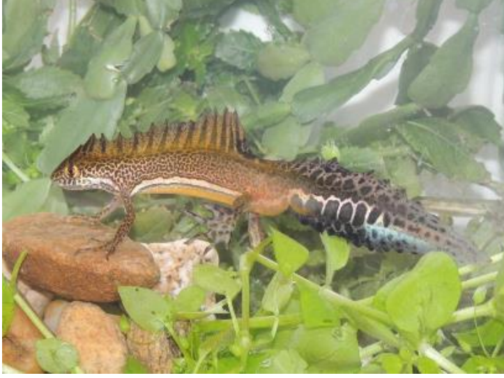
Şekil 4.3. Ommatotriton ophryticus , ♂ birey, 28.03.2015, İst. No: 60; Avdancık Köyü Kuzeyi 1.