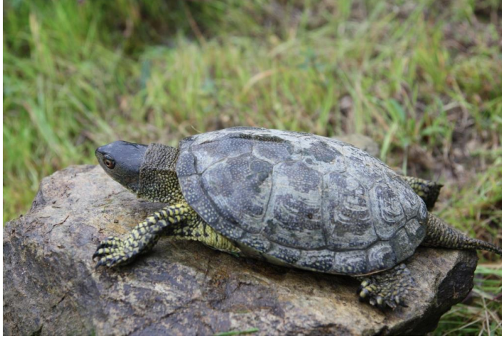
Şekil 4.13. Emys orbicularis , ♂ birey, 15.09.2013, İst. No: 26; Burcun Köyü girişı.

Katırlı dađı elde edilen örnek sayısı az olduđu ve daha fazla örnekle inceleme yapılması gerektiđi için alttür ayrımı yapılmamış, örneklerin Emys orbicularis türü olarak değerdendirilmesi uygun bulunmuştur.