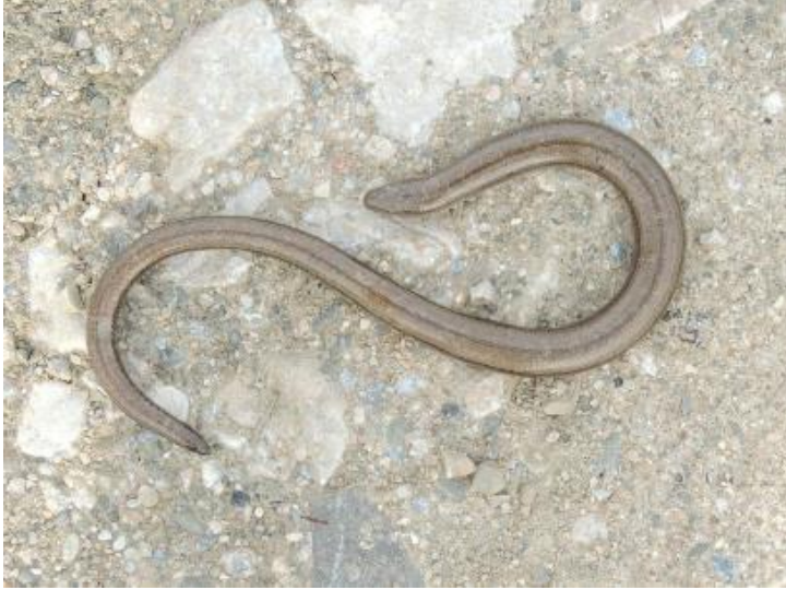
Şekil 4.18. Anguis fragilis , ♂ birey, 05.04.2015, İst. No: 25; Mustafalı Köyü Üstü 2.