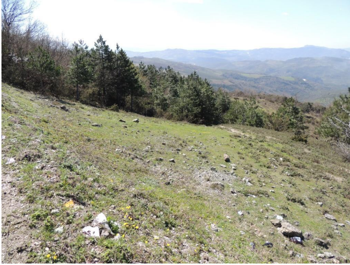
Şekil 4.35. İstasyon No:69, Adliye Köyü Güvenli Köyü Yolu. Zamenis situla habitatı. 01.04.2015