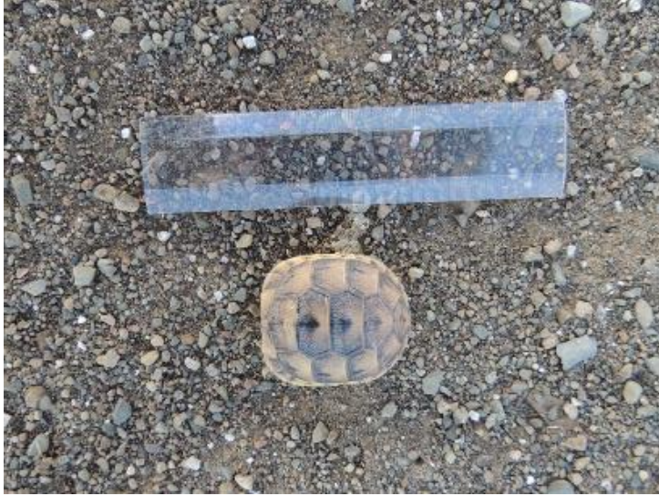
Şekil 4.15. Testudo graeca , Jüvenil birey, 06.10.2013, İst. No: 4; Gürsu Dışkaya Köyü Yolu 1.