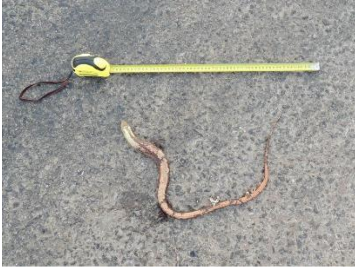
Şekil 4.17. Pseudopus apodus , Ezilmiş ♀ birey, 28.05.2014, İst. No: 37; Katırlı Köyü Umurbey Yolu 1.