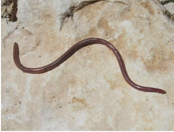
Şekil 4.25. Xerotyphlops vermicularis , Jüvenil birey, 08.06.2013, İst. No: 4; Gürsu Dışkaya Köyü Yolu 1.