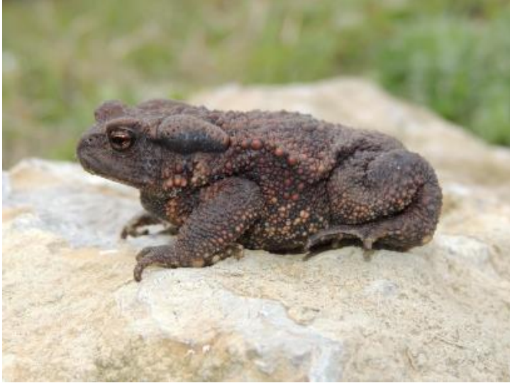
Şekil 4.5. Bufo bufo , ♀ birey, 05.04.2015, İst. No: 17; Mustafalı Köyü Üstü 1.