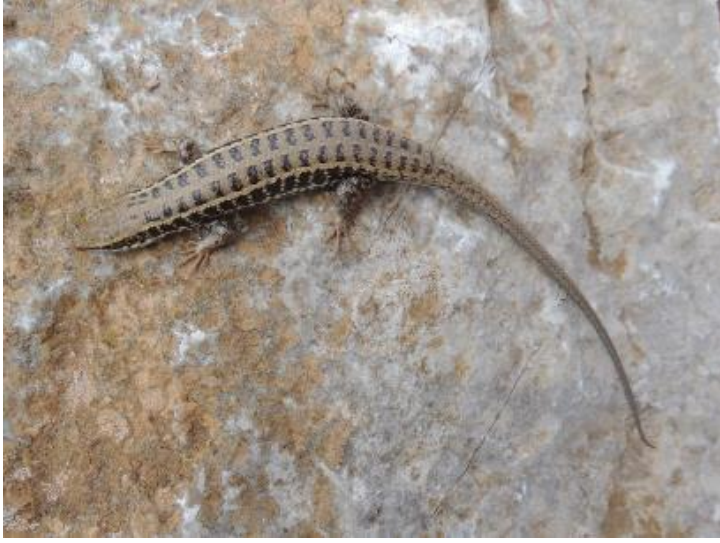
Şekil 4.23. Heremites auratus , ♂ birey, 07.07.2013, İst. No: 5; Dışkaya Köyü Ericek Köyü Yolu 1.