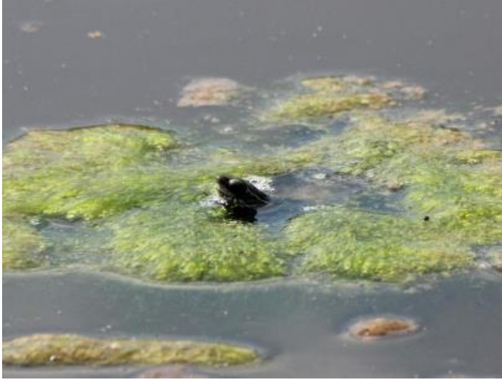
Şekil 4.14. Mauremys rivulata , 07.07.2013, İst. No: 8; Şükriye Köyü Göleti.