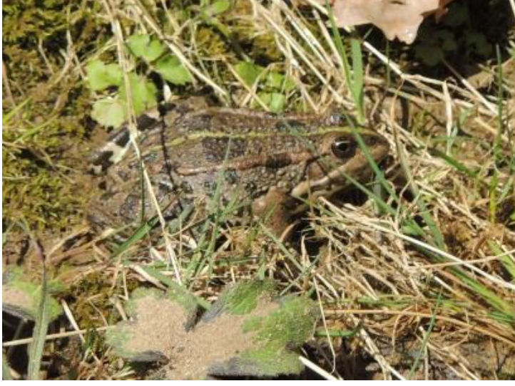
Şekil 4.12. Pelophylax ridibundus , ♀ birey, 28.03.2015, İst. No: 64; Seçköy Selçukgazi Köyü Yolu 4.

halen karışık olduğu için Katırlı Dağı örneklerinin Pelophylax ridibundus türü olarak değerlendirilmesi uygun görülmüştür.