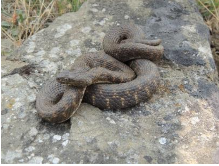
Şekil 4.33. Natrix tessellata , ♀ birey, 23.06.2013, İst. No: 13; Karagöl (Fevziye Köyü).