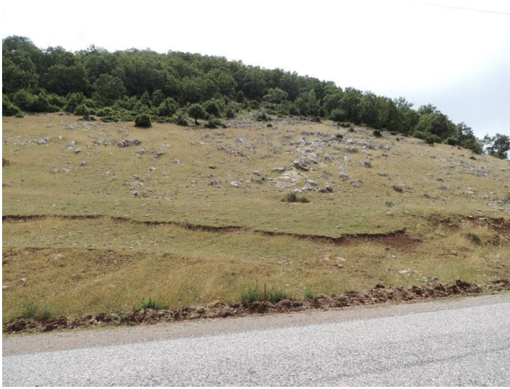
Şekil 4.24. İstasyon No:5, Dışkaya Köyü Ericek Köyü Yolu 1. Pelophylax ridibundus ve Heremites auratus habitatı 07.07.2013