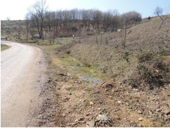
Şekil 4.2. İstasyon No:3, Kayacık Köyü Nüşetiye Köyü Yolu 3. Triturus anaticus ve Pelophylax ridibundus habitatı 22.03.2015