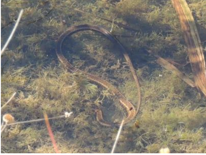
Şekil 4.31. Natrix natrix , 15.09.2013, İst. No: 26; Burcun Köyü girişi.