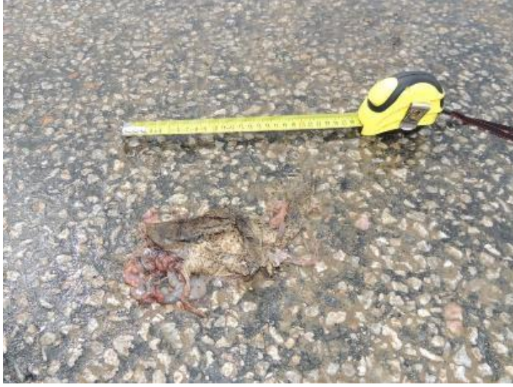
Şekil 4.6. Bufo bufo , Ezilmiş birey, 07.07.2013, İst. No: 7; Ericek Köyü Şükriye Köyü Yolu 2