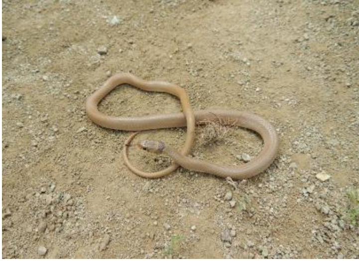
Şekil 4.28. Eirenis modestus , ♀ birey, 05.05.2014, İst. No: 4; Gürsu Dışkaya Köyü Yolu 1.