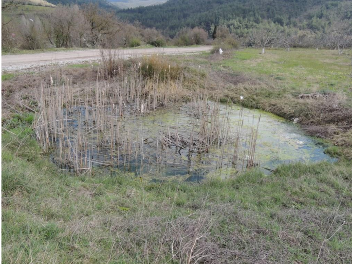
Şekil 4.4. İstasyon No:60, Avdancık Köyü Kuzeyi 1. Pelophylax ridibundus , Ommatotriton ophryticus ve Triturus anatolicus habitatı 28.03.2015