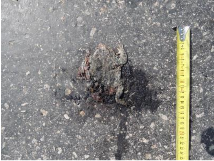
Şekil 4.8. Bufo variabilis , Ezilmiş ♀ birey, 26.03.2015, İst. No: 53; Dışkaya Köyü Ericek Köyü Yolu 3.