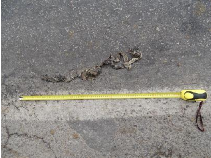
Şekil 4.29. Elaphe sauromates , Ezilmiş birey, 29.05.2014, İst. No: 42; Selimiye Köyü Yeniköy Yolu 2.