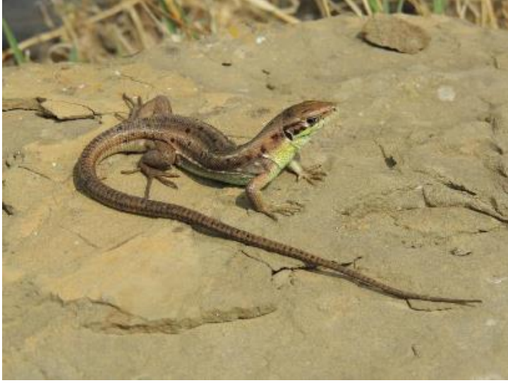
Şekil 4.21. Lacerta viridis , ♂ birey, 05.05.2014, İst. No: 6; Ericcek Köyü Şükriye Köyü Yolu 1.