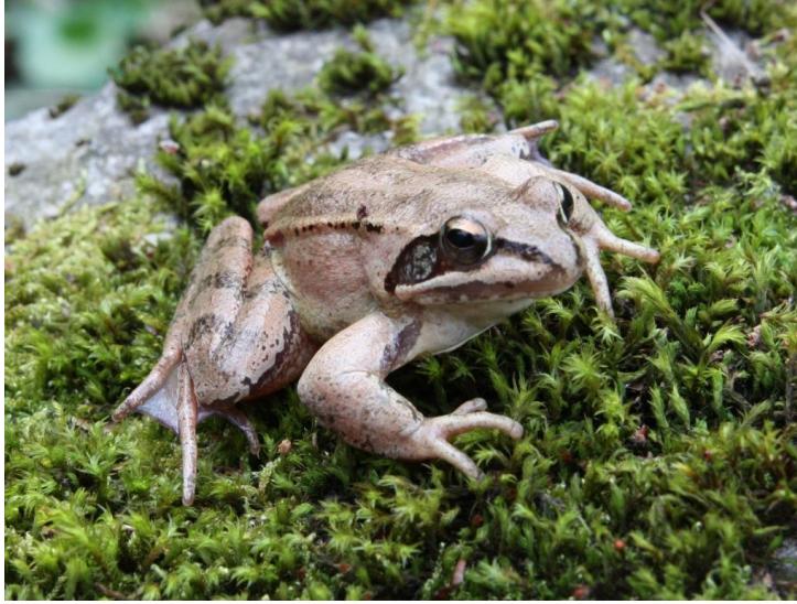
Şekil 4.11. Rana dalmatina , ♀ birey, 23.06.2013, İst. No: 13; Karagöl (Fevziye Köyü)