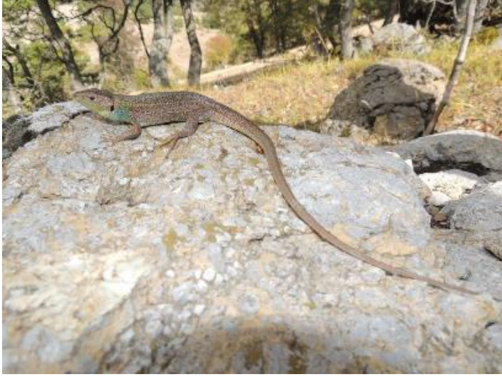
Şekil 4.20. Lacerta trilineata , ♂ birey, 26.05.2013, İst. No: 4; Gürsu Dışkaya Köyü Yolu 1.