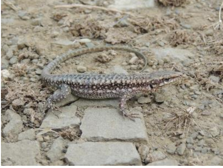
Şekil 4.19. Anatololacerta anatolica , ♀ birey, 01.06.2013, İst. No: 16; Ericek Göleti.