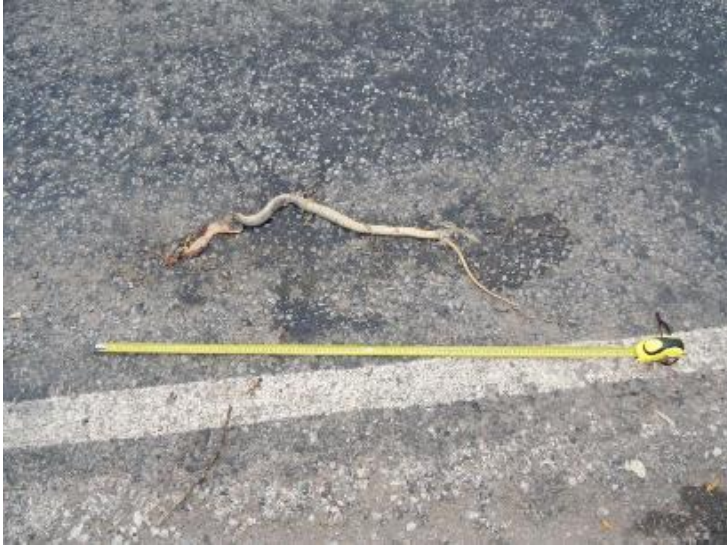
řekil 4.27. Dolichophis caspius , Ezilmiş birey, 29.05.2014, İst. No: 43; Narlıca Köyü Müřküle Köyü Yolu.