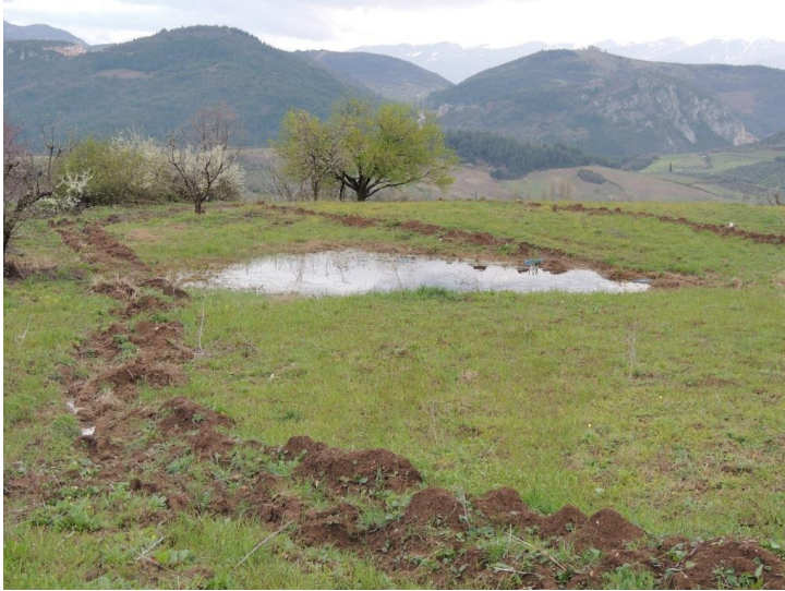
Şekil 4.10. İstasyon No:64, Seçköy Selçukgazi Köyü Yolu 4. Pelophylax ridibundus ve Hyla orientalis habitataı 28.03.2015