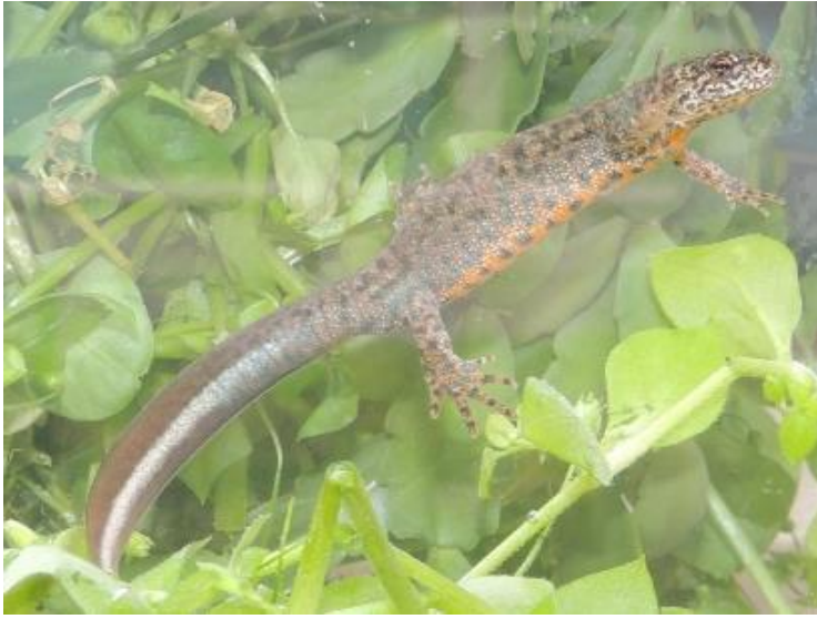
Şekil 4.1. Triturus anatolicus , ♂ birey, 22.03.2015, İst. No: 3; Kayacık Köyü Nüşhetiye Köyü Yolu 3.