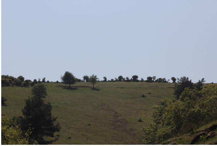
Şekil 4.16. İstasyon No:4, Gürsu Dışkaya Köyü Yolu 1. Pelophylax ridibundus , Bufoetes variabilis , Testudo graeca , Pseudopus apodus , Lacerta trilineata , Ophisops elegans , Anatololacerta anatolica , Eirenis modestus ve Xerotyphlops vermicularis habitatı 26.05.2013