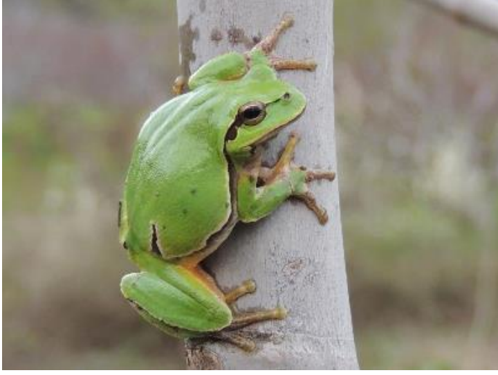
Şekil 4.9. Hyla orientalis , ♀ birey, 28.03.2015, İst. No: 64; Seçköy Selçukgazi Köyü Yolu 4.

incelemiş Hyla orientalis ve Hyla savignyi olmak üzere iki temel kümeye (clade) ayrıldığını ve Hyla savignyi türünün kendi içerisinde iki alttüre ayrıldığını bildirmiştir. Katırlı dağında bulunan örneklerin Hyla orientalis türü olarak değerlendirilmesi uygun görülmüştür.