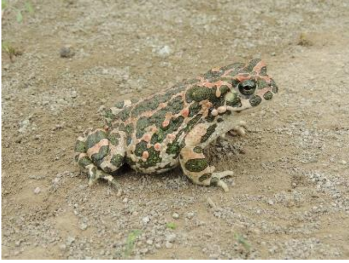
Şekil 4.7. Bufo variabilis , ♀ birey 01.04.2015, İst. No: 72; Ericek Köyü Seçköy Yolu 2.