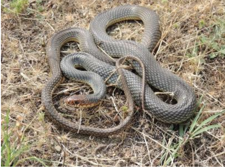
řekil 4.26. Dolichophis caspius , ♀ birey, 01.06.2013, İst. No: 29; Ericek Köyü Ericek Göleti Yolu 1

cins ismini Dolichophis şeklinde deęişmesi gerektięini bildirmiřtir. Katırlı Daęı'ndaki örneklerin Dolichophis caspius türü olarak deęerlendirilmesi uygun bulunmuřtur.