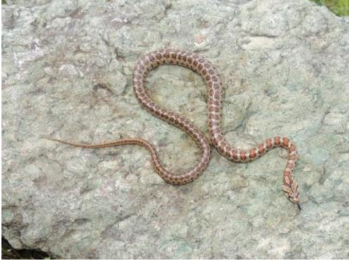
Şekil 4.34. Zamenis situla , ♀ birey, 01.04.2015, İst. No: 69; Adliye Köyü Güvenli Köyü Yolu.