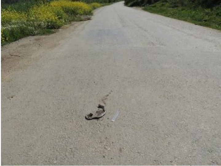
Şekil 4.32. Natrix natrix , Ezilmiş birey, 07.05.2014, İst. No: 33; Gölcük Köyü Gölcük Göleti Yolu 1.