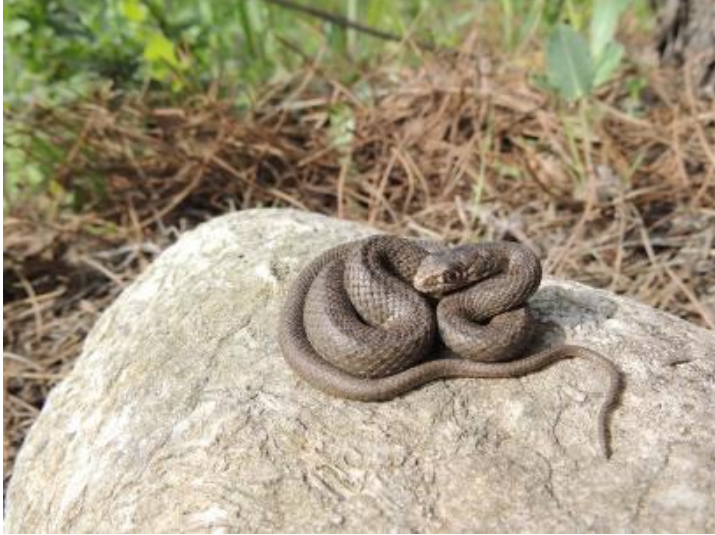
řekil 4.30. Malpolon insignitus , Jvenil birey, 07.05.2014, İst. No: 21; Yeniky Bayırky arası.