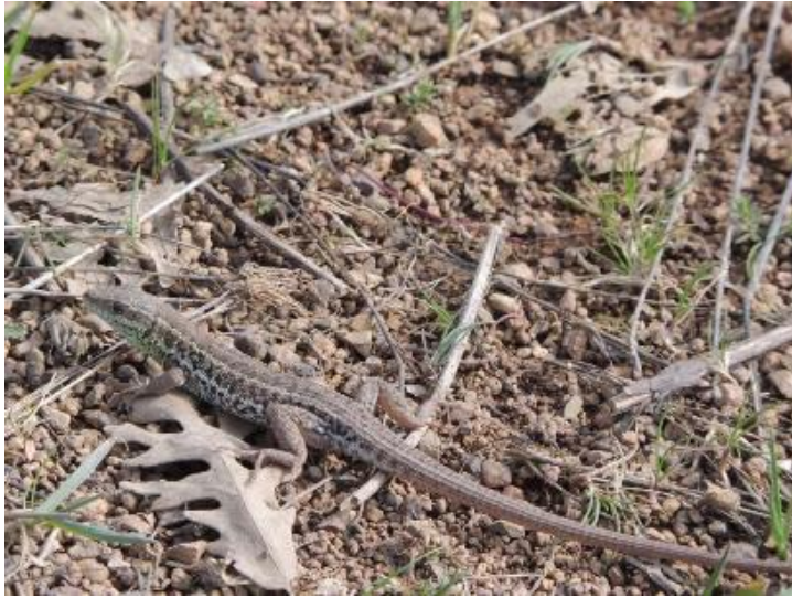
Şekil 4.22. Ophisops elegans , ♂ birey, 07.07.2013, İst. No: 6; Ericek Köyü Şükriye Köyü Yolu 1.