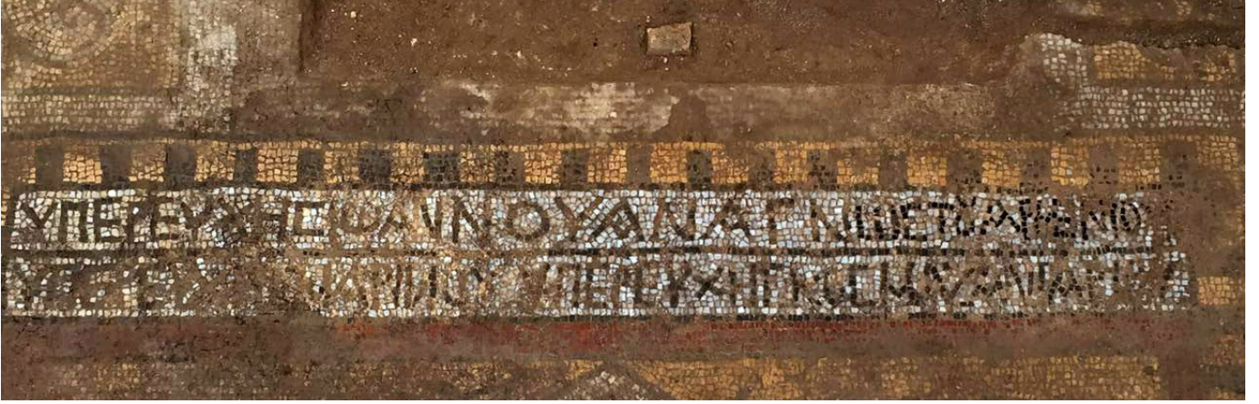
Resim 8 İkiz mezarların ayakucundaki adak yazıtı.

Mezarların ayakucunda kuzey-güney doğrultusunda uzanan 222x27 cm boyutlarındaki iki satırlık yazıt, beyaz zemin üzerine siyah renkli tesseralar kullanılarak oluşturulmuştur. Satırlar 1,5 cm kalınlığındaki siyah şeritle birbirinden ayrılmıştır.