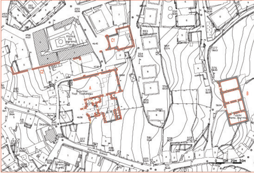
Resim 1 Sinop Balatlar Kilise kazı alanı haritası.

Sinop'ta Balatlar Kilisesi adıyla tanınan yapı kalıntısı, aslında Geç Roma Dönemi'ne ait bir imparatorluk hamam kompleksidir (Res. 1-2). 2010 yılından beri yapılan arkeolojik kazılar, yapının daha erken döneme ait kalıntılar üzerine, Geç Roma Dönemi hamamı olarak inşa edildiğini, gün ışığına çıkarılan mimari ve küçük buluntular da İÖ 6. yüzyıldan 20. yüzyıla kadar geçen uzun bir süreçte alanın kullanıldığını ortaya çıkarmıştır. Hristiyanlığın resmi din olarak ilan edildiği 4. yüzyıl sonunda ya da 5. yüzyılda hamamın caldariumu kiliseye, tepidariumu avluya ve frigidarium bölümü de mezarlık/gömü alanına dönüştürülmüştür. 6. yüzyıl sonu ya da 7. yüzyılın ilk yarısında büyük kilisenin tahrip olmasından sonra sıcaklığın güney haç kolu ve palaestranın batısındaki mekânlara yeni kiliseler inşa edilmiştir. 13. yüzyıldan 20. yüzyılın ilk çeyreğine kadar geçen süreçte kent önce Selçuklu ve daha sonra Osmanlı egemenliğindedir. Bu dönemde de bütün yapı kompleksini kapsayan alanda Meryem'in Ölümü/ Uykusu (Koimesis) Manastırı bulunur 1 . Roma hamamında tepidarium olan yapı, daha sonra erken Bizans döneminin avlusu olmuş, 13. yüzyıldan sonra da bu