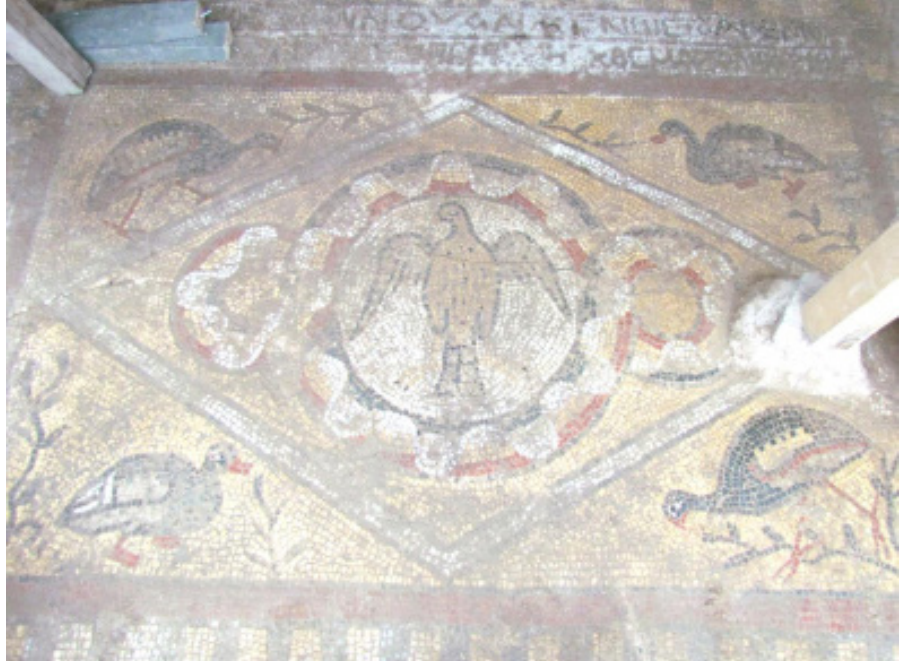
Resim 9 Yazıtlı panonun altındaki kartal betimli fig rl  pano.

dairelere bağlanmaktadır. Küçük dairelerin içlerinde herhangi bir süsleme yoktur. Dairelerin sınırları, siyah, kırmızı, beyaz renkli dekoratif çan biçimli dalga motifli (D cor I: pl. 60d) bord rle vurgulanmıřtır. Bord rde çan biçimli dalga motifi kullanımı yaygındır. Anadolu'da benzer  rnek Prusia ad Olympum mozaiklerinde (3. y zyıl) (Okçu 2009: 48-50 res. 27), Zeugma (2. y zyıl sonu-3. y zyıl) 8 ve Edessa mozaiklerinde (3. y zyıl) 9 Anadolu dıřında Filistin'de 3. y zyıl sonuna tarihlene Nablus-Shechem mozaiklerinde (Talgam 2014: 59 res. 84) karřımıza çıkar.