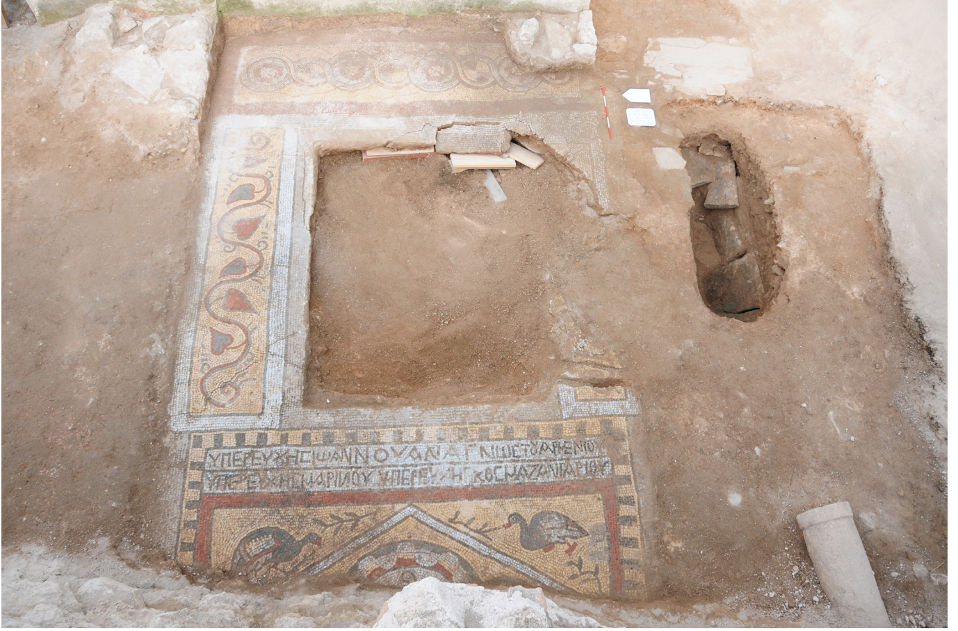
Resim 4 İkiz mezarlar üzerindeki mozaik döşeme.

mozaikle döşeli olduğu anlaşılmıştır. Ne yazık ki mezarlar tahrip edilerek açılmış, içlerindeki gömüler ve mezar buluntuları soyulmuştur. Bu tahribat sırasında, ikiz mezarların üzerindeki mozaik döşeme panosu da kırılarak parçalanmış; günümüze sadece mezarların etrafını çeviren panolar ulaşabilmiştir.