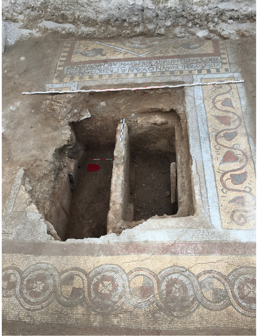
Resim 5 Mezarların doğusundaki mozaik pano.

Dönüşümlü büyük ve küçük dairelerden meydana gelen desen, Geç Antik Çağ'da Akdeniz dünyasında yaygın, temel geometrik motiflerdendir. Dairelerin içleri her ne kadar farklı motiflerle doldurulsa da ana desene benzer örnek olarak, Anadolu'da Pisidia Antiokhiasi'ndeki Büyük Bazilika/Aziz Paulos Kilisesi'nin zemin döşemesi (4. yüzyıl) (Kitzinger 1974: 386 res. 59; Taşlıalan 1997: 243 çizim 1), Anadolu dışında, Nicopolis'teki (Yunanistan/Epirus) A Bazilikası'nın (6. yüzyıl) zemin döşemesi 3 verilebilir.