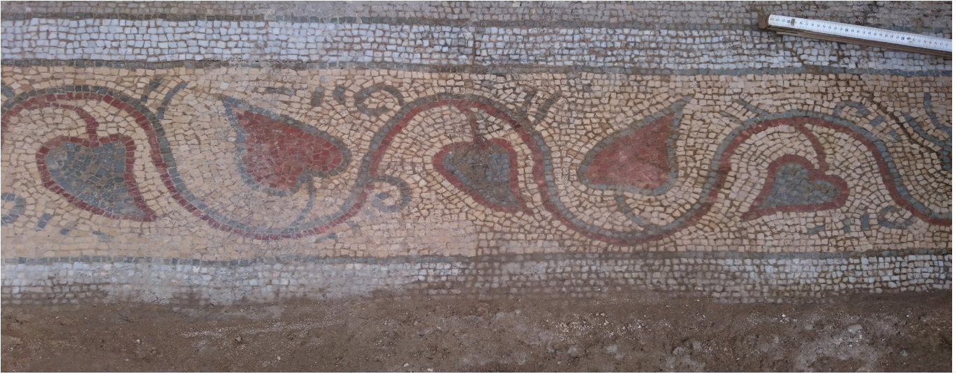
Resim 6 Mezar 2'nin kuzey tarafında doğu batı yönünde uzanan pano.

Bordürün simetriğinde, mezarın güney yönündeki dekorasyon çok fazla tahrip olmuş halde ortaya çıkmıştır (Res. 7). Günümüze ulaşan parçalardan motifin kuzey yöndeki pano ile aynı boyut ve tasarımı olduğu anlaşılmaktadır. Dışta, 1.5 cm kalınlığındaki iki siyah şeritle konturlanmış 9 cm genişliğindeki beyaz bordürle çevrelenmiştir. İç alan burada da kıvrım dallar oluşturan sarmaşık sarmalı deseniyle süslenmiştir. Sarı renkli zeminde kırmızı renkli tesseralarla renklendirilmiş, kıvrım dala ait desen parçası, simetriğindeki panoda olduğu gibi kalp şekli sarmaşık yapraklarını taşıyor olmalıdır.