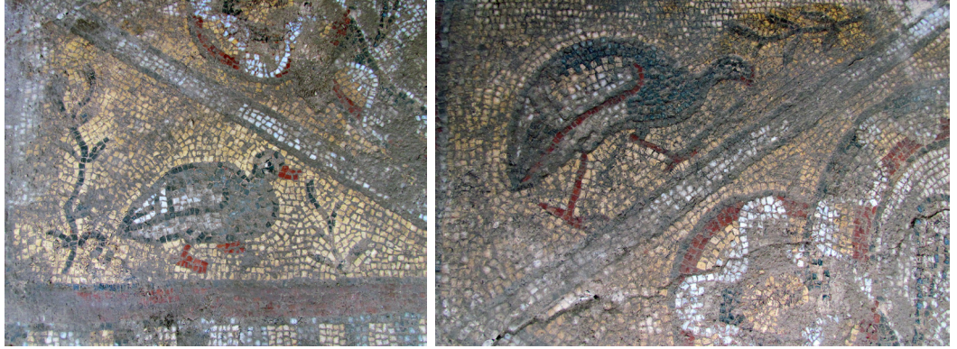
Resim 14 Meke (saz tavuğu/horozu) ayrıntı.