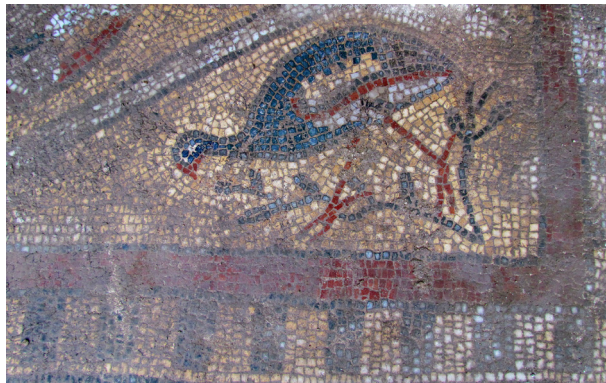
Resim 11 Suna ördeği ayrıntı.