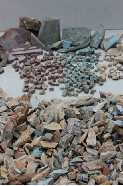
Resim 15 Mozaik üretiminde kullanıldığı düşünülen amorf parçalar.

hayvanlar, özellikle yazıtların bulunduğu alanlarda sevilerek uygulanmış, 6. yüzyılda zemin döşeme dekorasyonunun karakteristik sunumu olmuştur 18 . Tasarım genellikle bir nesnenin ya da bir yazıtın iki yanında, birbirine dönük, bazen özdeş bir çift hayvan şeklindedir. Farklı görüşler panolarda mevcut olan uzun ve/veya dar alanlar nedeniyle birbirlerine bakan hayvanlar kullanıldığını ileri sürse de yukarıda sayılan nedenlerle sanatçıları bu konuların seçimine yönlendiren bazı ideal kavramların da varlığı yadsınmaz. Balatlar Kilise örneğinde olduğu gibi böylesi simetrik kompozisyonlarda çoğu kez, pozlardaki ufak farklar dışında figürler genelde aynıdır ve yaygın bir görüşe göre, bu kurgunun bir alegori olduğu, altın çağa veya cennete ulaşmak için umudu temsil ettiği (Hachlili 2009: 199, 203, 205, 207).