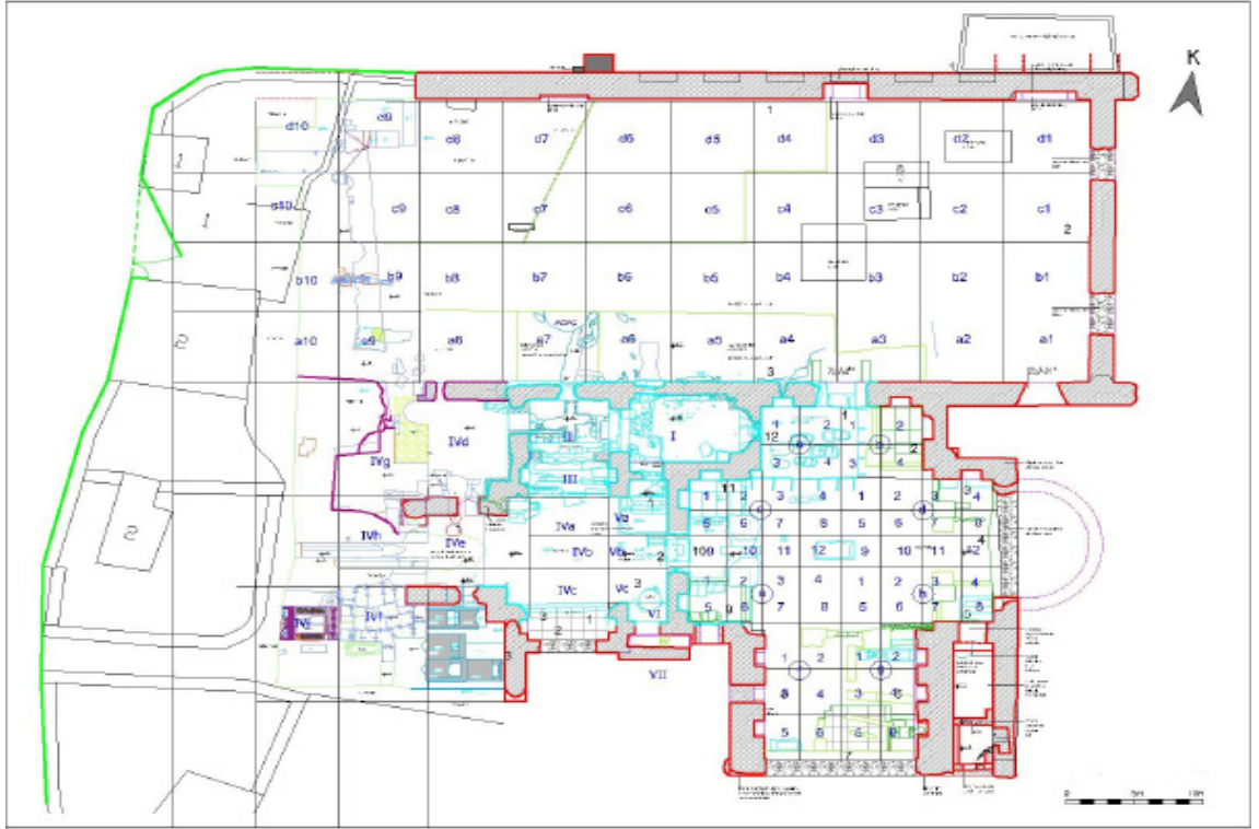
Resim 3 Plan.

erken Bizans Dönemi'ne ait geniş mezarlığın bir bölümü ile gömülen kişilerle bağlantılı olduğu adak yazıtlarında belirtilmiş olan döşeme mozaikleri bu çalışma kapsamında ilk kez tanıtılacaktır.