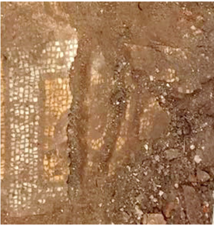
Resim 7 Mezar 1'in güneyi boyunca uzanan döşemeye ait mozaik parça.

Sarmaşık sarmalı motifi, gerek dini mimari döşeme mozaiklerinde gerekse sivil mimarlık örneklerinde çoğunlukla ana panoların etrafını çeviren geniş bordürler olarak tercih edilmişlerdir. Kalp şekilli yaprakların bağlandığı dallar bazen sade kıvrımlarla tek ya da iki renkli dekore edilmiştir. Yapraklar şişkin gövdeli ya da daha sivri hatlı ince uzun formlu olabilmektedir. Bazı örneklerde ana daldan daha ince dallar çıkarak yapraklar çoğaltılmış, motif daha dekoratif etkiye büründürülmüştür. Sunumdaki bu farklılıkların imparatorluk merkezlerindeki farklı atölyelerin beğeni ve uygulamalarından kaynaklandığı söylenebilir.