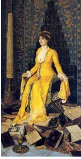
Resim 5: Osman Hamdi, “Mihrap” 1901, t.ü.y.b.

oluşturmak için hocası Gerome gibi fotoğraftan yararlanmışır. “Sanatçı mekan kurgusunu Gerome’dan öğrenmişti” (Duben, 2007). Kendisini ve yakın çevresini resimlerinde model olarak kullandığı bilinen sanatçının eserlerinde arka planda ayrıntılı olarak betimlenmiş mimari unsurlara yer verdiği görülmektedir. “Osman Hamdi kadın konusunu işleyen ilk ressamdır (Cezar, 1995. s.370).