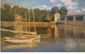
Resim 7: Claude Monet, “Argenteuil’de Köprü” 1874, t.ü.y.b. 59x78 cm