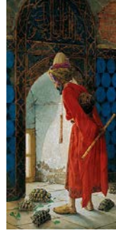
Resim 6: Osman Hamdi, “Kaplumbağa Terbiyecisi” 1906, t.ü.y.b. 222 cm x 122 cm

Doğal mekanlarda kendi oluşturduğu kurgularla ve kullandığı sembollerle yaşadığı toplumsal yapıyı hiciv etme ve kadın haklarını savunma amacı ile resimler yaptığı görülmektedir (Resim 5-6). İlerici, reformcu düşünürler gibi Osman Hamdi Bey de kadına haklarını ve saygınlığını başıslayan reformist ruhu paylaşmaktadır (Duben, 2007). Bu bağlamda Osman Hamdi’nin kadın figürlerini Gerome’un aksine cinsel bir obje olarak betimlemediği ifade edilebilir.