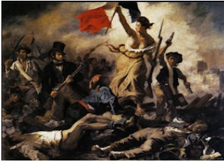
Resim 13: Eugene Delacroix, “Halka Yol Gösteren Özgürlük” 1830,t.ü.y.b. 260x325cm