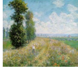
Resim 10: Claude Monet, “Kavaklı Çayır”, 1875 t.ü.y.b. 54.5x65.5 cm

Monet’in eserlerinde kullandığı izlenimci anlayış bir çok sanatçıyı etkilemiştir (Resim 9-10). Bir çok sanatçı tarafından izlenmiş ve yorumlanmış olan bu resimsel anlayış bir sanat akımı olarak da kabul görmüştür.