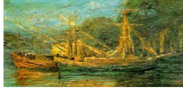
Resim 8: Nazmi Ziya Güran, “Peyzaj” t.ü.y.b.

Fransız ressam Claude Monet ait Argenteuil’de Köprü” adlı eser tuval üzerine yağlı boya tekniğinde 1874 yılında yapılmıştır (Resim 7). Arka planda ağaçları ve onlar içinde kaybolan evin resmedildiği kompozisyonun orta planını köprü formu ve resmin büyük bir bölümünü kaplayan köprüünün ve arka plan renk yansımasının yer aldığı yeşilin tonlarıyla renklendirilmiş nehir, ön planını ise üzerinde üç küçük teknenin yer aldığı mavi rengin hakim olduğu nehrin diğer bölümü oluşturmaktadır.