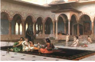
Resim 1: Jean Leon Gerome, “Saray Terasında” 1886, t.ü.y.b. 82 x 122 cm