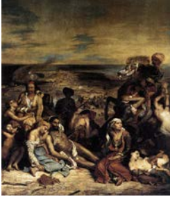
Resim 15: Eugene Delacroix, Sakız Adası Katliamı 1824,t.ü.y.b. 419x139cm

Delacroix, Fransız Romantik dönemin önde gelen ressamlarından (Farthing, 2014). Delacroix'nın gündelik hayattan, edebiyattan ve yakın coğrafyadan edindiği etkileri yorumlayarak kendi bakış açısıyla konu olarak ele alma eğilimi, resimlerinde ortak özellik olarak görülmektedir (Resim 15-16).