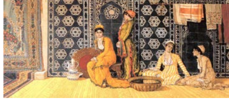
Resim 2: Osman Hamdi, “Haremnden” 1880, t.ü.y.b. 56 x 116 cm

Tuval üzerine yağlı boya tekniğinde 1886 yılında yapılmış olan Saray Terasında adlı eser Fransız ressam Jean Leon Gerome’a aittir (Resim.1). Sanatçının bu eserinde; üstü açık İslam coğrafyasına ait olduğu görülen mimari mekanın orta kısmında çıplak bir şekilde havuza giren-eğlenen beş kadın resmin orta planını, mimari mekan ve gökyüzü resmin arka planını, koyu renkli halı yardımıyla vurgulanmış saz çalan şarkı söyleyen kadınlar ve elinde değnek bulunan erkek ise resmin ön planını oluşturmuş, erkek figür yanındaki kadınların aksine ayakta betimlenmiştir.