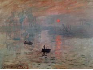
Resim 9: Claude Monet, “İzlenim” 1873 t.ü.y.b. 46x63 cm.