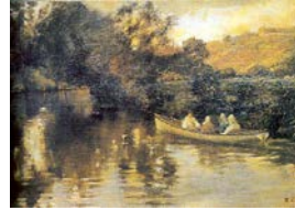
Resim 12: Nazmi Ziya Güran, “Göksu'da Gezinti 43.5x61.5 cm, t.ü.y.b.

Nazmi Ziya Güran 1908’de Paris’e gitmiş, önce üç ay Akademie Julian’da Marcel Bachet ve Royer’in hocalık ettiği atölyeye devam etmiş, ayrıca Cormon’un atölyesinde de 1913’e kadar çalışmıştır (Gökkaya 2012). Sonrasında yurda dönen sanatçıya ait eser örneklerine bakıldığında sanatçının izlenimci sanat anlayışına sahip olduğu görülmektedir (Resim 11 – 12). Bu bağlamda Celal Esat Arseven Nazmi Ziya’dan söz ederken şöyle der: