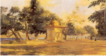
Resim 11: Nazmi Ziya Güran, Küçüksu'dan 42x62 cm, t.ü.y.b.

Monet’in eserlerinde kullandığı izlenimci anlayış bir çok sanatçıyı etkilemiştir (Resim 9-10). Bir çok sanatçı tarafından izlenmiş ve yorumlanmış olan bu resimsel anlayış bir sanat akımı olarak da kabul görmüştür.