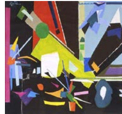
Resim 18: Zeki Faik İzer, “Soyut Kompozisyon” 1931, kolaj. 40x34cm