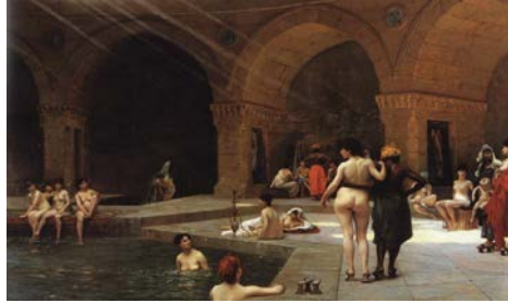
Resim 4: Jean Leon Gerome, "Harem Havuzu" 1848, t.ü.y.b 82 x 122 cm.

Batılı oryantalist ressam doğuyu görmese de, doğunun değer ve noksanlıklarını bilmese de, o genelde, kafasındaki Doğu'yu resmetmeye çalışıyordu (Cezar, 1995). Bu yaklaşımın Jean Leon Gerome'un örnek olarak sunulmuş diğer eserlerinde de var olduğu görülmektedir (Resim 3 - 4).