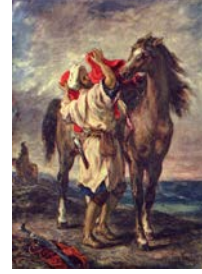
Resim 16: Eugene Delacroix, Marocan ve Atı 1855,t.ü.y.b.56x47cm

Sanatçı, “resimde rengin çizimden, hayal gücünün ise bilgidenden daha önemli olduğuna inanıyordu” (Gombrich, 1999, s.505). Sanatçı izleyicinin resimleri karşısında güçlü renk kullanımıyla kolaylıkla gezinmelerini sağlamaktadır. Yalnız sanatçının Halka Yol Gösteren Özgürlük resminde renk kullanımı diğer resimlerine nazaran geri planda kalmıştır (Cumming, 2008).