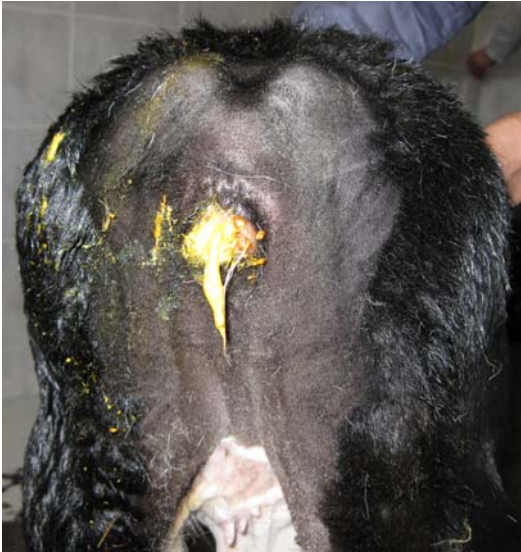
Şekil 1. Olgunun klinik görünümü (vajinal defekasyon).

Yapılan klinik muayenede, buzağının genel durumunun iyi ve vital parametrelerinin ise normal sınırlar içerisinde olduğu belirlendi. Regio perinealiste anüsün ve coccygeal vertebraların yokluğu dikkati çekti. Vajinadan dışkı çıkışı mevcuttu (Şekil 1) ve pervajinal parmakla yapılan muayenede, yaklaşık 12 cm cranialde, dorsal vajinal duvarda servikse yakın şekillenmiş 2 cm'lik bir fistül deliği saptandı. Lateks sonda kullanarak yapılan vajinal sondalama neticesinde, sondanın fistül deliğinden craniale doğru rahatça ilerleyebildiği (normal luminal açıklık) tespit edildi.