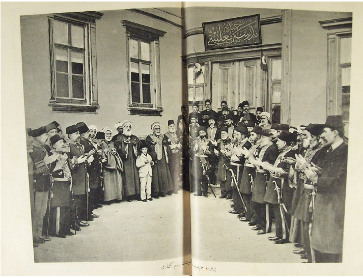
Hamidiye Medrese-i Muallimîn'in Resmi açılış töreni. (Hudavendigâr Vilayeti Salnâmesi, Sene: 1325, s. 75)

Bursa'da kurulan Medrese-i Muallimîn, ibtidâî (ilkokul) okullara öğretmen yetiştirmek amacıyla yatılı olarak açılan bir yüksekokuldur. Okul açılınca daha önce açılan Dârümuallimînler bünyesinde yer alan ibtidâî şubesi lağv edilmiştir. Yeni kurulan okulun öğretmen ve memurlarının da Maârif Nezaretince tayin edilmesi kararlaştırılmıştır 20 .