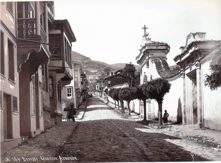
Okulun açıldığı cadde. (Dostoğlu, c:I, s. 395)

Yapılan yazışmalar, ayrılan bütçe ve alınması kararlaştırılan görevlilerin belirlenmesinden sonra okul 19 Ağustos 1322/1 Eylül 1906 günü açılmıştır 19 .