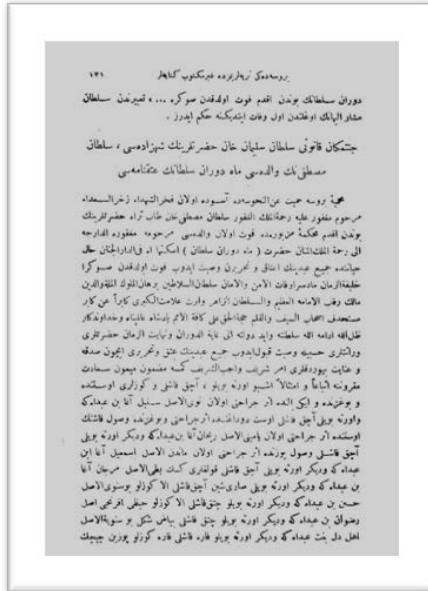
Tarih-i Osmani Encümeni Mecmuası , 11-13. Sene, 1 Teşrin-i Sani 1339, no.62:77, s.131.