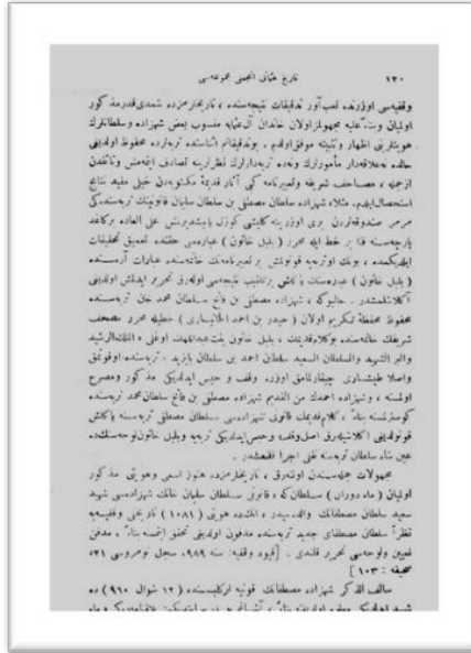
Tarih-i Osmani Encümeni Mecmuası , 11-13. Sene, 1 Teşrin-i Sani 1339, no.62:77, s.130.