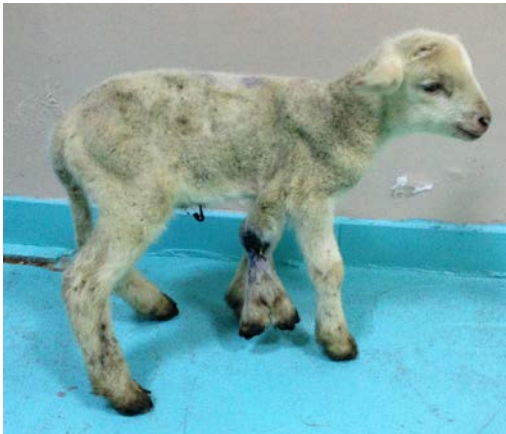
Şekil 1. Olgunun klinik görünümü.

İnspeksiyonda sağ articulatio humerinin caudalinde, lateral toraks duvarına bağlı fazla bir ekstremitenin bulunduğu görüldü. Ekstremitenin metacarpusu hizasında, distalden itibaren 4 adet metacarpusun geliştiği, 2 adet metacarpophalangeal eklemin bulunduğu belirlendi. En distalde parmak sayıları normal 2 adet ayak bulunmaktaydı. Ayrıca antebrachium düzeyinde açık bir kırığın olduğu ve kırık bölgesinden irinli akıntının geldiği tespit edildi (Şekil 1).