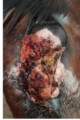
Şekil 1. Kısırta vulva ve anüsün ventral kısmındaki tümöral dokunun görünümü.

Kısırağın klinik muayenesinde genel durumunun iyi ve vital parametrelerinin normal olduğu belirlendi. Kısırağın genital bölgesinin muayenesinde vulvada anal sfinkter’in ventral yarımını kapsayan, fibrotik üremeye karakterize, yaygın, açık, nemli bir yara belirlendi. Muayenede lezyonların vulva ile sınırlı olduğu, vestibulumun vulva sınırı dışında bir yayılma göstermediği belirlendi. Vaginal palpatorik muayenede, servikse kadar olan bölgede herhangi benzer lezyon yoktu ancak perineal bölgede lezyonun vulvadan laterale doğru genişlediği, dorsalde anal sfinkteri de kısmen kapsadığı, çapının yaklaşık 13-15 cm’ye ulaştığı belirlendi (Şekil 1).