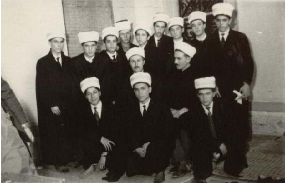
Resim 4: Bursa'da yetiştirdiğim hâfız talebelerimle. (27 Ekim 1963)