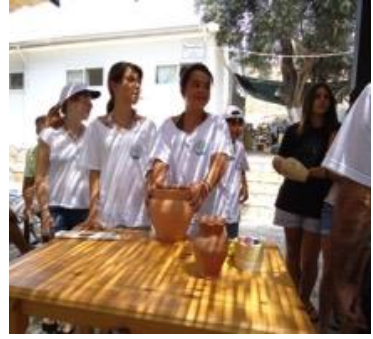
Resim 2: Seramik Atölyesi Çalışmaları