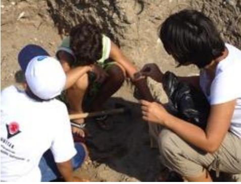
Resim 5: Arazide eser tanıma