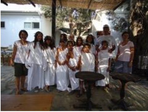
Resim 10: Antik çağ kıyafetleriyle çocuklar