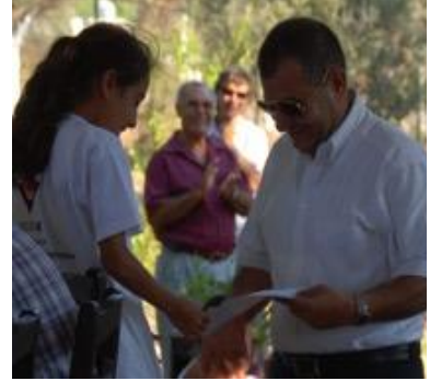
Resim 11: Sertifika töreni

Yapmış olduğumuz projede, başarı ölçütü olarak iki tip değerlendirme dikkate alınmıştır. Birincisi, eğitim yöntemi ve konuların katılımcılara aktarılmasındaki başarı, ikincisi ise eğitim sonrası ortaya çıkacak olan projenin yaygın etkisidir. Bu tip eğitim programlarının başarısının ölçülmesi ve kısa zamanda ortaya konulabilmesi kolay değildir. Ancak eğitime katılan öğrencilerde merakla dayalı bir öğrenme isteğinin ortaya çıkması ve anlatılan konularla ilgili, katılımcılarda oluşan bilgi ve konuyu kavrama düzeyi, yöntemin başarısı için bir değerlendirme ölçütüdür. Katılımcıların eğitim sonrası bu bilgileri