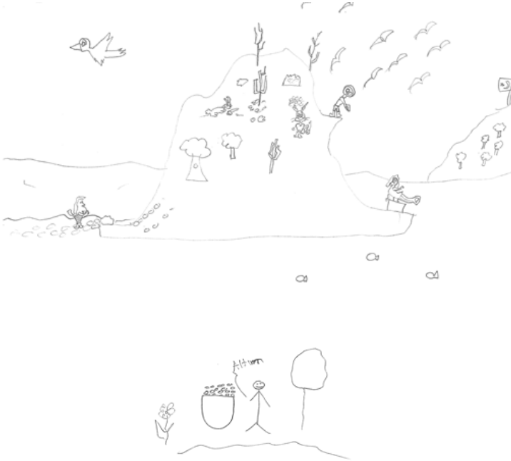
Resim 12: Öğrencilerin kente ilgili ilk izlenimleri

Sonuç olarak insanlaştırılmış bir arkeoloji kaçınılmazdır, George Macaulay Trevelyan'ın dediği gibi “ İnsanlık tarihi çalışan bir bilim insanı , toplum eğitimini ihmal edip, tarihsel olgulara entelektüel bakış açısı ile yaklaşımda başarısız olursa elde edilen veriler kendi bireysel eğitimleri dışında bir işe yaramadığı gibi, bir o kadar da değersizleşir” (Apaydın 2014: 186). Bu gerçeğe sırtımızı dönmek, bizi, sürecin gerçekleşmesinden uzaklaştırmak dışında hiç bir işe yaramayacak, elde edilen buluntular tozlu müze depolarında, bulgular da sayfalarda kalmaktan öte gidemeyecektir.