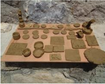
Resim 3: Seramik Atölyesi Çalışmaları