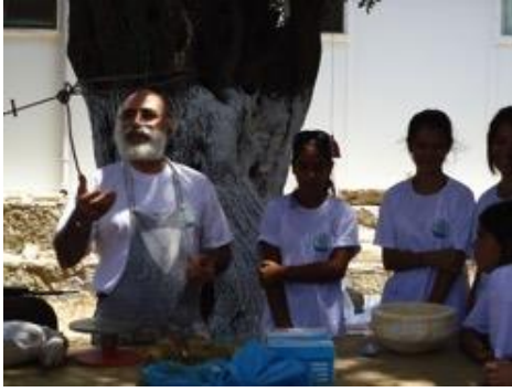
Resim 1: Seramik Atölyesi Çalışmaları