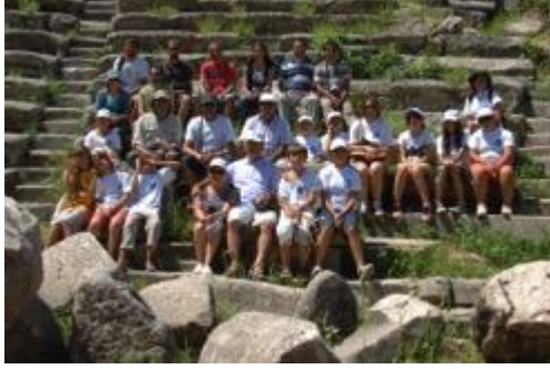
Resim 9: Stratonikeia antik kenti gezisi