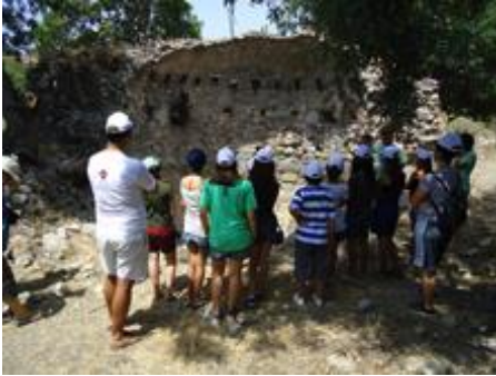
Resim 7: Kenti tanımaya yönelik geziler