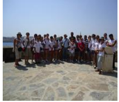
Resim 8: Müze gezisi