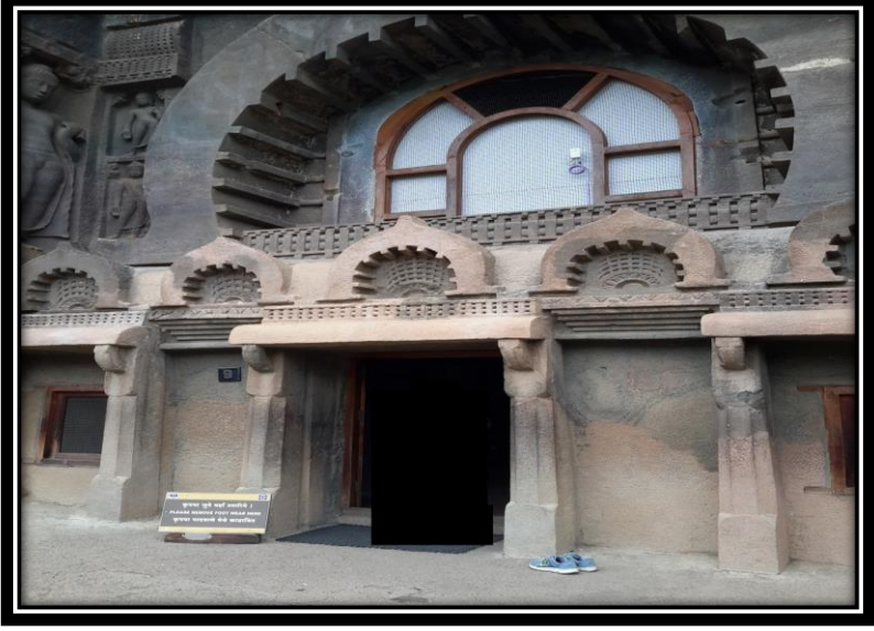
Ek 1- IX numaralı mağaranın ön cephesi.