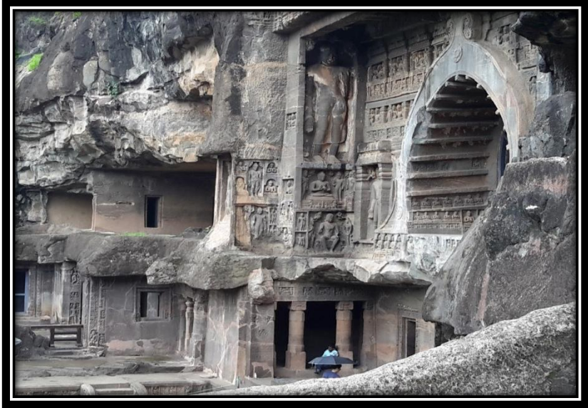
Ek 12- XXVI numaralı mağaranın sağ çaprazdan ön görünümü.