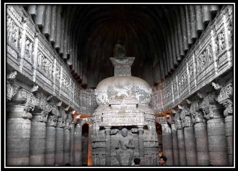
Ek 14- XXVI numaralı mağaranın içi; stüpa ve sütunlar.