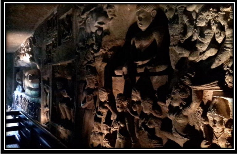
Ek 16- numaralı mağaranın iç duvarındaki “Māra’nın Baştan Çıkarma” sahnesini simgeleyen kompozisyon ve çok sayıdaki Bodhisattva ve Avalokiteşvara kabartması.