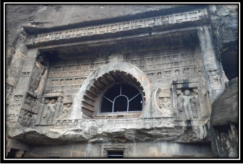
Ek 13- XXVI numaralı mağaranın çaitya penceresi ve Buddhist kültüre ait detaylar.