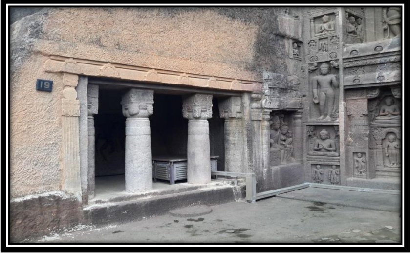
Ek 11- XIX numaralı mağaranın verandasındaki çileci hücresi.