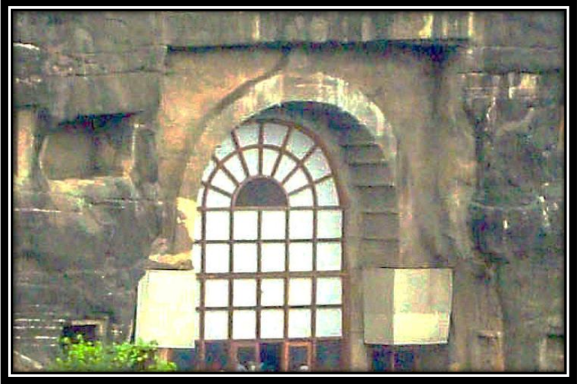
Ek 4- X numaralı mağaranın önden görünümü.