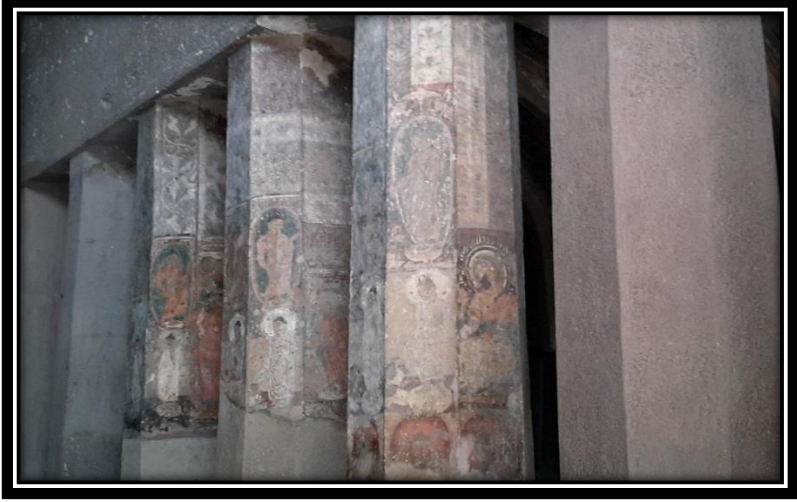
Ek 5- X numaralı mağaraya ait sütunlar ve sütun-duvar resimleri.