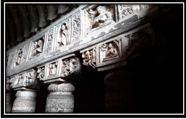
Ek 9- XIX numaralı mağaranın içi; sütun ve kirişlerdeki Buddha işlemleri.