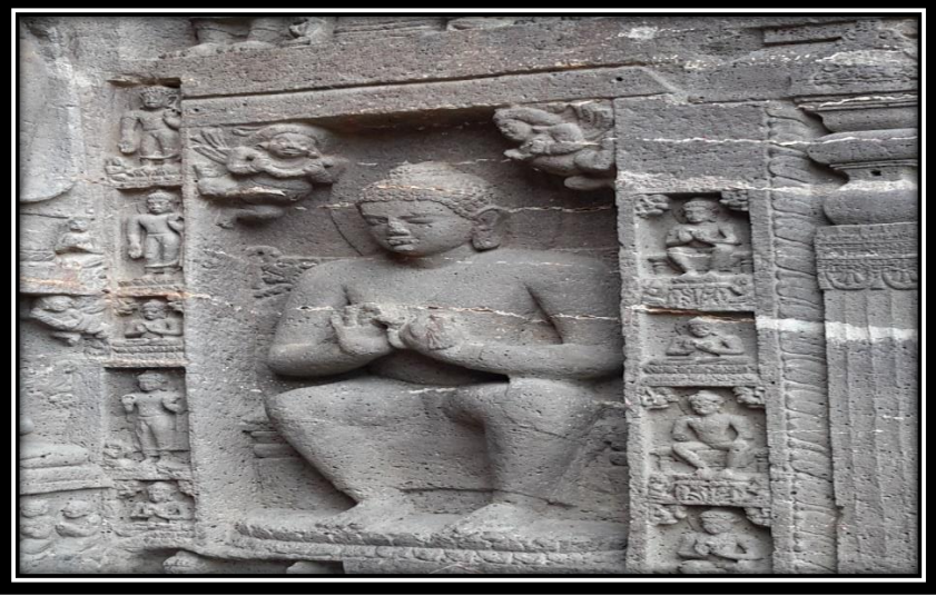
Ek 7- XIX numaralı mağaradaki Buddha kabartmaları.