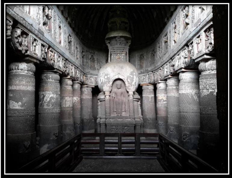
Ek 6- XIX numaralı çaityanın içi: stüpa ve sütun detayları.