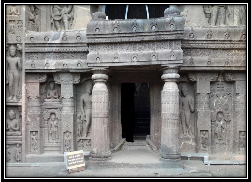
Ek 10- XIX numaralı mağaranın önden görünümü ve Buddha kabartmaları.