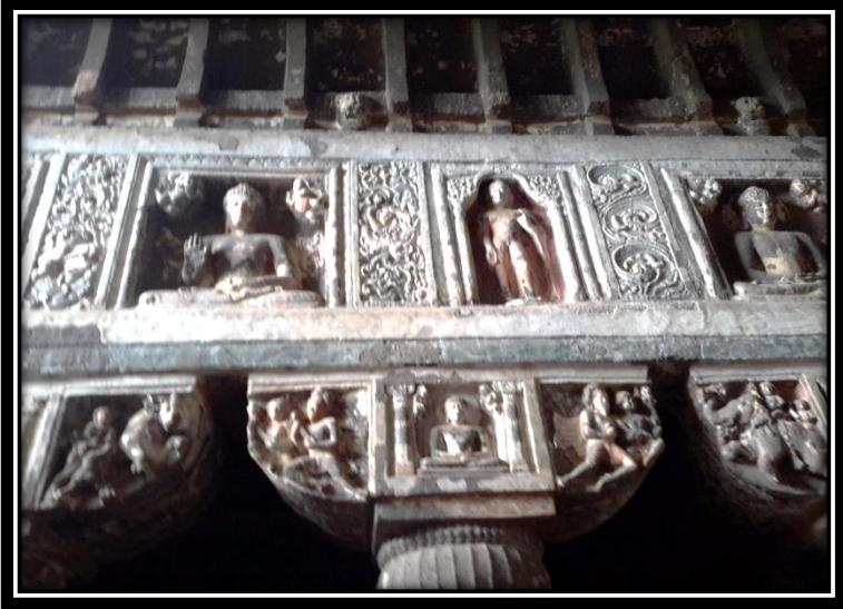
Ek 8- XIX numaralı mağaranın içi; sütun ve kirişlerdeki Buddha işlemleri.