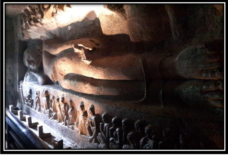
Ek 15 - XXVI numaralı mağaranın iç duvarındaki mahāparinirvāṇa kabartması.