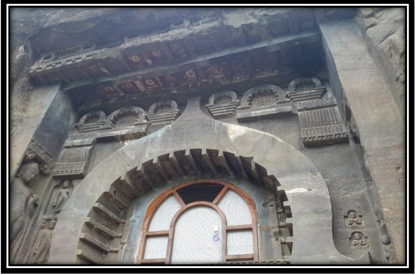
Ek 3- IX numaralı mağaranın çaitya penceresi.