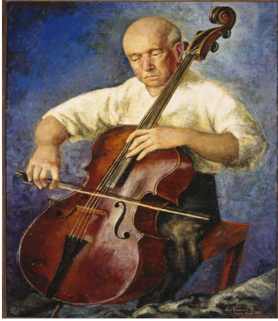
Resim 2: Portrait of Pablo Casals, Luis Quintanilla, 1957