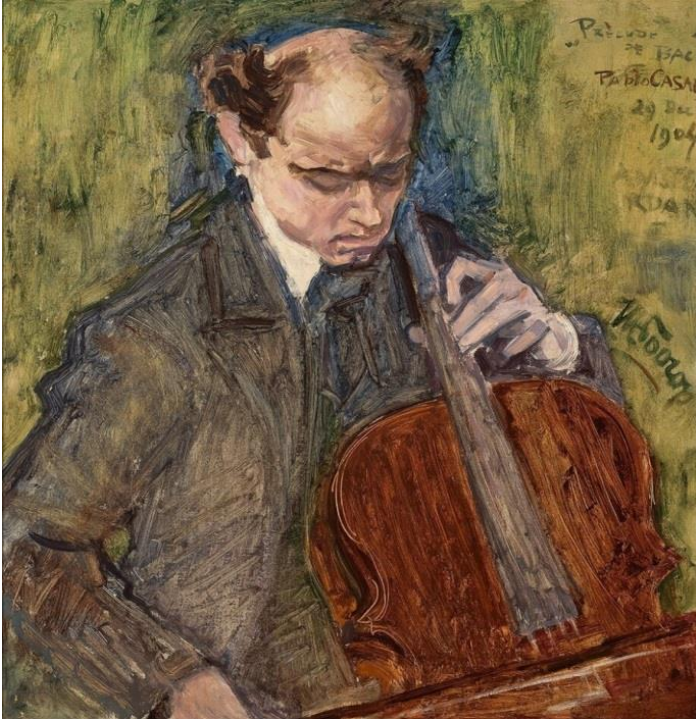
Resim 1: Portrait of Pablo Casals, Jan Toorop, 1904

Bu çalışmanın temel amacı, tüm dünyada örnek gösterilen bir sanatçının müziği ardındaki anlam ve fikirlerin standartlarını anlayarak kendini müzik yoluyla ifade etme şekli hakkında genel bir fikir edinmek ve yarattığı çello çalma tekniklerine değinip örnekler vererek müzik alanına katkıda bulunmaktır.