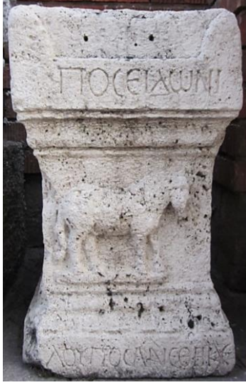
Resim 6: Konya Arkeoloji Müzesi'nde korunan Poseidon yazıtlı altar