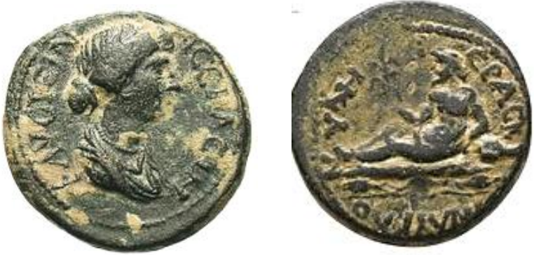
Resim 2: Hyde şehir sikkesi üzerindeki nehir tanrısı