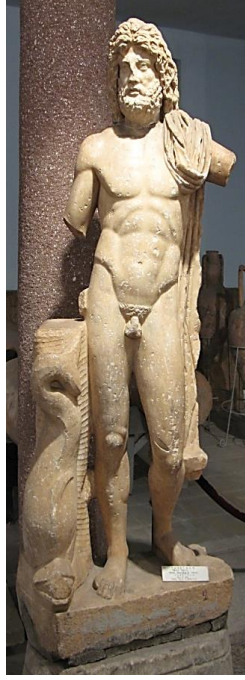
Resim 3: Konya Arkeoloji Müzesi'nde Poseidon yontusu