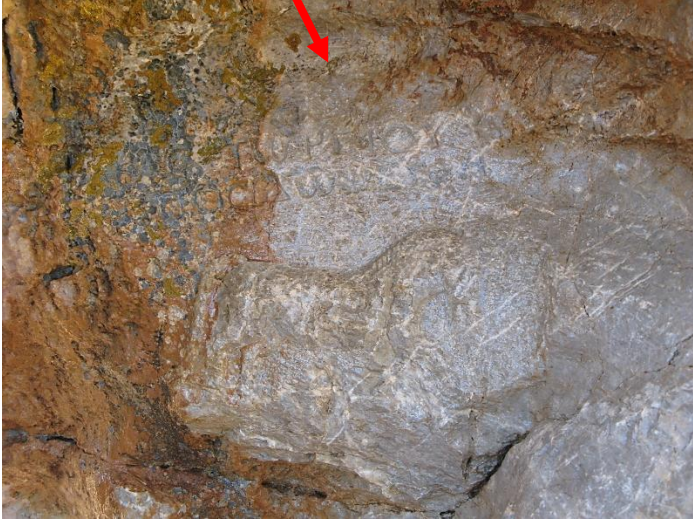
Resim 5: Tosuntaşı'ndan Poseidon kabartması