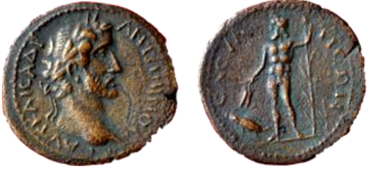
Resim 1: Savatra şehir sikkesi üzerindeki nehir tanrısı