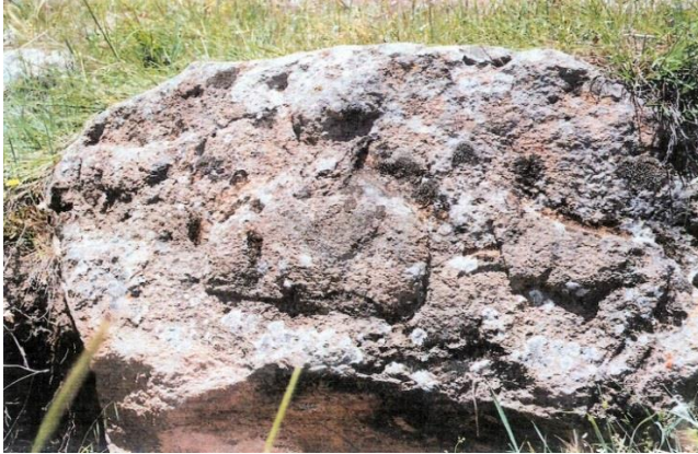
Resim 4: Fasıllar'dan Poseidon kabartması