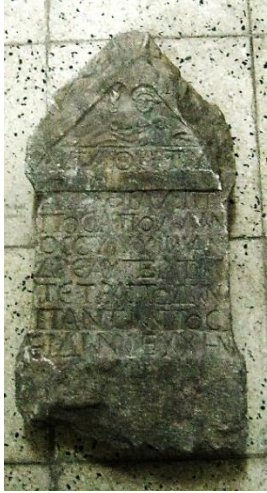
Resim 7: Konya Arkeoloji Müzesi'nde korunan Poseidon yazıtlı mezar steli