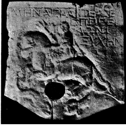
Resim 8: Poseidon kabartmalı altar