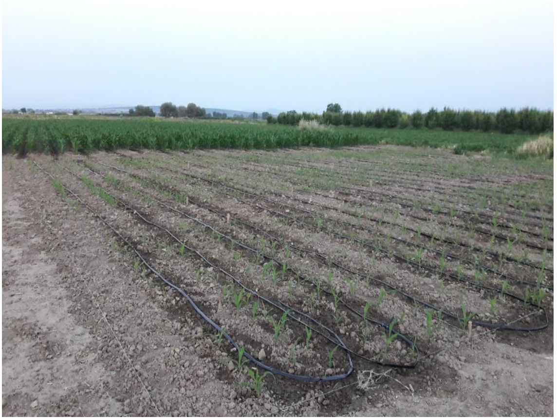
Şekil 3. 2. Deneme alanının damla sulama yöntemi ile sulanması

Her parselden kenar tesirleri atıldıktan sonra rastgele seçilen 10 bitki üzerinde yapılan ölçümler; bitki boyu, bitkide ilk koçan yüksekliği, bitkideki koçan sayısı, hasat nemi, 1000 tane ağırlığı, hektolitre ağırlığı, koçan uzunluğu, koçan çapı, koçanda sıra sayısı, sırada tane sayısı, koçanda tane sayısı, bitkide koçan sayısı ve tane verimidir (Şekil 3.3).