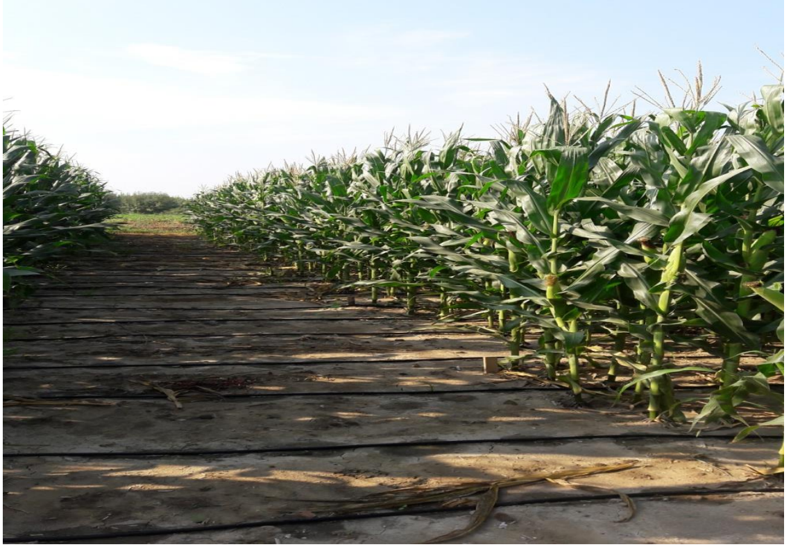
Şekil 3. 3. Deneme alanının genel görünümü