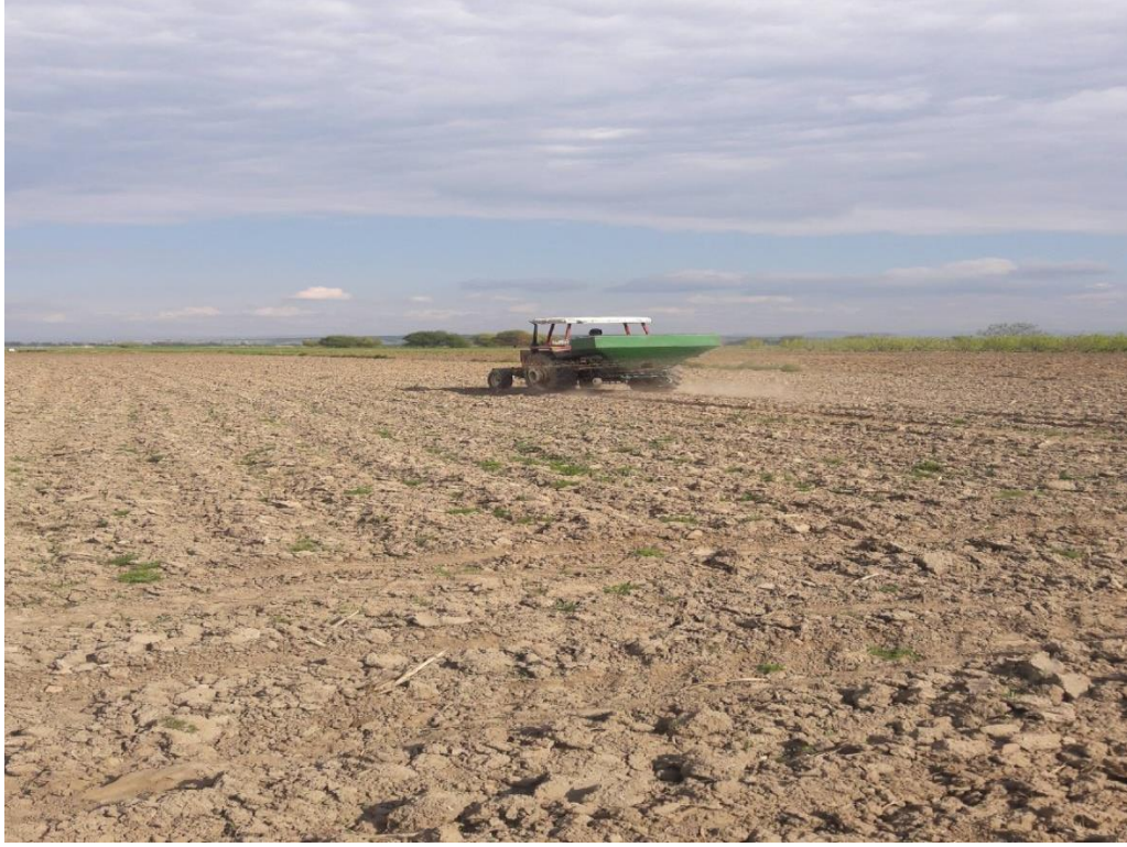
Şekil 3.1. Deneme alanının taban gübrelenmesi

Mısır 2-4 yapraklı döneme geldiğinde seyreltme işlemi yapılmıştır. Mısır 6-8 yapraklı dönemde çapa yapıp, dekara 20 kg üre gübresi (%46 N) gelecek şekilde damla sulama sistemi ile verilmiştir. Sulamalar toprağın nem durumuna, hava sıcaklıklarına ve bitki ihtiyacına bakılarak damla sulama sistemi ile sulanmıştır (Şekil 3.2.).