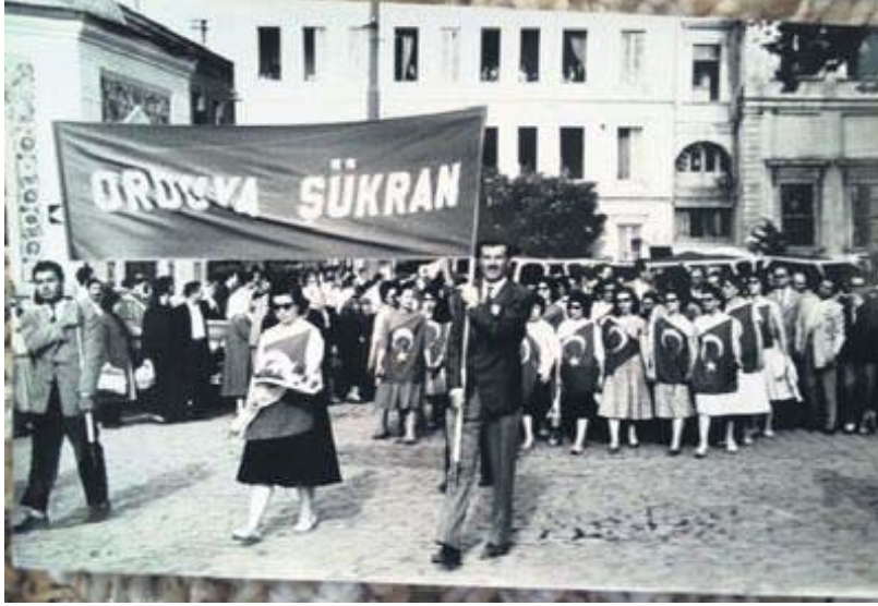
Fotoğraf 1: http://wowturkey.com/forum/viewtopic.php?t=57523&start=60

Türk siyasi hayatında ilk kez gerçekleşen 27 Mayıs askeri darbesi kendisini laik ve Atatürkçü olarak ifade eden kesimler tarafından desteklenmiştir. (EK1, EK2, EK3, EK4). Ordunun halk nezdinde koruyucu ve kurucu hüviyete sahip olması, siyasi otorite ve halk üzerinde gücünü arttırmasına ve itaat algısı yaratmasına sebep olmuştur. 27 Mayıs 1960 darbesinden sonra diğer darbelerin halk tarafından kabul edilmemesine rağmen darbecilere karşı çıkmak ve onları yargılamak mümkün olmamıştır. 19