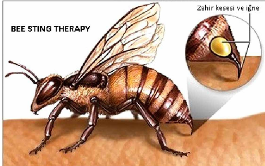
Resim 3. Arı zehri tedavisi uygulaması ( https://www.youtube.com/watch?v=Z3t-W6rvXRc sitesinden uyarlanmıştır).

Osteoartriti hastaların tedavisinde kullanımına yönelik yapılan bir çalışmada; 660 hastadan 544'ünün tamamen iyileştiği, 99'unun iyiye gittiği ve 17 hastada ise tedavinin başarısız olduğu bildirilmiştir (Akyüz, 2015).