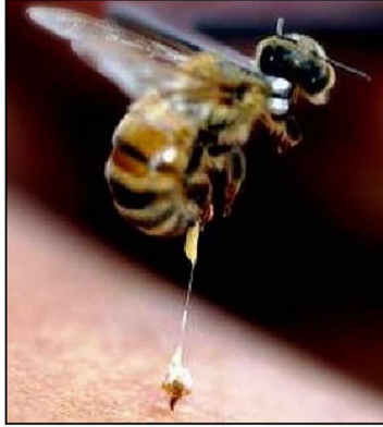
Resim 1. Arı sokması sonrası görünüm ( https://www.taichi-qigong.si/prehranska-dopolnila-prehranski-dodatki-za-100-bolezni/cebelji-piki/ ).