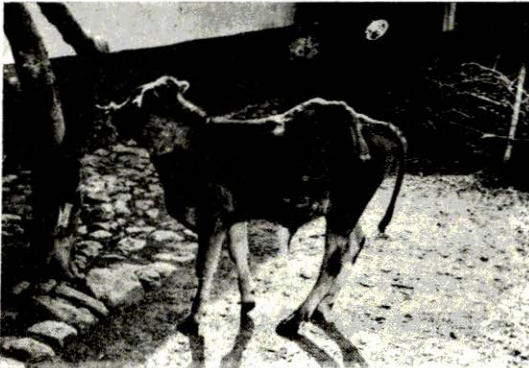
Resim: 1 Eklenik bacağın buzağının solundan görünüşü (Left side view of calf demonstrating position of extra leg)

Yapılan incelemede bu ekstremitenin scapula'sı dahil gelişmiş bir ön bacak olduğu anlaşıldı. Ancak röntgen çekmek veya bacağı diseke etmek olanağı olmadığından eklenik ön bacağın anatomik olarak nereye ve ne şekilde bağlandığını saptamak mümkün olmadı. Eklenik bacağın eklemlerinde herhangi bir bozukluk göze çarpmadı.