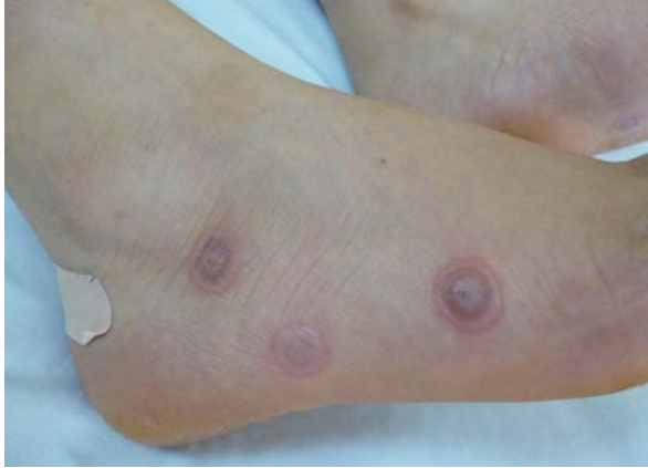
Şekil 5: Sağ ayak lateralinde targetoid lezyonlar

EM lezyonları hedef tahtası şeklinde ( Şekil 5 ) morumsu renkte makül, papül veya veziküllerle karakterize olup palmoplantar, yüz, boyun, el ve ayak sırtı, ekstremitelerin ekstansör yüzlerinde genellikle simetrik olarak yerleşir 1,7 . Tipik olarak akral yerleşim ön plandadır. Mukozal tutulum genellikle olmaz 7 . Hafif ateş ve grip benzeri bulgular eşlik edebilir. Bazen ilaç reaksiyonunun şiddeti artabilir, mukozal ve sistemik tutulum ile superepidermal ayrılma gözlenebilir 7 . Eğer subepidermal ayrılma vücut yüzey alanının %10'una ulaşıyorsa bu SJS olarak ifade edilir 7 .