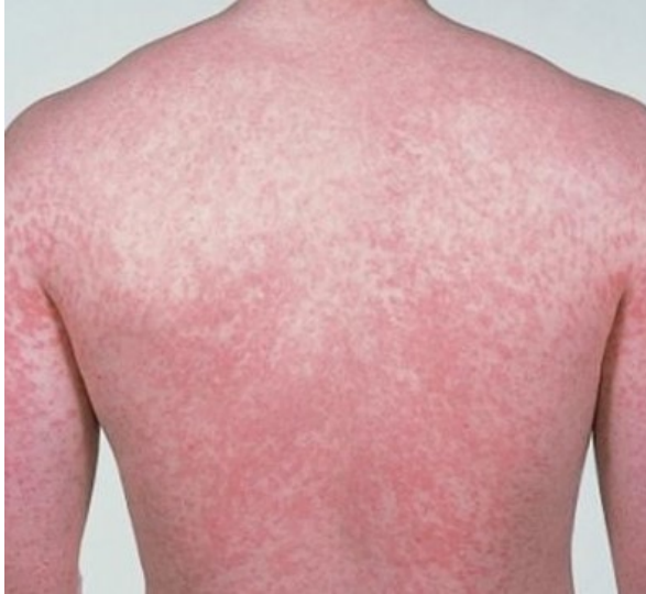
Şekil 1: Gövdede eritemli makulopapüller

Lezyonlar genellikle ilaç alımından 1-3 hafta içinde oluşur 2,19 . Viral ekzantem benzeri bir erupsiyon ile seyreder. Döküntü genellikle gövdeden başlayan ve ekstremitelere yayılan simetrik, yaygın eritemli makulopapüller şeklindedir ( Şekil 1 ). Hafif ateş, kaşıntı, eozinofili eşlik edebilir 19 . Palmoplantar tutulum sıktır. Birleşme eğilimi gösteren lezyonlar, kıvrım ve bası yerlerinde yoğunlaşabilir. Seyrinde eritrodermi gelişebilir. Döküntü genellikle skuamasyon ve bazen hiperpigmentasyon ile iyileşir 6 .