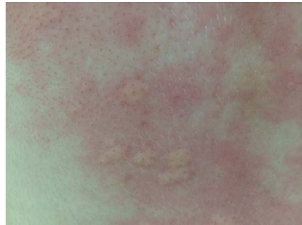
Şekil 2: Sırt derisinde eritemli, ödemli plaklar

Klinik genellikle ilaç alımını takiben ilk 36 saat içinde ortaya çıkar 7,18 . Klinik bulgular idiyopatik ürtiker ve anjioödemle benzerlik gösterir. Ürtiker foliküler belirginleşme gösteren, 24 saatte kaybolan, keskin sınırlı, kaşıntılı, eritemli, ödemli papül veya plaklarla ( Şekil 2 ) karakterizedir 19 . Anjioödem ise 24 saatten uzun sürebilen, derin dermis, subkutan ve mukozal bölgenin ödemi ile karakterizedir. Daha çok yüzde, dudaklar ve göz kapaklarında izlenir 7 . İlaça bağlı anjioödem genellikle ürtikerle birlikte seyreder, tek başına anjioödem az görülür 7 .