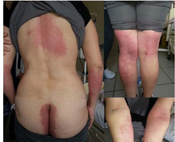
Şekil 4: SDRIFE olgusu

SDRIFE kliniği simetrik olarak göz etrafı, boyun, aksilla, inguinal bölge, kalça, anogenital bölge ve diğer fleksural alanlara lokalize, parlak eritemli ekzematize plaklarla karakterizedir 18,21 . Bu lezyonlar üzerinde papül, püstül ve veziküller bulunabilir. Palmoplantar, yüz ve mukoza tutulumu bulunmaz. Sistemik bulgular saptanmaz 21 . Daha çok erkeklerde görüldüğü bildirilmiştir 21 . Şekil 4'te lezyonları intergluteal bölge, sırt, simetrik olarak her iki bacak arka yüz ve bilateral önkollarda yerleşim gösteren SDRIFE olgusu görülmektedir.