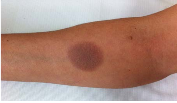
Şekil 3: Önkolda hiperpigmente plak

İlaç alımından birkaç saat veya gün içinde oluşur 7 . Aktif lezyonları mor renge çalan eritemli, yuvarlak veya oval, keskin sınırlı, genellikle soliter nadiren birden fazla bulunan plaklardır 7 . Yanma hissi olabilir ve lezyon merkezinde vezikül/bül oluşumu görülebilir. Ekstremiteler, dudaklar, oral mukoza, genital ve perianal bölge en sık etkilenen bölgelerdir 7,19 . Ateş, halsizlik, bulantı, kusma görülebilir.