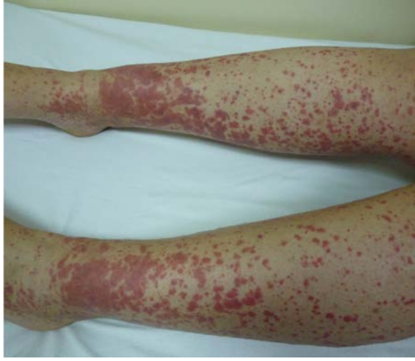
Şekil 6: Ekstremitelerde çok sayıda purpurik papüller (palpabl purpuralar)

kaşıntı, ayak bileği ödemi görülebilir 18 . Ateş, artralji, miyalji ve karın ağrısı sistemik tutulum belirtileri olarak sayılabilir 18 .