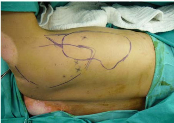
Şekil 7: Latissimus dorsi kas deri flebi planı