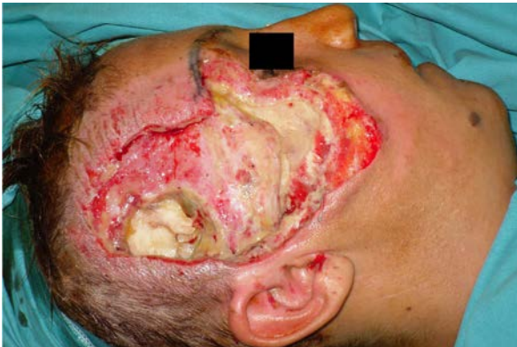
Şekil 6: Travma bağlı sağ yanak çevresinde doku defekti