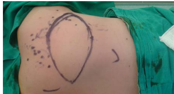
Şekil 11: Scapular serbest flep planı