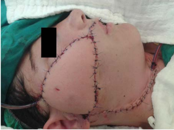
Şekil 12: Alıcı alana anastomoz yapılmış serbest flep

Bahsi geçen fleplerin donör alanlarının primer kapatılması radial ön kol flebine göre avantajlıdır fakat radial ön kol flebini vasküler açıdan zengin yapısı, ince olması ve cerrahi olarak kolay hazırlanabilmesi hala bu flebi intraoral defekt rekonstrüksiyonunda ilk tercih yapmaktadır.