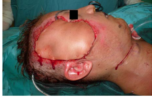
Şekil 8: Alıcı alana anastomoz yapılmış serbest flep