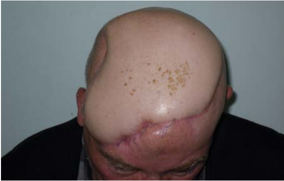
Şekil 5: Ameliyat sonrası 1. Yıl görünüm