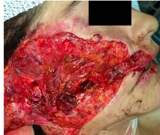
Şekil 10: Travmaya bağlı sağ yanak çevresi doku defekti