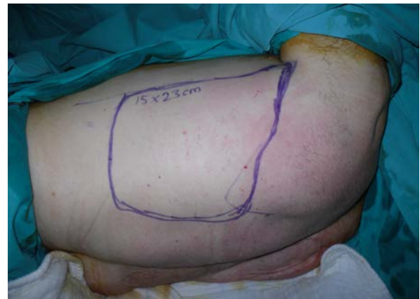
Şekil 3: Latissimus dorsi kas deri flebi planı