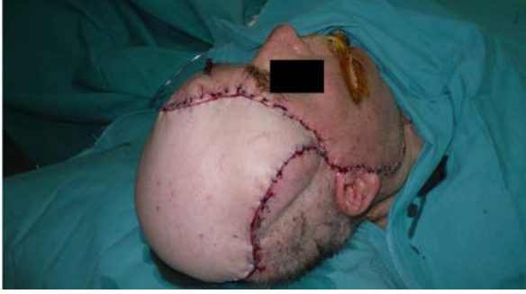
Şekil 4: Alıcı alana anastomoz yapılmış serbest flep