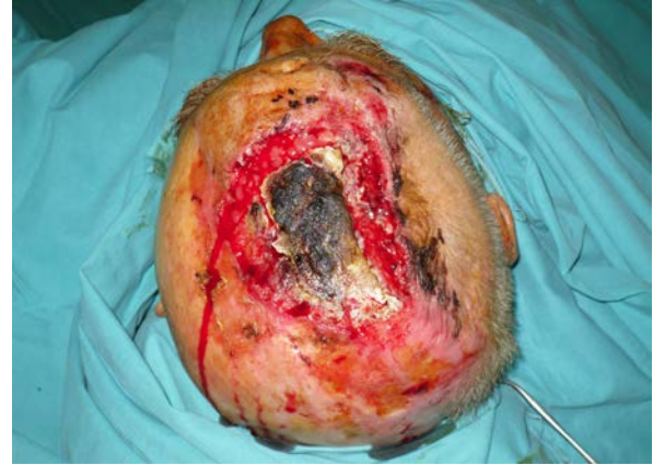
Şekil 1: Scalpte yerleşik yassı hücreli karsinoma

oral ve alt dudak defektlerinde ilk tercihin radial ön kol flebi olduğu görüldü.