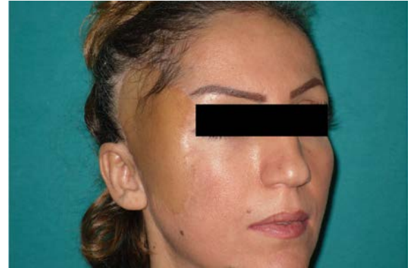
Şekil 9: Ameliyat sonrası 1. Yıl