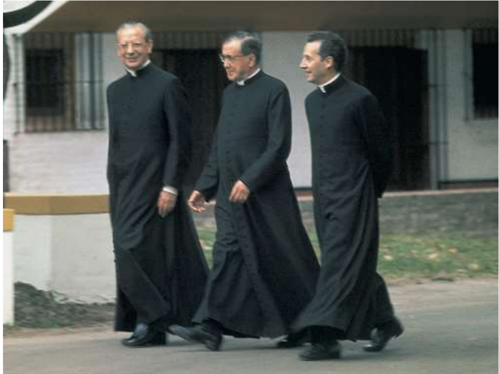
Tarikatın kurucusu Josemaría Escrivá (ortada), Escrivá'nın halefi Don Álvaro del Portillo (solda); tarikatın üçüncü piskoposu Javier Echevarría (sağda)