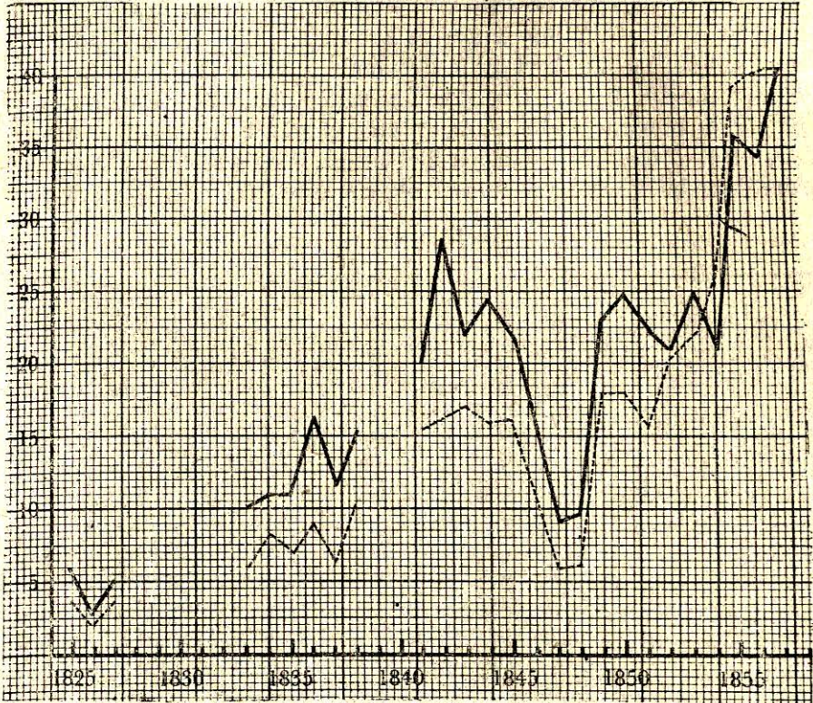
1825 ile 1857 arasında Beyrut'tan yapılan ticaret (Milyon Frank)