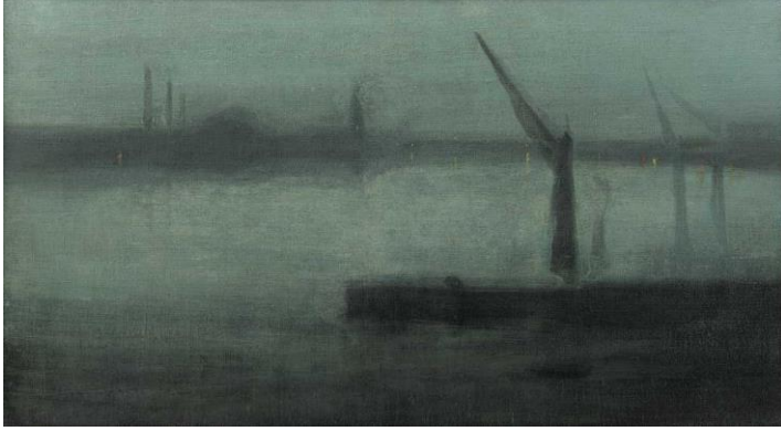
Resim 4: James McNeill Whistler “Thames River” (2020)

Debussy birçok şair ve ressam arkadaşından etkilenmiştir. Bu yüzden Debussy, Noktürnler’ini bestelerken, Whistler’in Thames nehriindeki gece görüntülerinin katkısı olmuş, Verlaine ve Mallarme’nin dizeleri de Debussy’nin eserlerine yansımıştır (Doğan, 2013: 3; İlyasoğlu, 2003: 202).