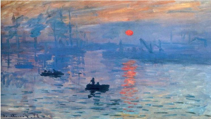
Resim 1: Claude Monet “Soleil Levant” (İzlenim: Gündoğumu) (2020)

İzlenimci ressamlar, ışığın, gölgenin ve rengin nesnelere üzerinde her an değişmiş olmasını ele alırlar. Bu ressamların tercihi, gördükleri nesnelere biçimi, renkleri ve anlık görüntüleridir. Onlar için güneş ışığı ve renk kavramı çok önemlidir. Bu açıklamaya uygun en iyi örneklerden biri, izlenimci akımın öncülerinden olan Claude Monet’in, günün farklı zamanlarında, ışığın renkleri nasıl etkilediğini, denize yansıyan güneşin doğuşu ile resmettiği tablosudur (Haznedar, 2015: 9, Çevik, 2007: 102). İzlenimcilik akımı adını 1874 yılında Claude Monet’in Paris’te sergilenen “impression: Soleil Levant” (İzlenim: Gündoğumu) tablosundan almıştır (bk. Resim 1).