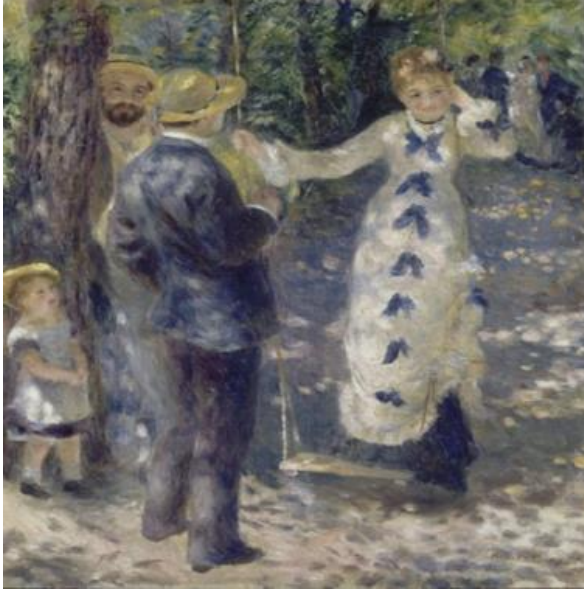
Resim 2: Pierre Auguste Renoir “The Swing” (Salıncak) (2020)

İzlenimci ressamların tablolarına yakından bakıldığında, fırça darbelerinin hafif ama düzensiz olduğu, uzaktan bakınca da o fırça darbelerinin ve benekli ışık yönteminin harmanlanarak bir bütün oluşturduğu gözlenmiştir. Daha önce görülmemiş olan bu teknik ile yapılan resimler, sanat tarihinde büyük tepkilere yol açmış ve bunun üzerine halk, düzensiz ve hızlıca yapılmış gibi görünen bu resimleri, kendileriyle alay edildiğini düşünerek acımasızca eleştirmişlerdir (Barbur, 2008: 6; Altuna, 1970: 25; Dede, 2004: 4). Zamanla kabul gören akım ardından en başta müzik sanatına ve bestecilere esin kaynağı olmuştur.