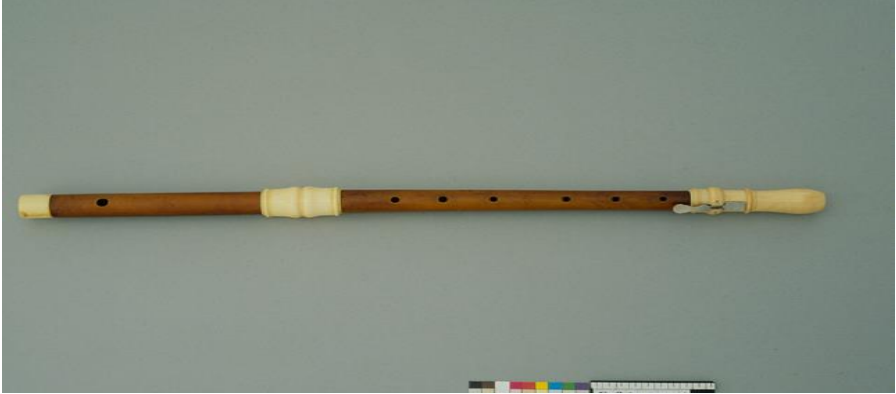
Resim 7: Jacques Hotteterre tarafından re diyez perdesi eklenmiş flüt (Europeana, 2020).

Barok Dönem'e gelindiğinde, flüt üç parçaya ayrılmıştır ve flüte perdeler dâhil olmuştur. Erken Barok Dönem flütleri, Rönesans Dönemi'ndeki flütlerle benzerlik göstermektedir. Altı delikten oluşmuştur ve bununla birlikte flüte, re diyez perdesi eklenmiştir. Bu dönemde Jacques Hotteterre adlı Fransız çalgı yapımcısı, flütü yeniden tasarlamıştır (Dik, 2016: 327; Şenol & Demirbatır, 2011: 587).