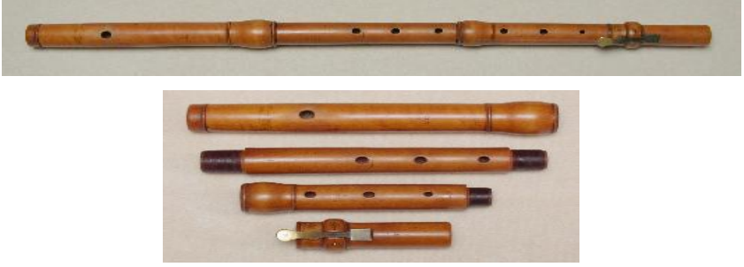
Resim 8: Jacques Hotteterre tarafından yapılan 4 parçalı flüt (Baroque flutes, 2020)

Klasik Dönem’de ise flüt gelişimini devam ettirmiştir. İngiliz çalgı yapımcıları, flüte do ve do diyez perdeleri eklemek için iki delik daha eklemişlerdir. Böylelikle flütün boyu, biraz daha uzamıştır (Powell, 2002; Şenol & Demirbatır’dan 2011: 589; Rockstro, 1928; Dik’den 2016: 329).