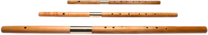
Resim 6: Rönesans flüt örneği (alto flüt- tenor flüt- bas flüt) (Tomaszewicz, 2020).

Barok Dönem'e gelindiğinde, flüt üç parçaya ayrılmıştır ve flüte perdeler dâhil olmuştur. Erken Barok Dönem flütleri, Rönesans Dönemi'ndeki flütlerle benzerlik göstermektedir. Altı delikten oluşmuştur ve bununla birlikte flüte, re diyez perdesi eklenmiştir. Bu dönemde Jacques Hotteterre adlı Fransız çalgı yapımcısı, flütü yeniden tasarlamıştır (Dik, 2016: 327; Şenol & Demirbatır, 2011: 587).