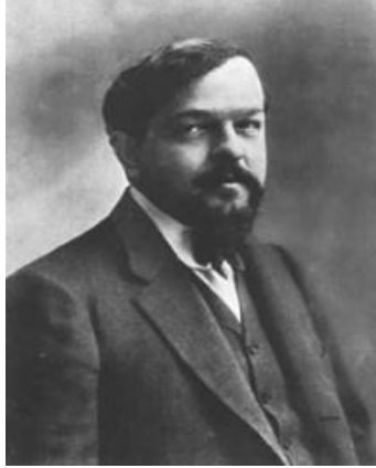
Resim 3: Claude Debussy (1862-1918)