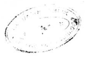
Belge 3: DH. KMS. Dosya No: 52.5 Vesika No: 16