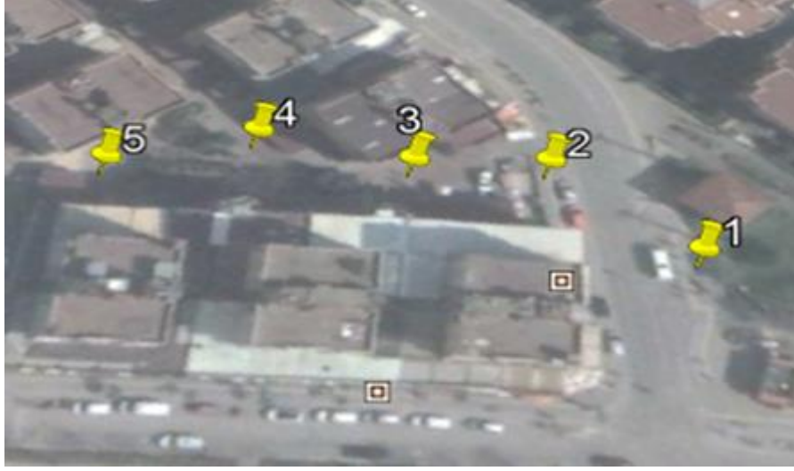
Şekil 1: Ölçüm yapılan noktaların uydu görüntüsü

boyunca 20-25 m aralıkla ve canlı müziğin yapıldığı yarı açık eğlence yerlerine yaklaşık 5-7 metre mesafede bulunmaktadır. Yoğun olarak otomobil ve otobüslerin geçtiği 1 numaralı nokta ise, 2 numaralı noktaya 10 m mesafede olup, ölçüm yapılan sokaktan ne kadar gürültü kaynaklandığını sorgulamak üzere harita üzerinde işaretlenmiştir. Ayrıca, çalışmada JMP 7.0 istatistik yazılım programında varyans analizi yapılarak gürültü ölçümleri değerlendirilmiştir.