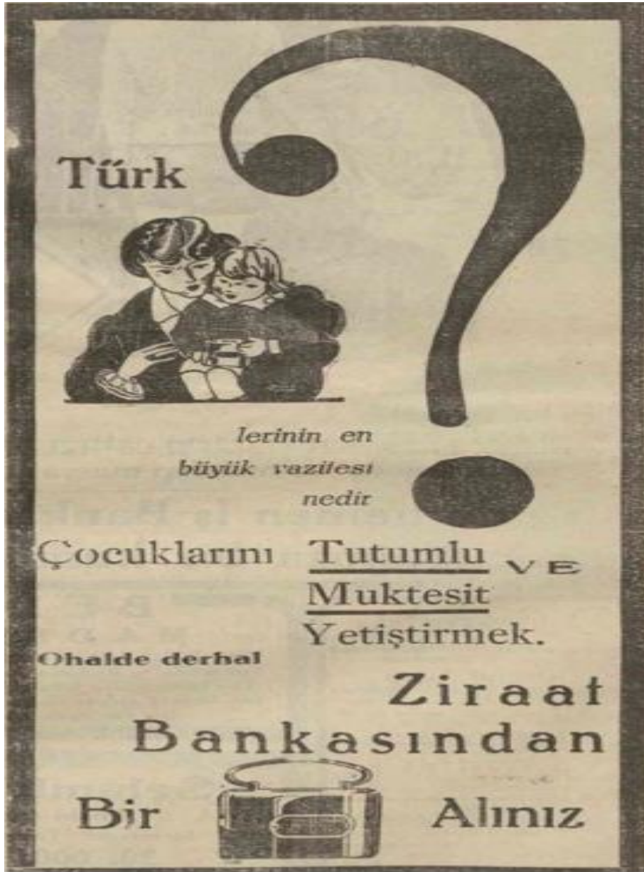
Ek:27. Vakit, 03.12.1932, s.11.