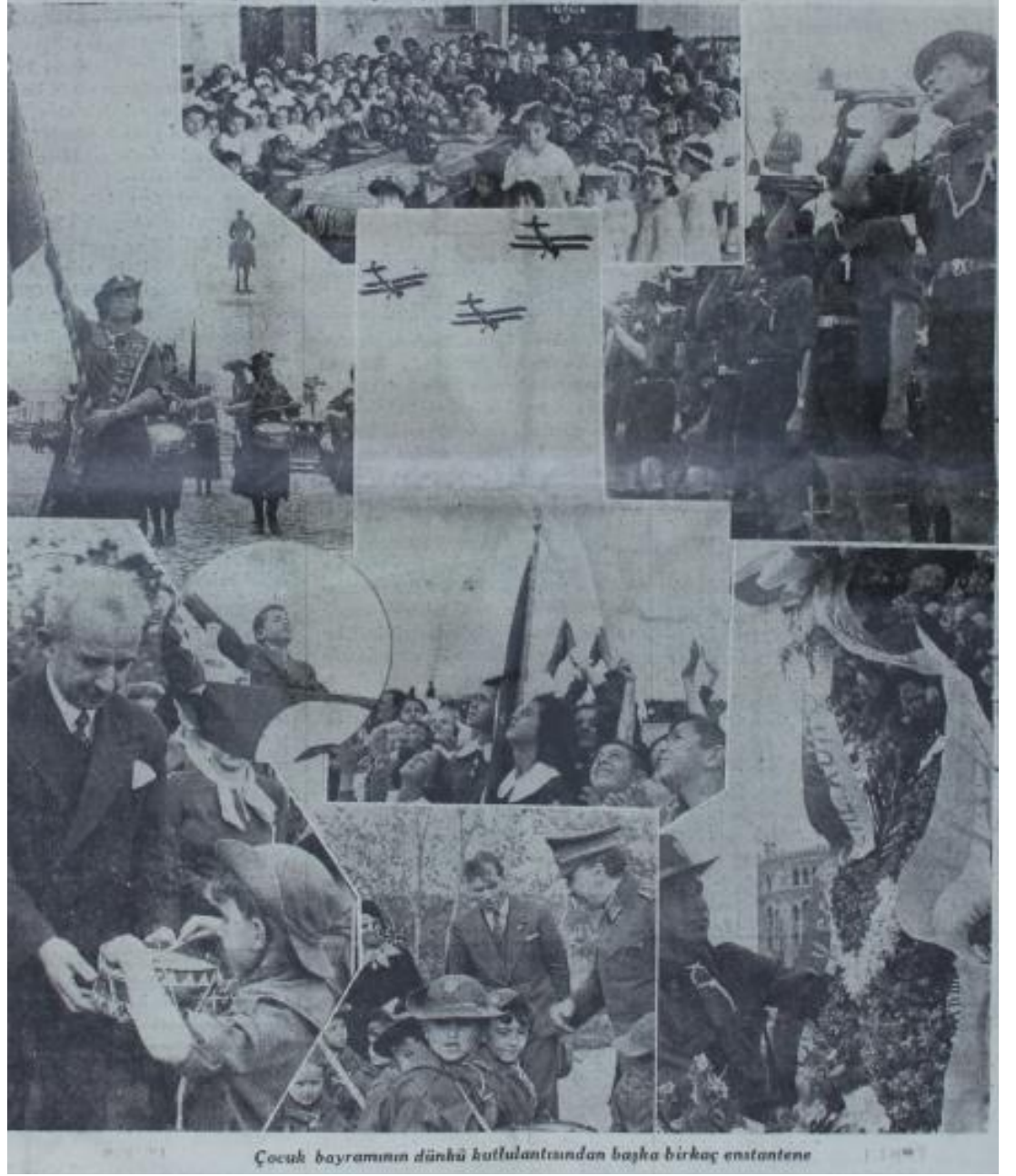
Ek: 5. Ulus, Çocuk Bayramı, 24 Nisan 1936.