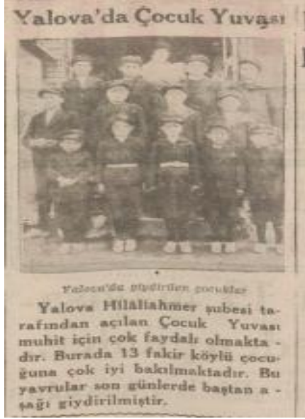
Ek: 25. Cumhuriyet, 21.05.1932