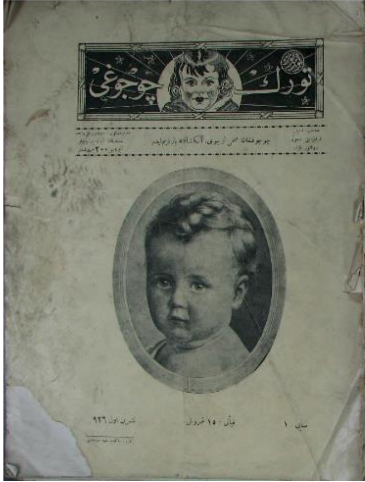
Ek: 23. Gurbuz Türk Çocuğu, S.1, Ekim 1927.