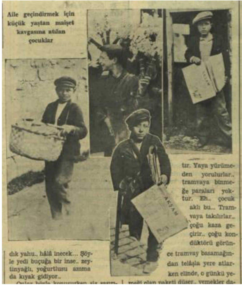
Ek: 11. Akşam, Çalışan ve Aile Geçindiren Çocukları da Düşünmeliyiz, 23 Nisan 1937.