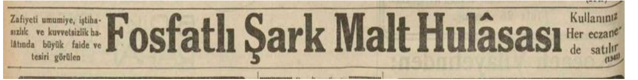
Ek: 18. Vakit, Fosfatlı Şark Malt Hulasası, 18 Nisan 1933.