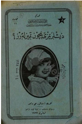
Ek: 24. Dişlerimizi Niçin Temizleriz?, 1927.