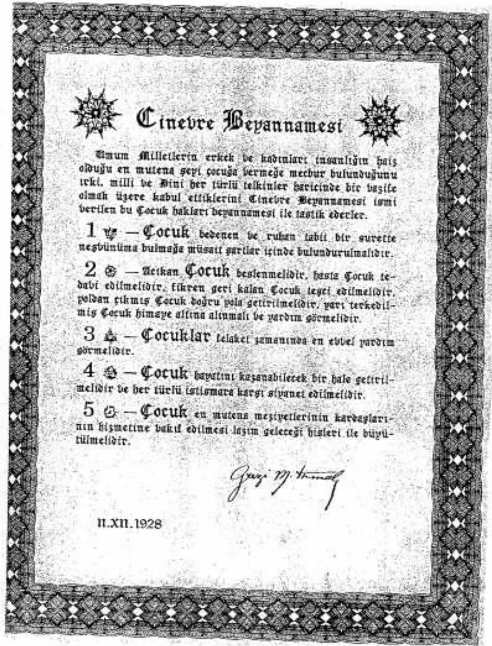
Ek: 2. Cenevre Beyannamesi, Çocuk Hakları Beyannamesi, http://www.cocukhaklariizleme.org/wp-content/uploads/Genevre-Beyannamesi.jpg (E.T. : 14.11.2020)