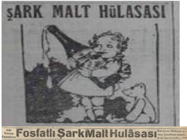
Ek: 19. Cumhuriyet, Şark Malt Hulasası, 18 Mart 1929., 04.12.1934.