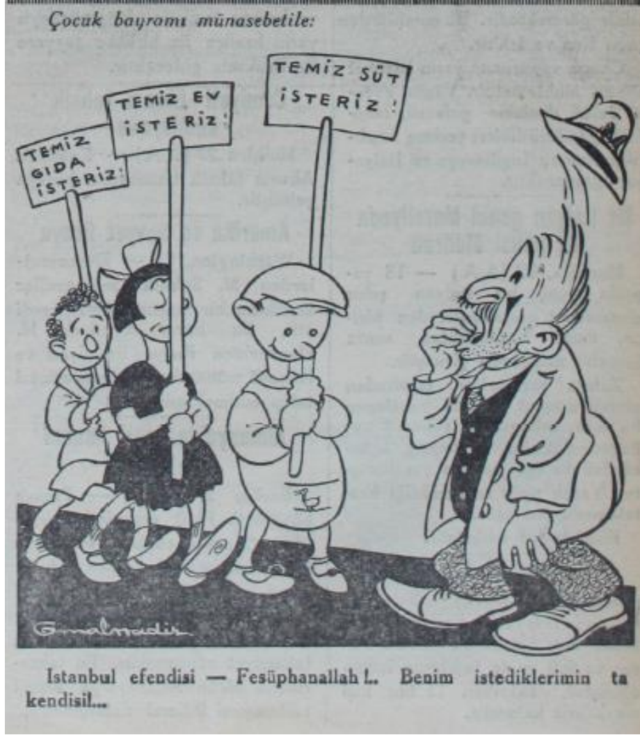
Ek: 7. Akşam, Çocuk Bayramı, 23 Nisan 1932.