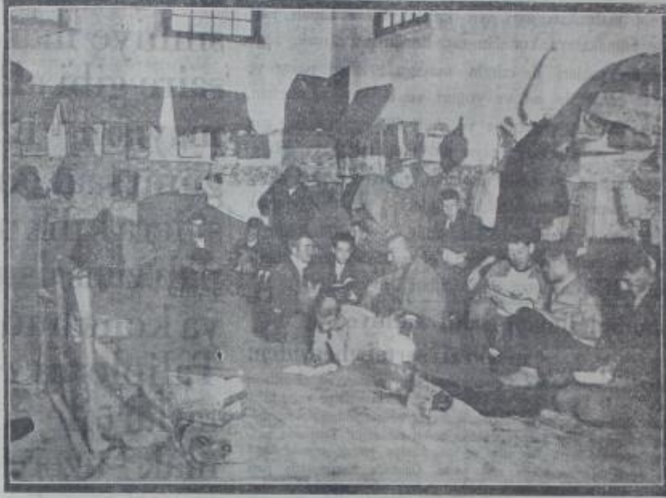
Ek: 21. Cumhuriyet, 23 Nisan 1929.

Bunlar kaderin sillesini yemiş biçare vatan yavrularıdır. Onlar için ıslahane yaptınız