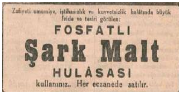
Ek: 20. Son Posta, Şark Malt Hulasası, 05.06.1933.