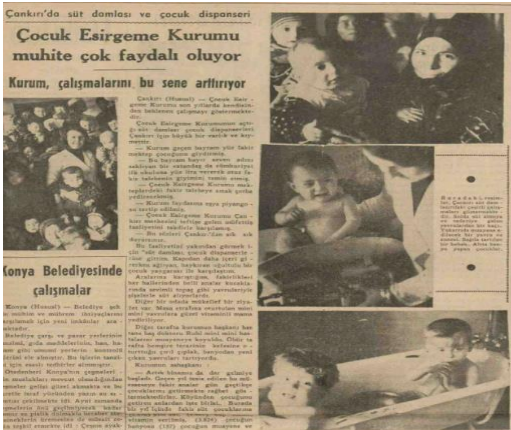
Ek:10. Ulus, Çocuk Esirgeme Kurumu Muhite Çok Faydalı Oluyor, 19 Şubat 1939.