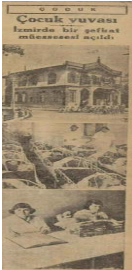
Ek: 25. Milliyet, 30.04.1930.