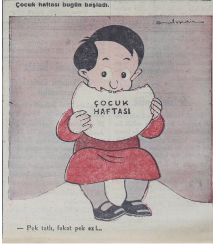
Ek: 9. Akşam, Çocuk Haftası, 23 Nisan 1933, s.2.