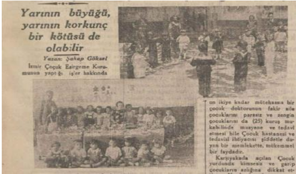
Ek:10. Anadolu, Yarının Büyüğünü Daha Etraflı Düşünmek Gerek, 3 Mart 1938.