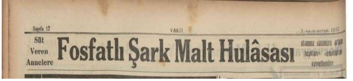
Ek: 17. Vakit, Fosfatlı Şark Malt Hulasası, 4 Aralık 1932.