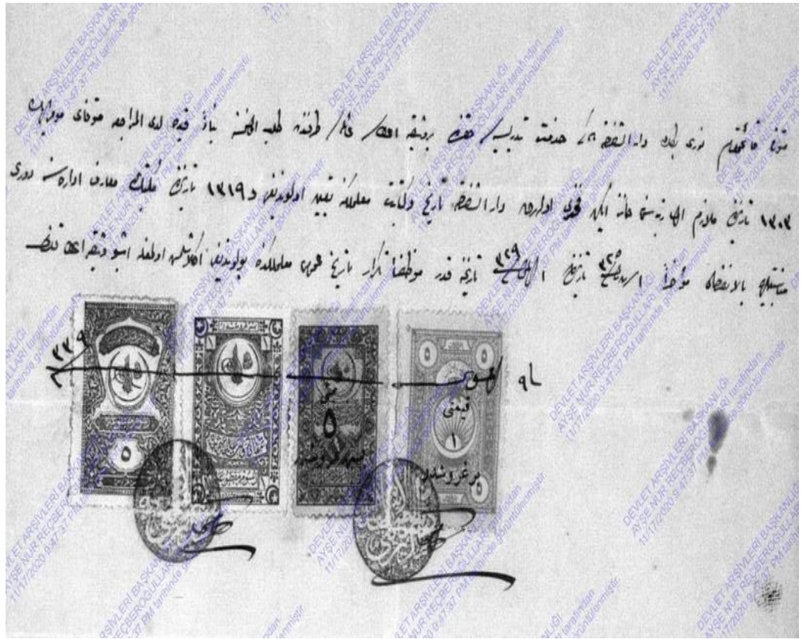
Ek: 3. Şehit çocuklarının okullarda parasız yatılı olarak okutulması. B.C.A. Yer: 65-323-1 Kurum: 180-9-0-0/Genel 22.10.1923-25.10.1923