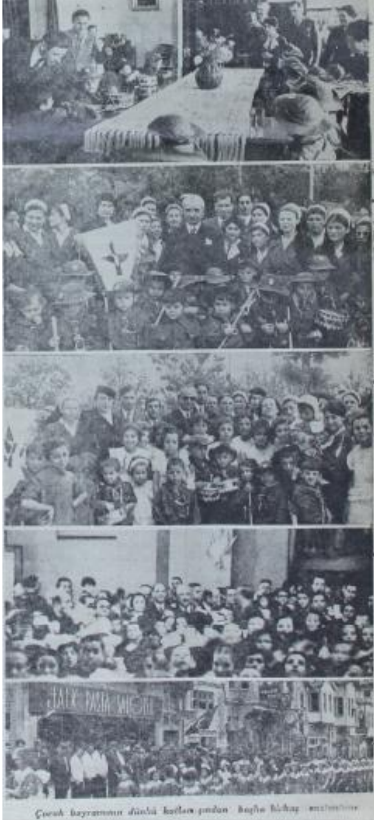
Ek: 6. Ulus, Çocuk Bayramı, 24 Nisan 1936.