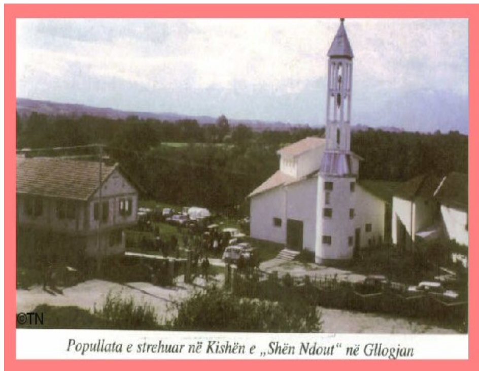
Popullata e strehuar në Kishën e „Shën Ndout“ në Glogjan