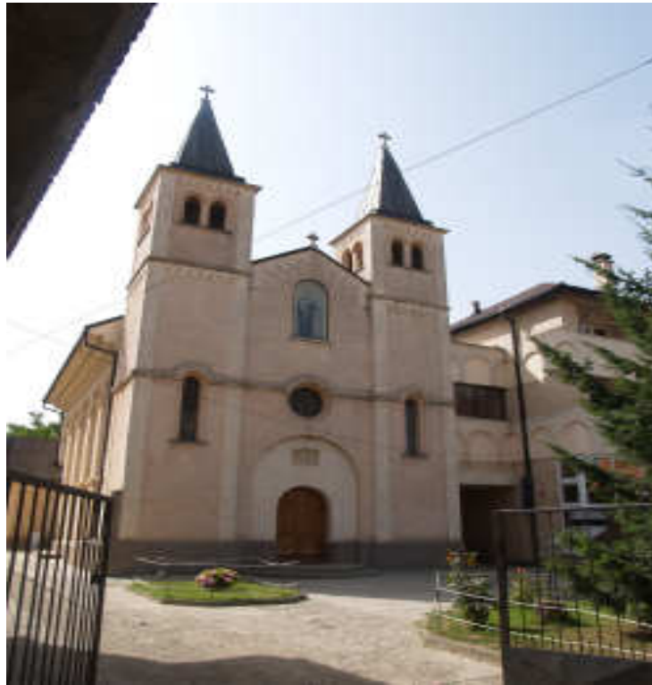
Gjakova'da "Shen Ndou" Kilisesi