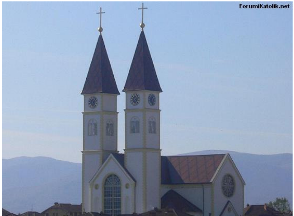
Gjakova'da "Aziz Pavlus" Kilisesi