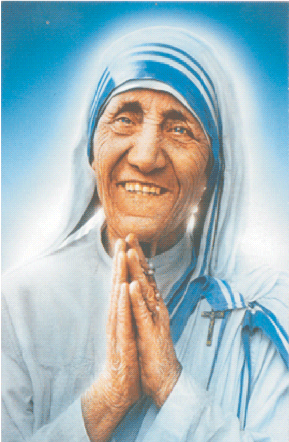
Rahibe Teresa (1910-1997)