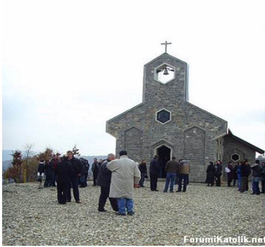
Kravasari (Karvansaray)'de "Shen Masjani" Kilisesi