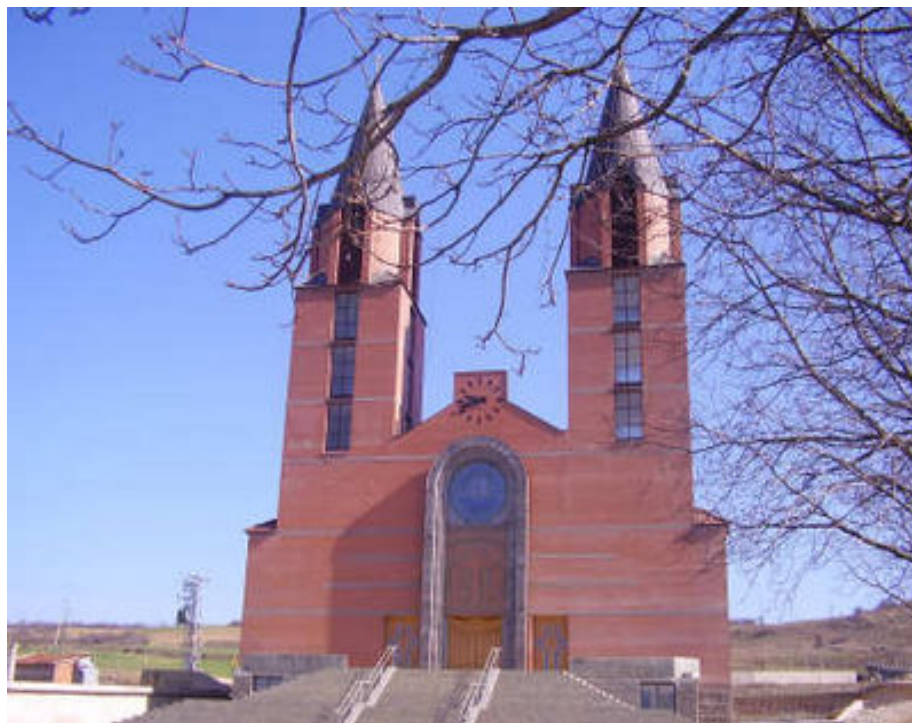
Klina'da "Zoja e Keshillit te Mire" Kilisesi