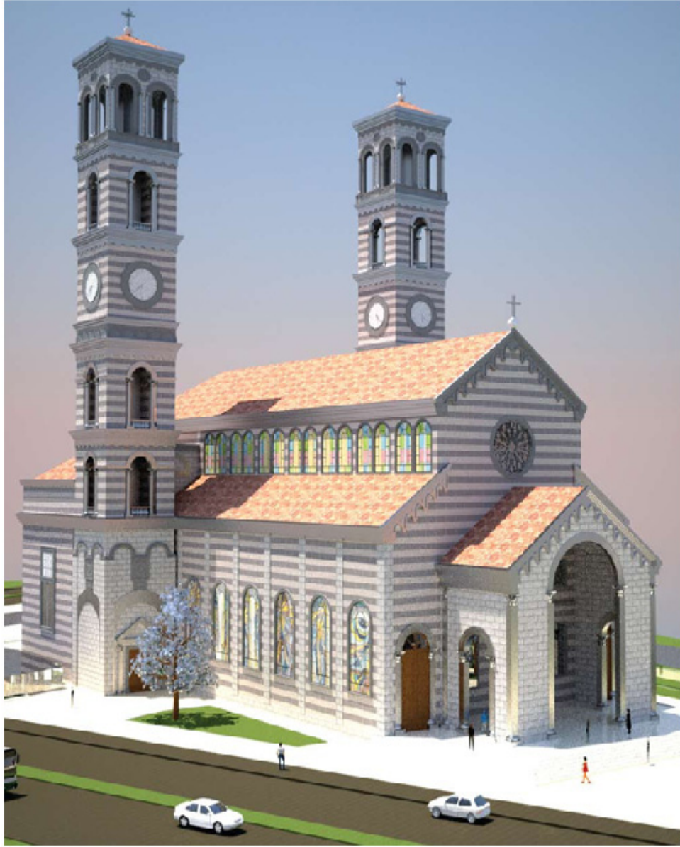
Prištine’de yapılmakta olan “Nëna Terezë” (Rahibe Teresa) Katedralesini’nin Proje Görüntüsü