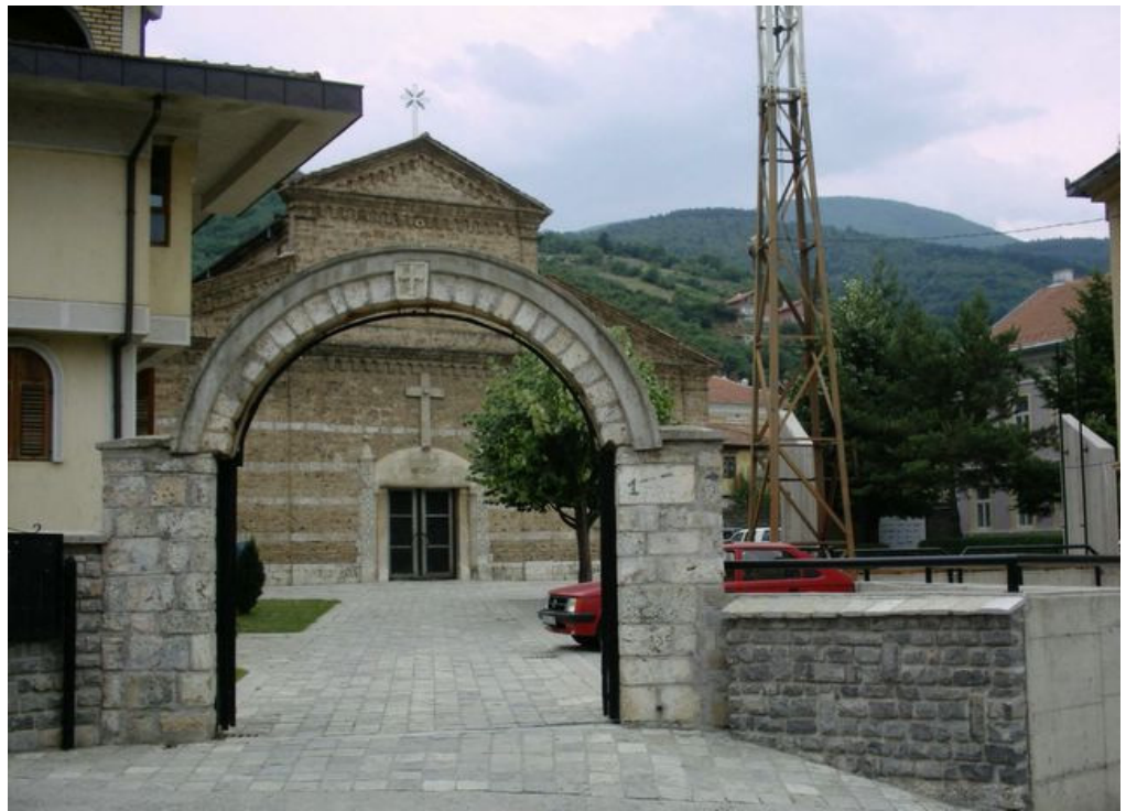
Prizren'de "Zoja Ndhmetare" Kilisesi