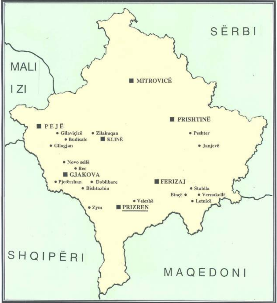
Kosova'daki Katolik Kiliselerinin buldukları yerler