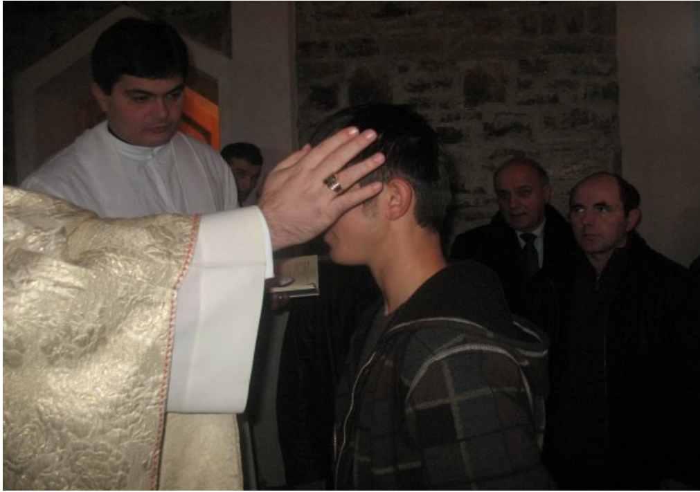
Konfirmasyon (Krezmimi) Ayininden görüntüler