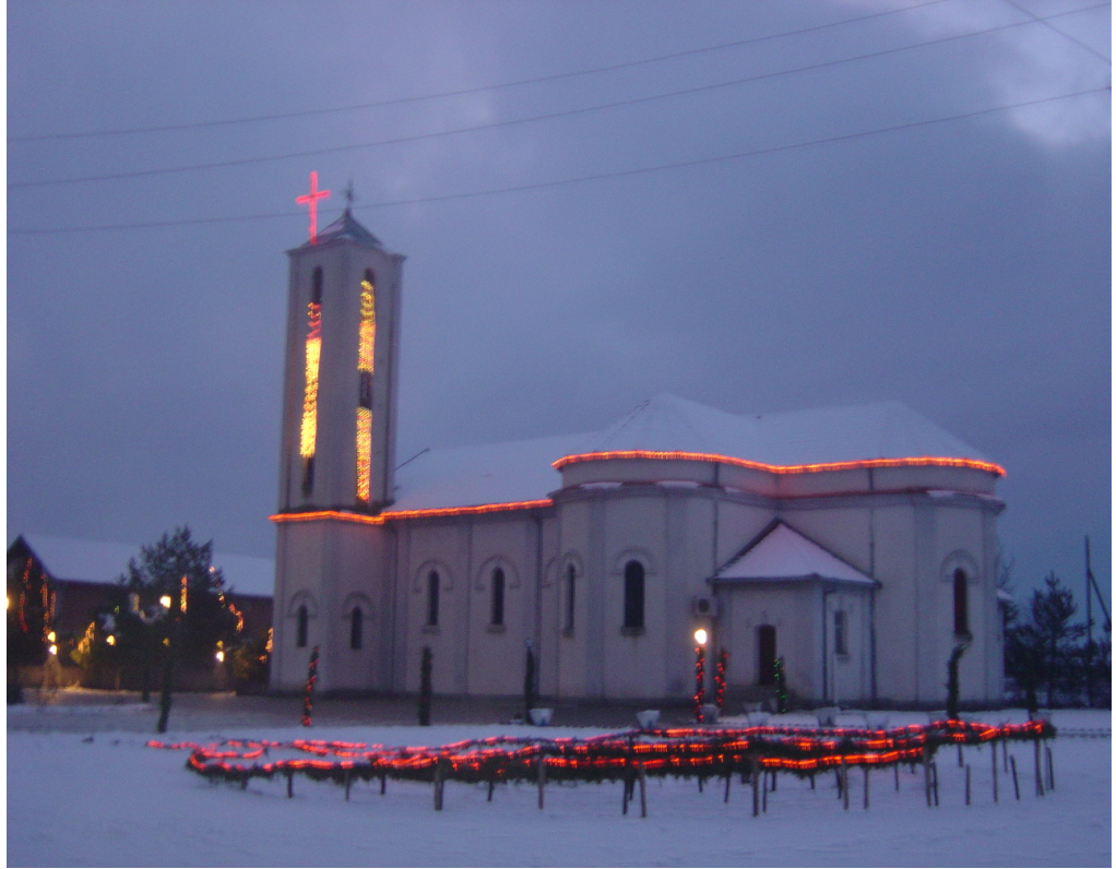
Zllakuqan'da "Gjon Pagzusi" Kilisesi