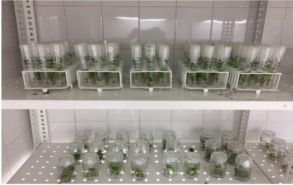
Şekil 3.2.2. Test tüplerinde bulunan eksplantların iklim odasındaki görüntüsü