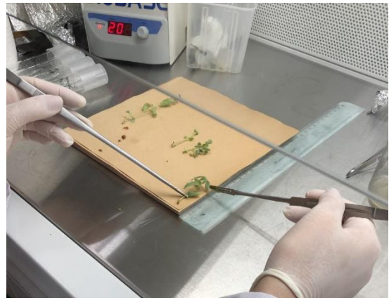
Şekil 3.2.3. Dört hafta sonunda eksplantlardan gelişen mikro sürgünlerin belirlenen parametreler bakımından incelenmesi