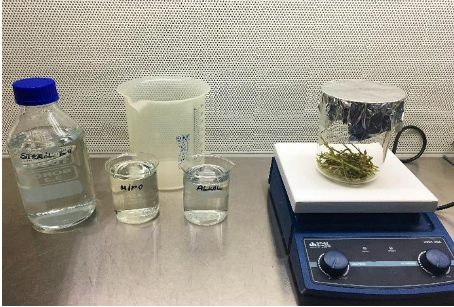
Şekil 3.2.1. Biyogüvenlik kabini içerisindeki yüzey sterilizasyonu işlemi

Büyük saksılara dikilmiş olan sağlıklı ana bitkilerden, aktif büyüme dönemlerinde (Mart-Nisan) kesilerek alınan 10-15 cm uzunluğundaki sürgünler laboratuvarın ön hazırlık odasına getirilmiş ve yüzey sterilizasyonu için hazırlanmıştır. Çeliklerin yaprakları kesilerek uzaklaştırılmış ve koltukaltı tomurcuklarını içeren küçük parçalara ayrılmışlardır. Beher içerisindeki eksplanlar akan su altında antibakteriyal bir sıvı sabunla birkaç dakika çalkalanarak yıkanmışlardır. Ön işlemler yapıldıktan sonra steril kabin içerisine alınan eksplantlar %70'lik etil alkol ile 1 dakika muamele edilmiş ardından 2 kere steril bidestile su ile durulama işlemi yapılmıştır. Hemen sonra içerisinde %10'luk konsantrasyonda sodyum hypoklorit ve birkaç damla Tween 20 bulunan solüsyon ile 18 dakika boyunca muamele edilmiş ardından 3 defa steril bidestile su ile durularak bal yemişi eksplantlarının yüzey sterilizasyonu aşaması tamamlanmıştır (Şekil 3.2.1).