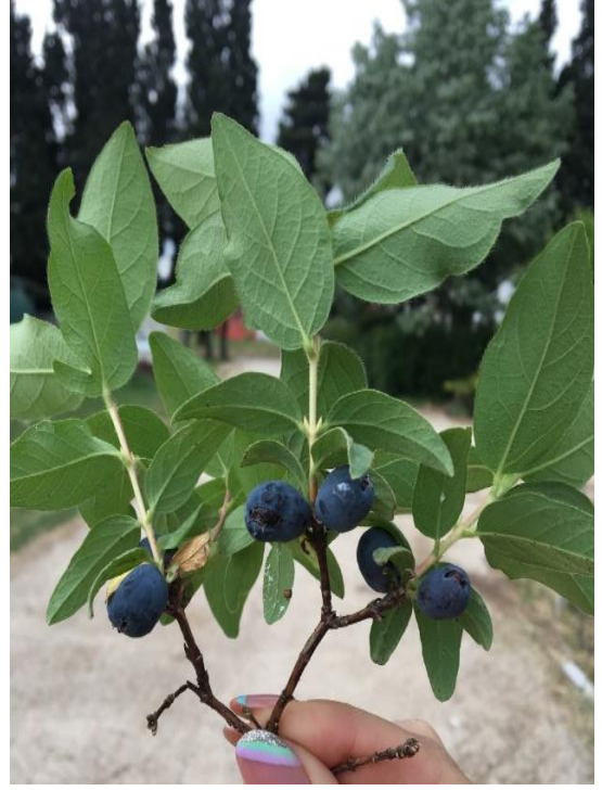
Şekil 3.1.2. Bal yemişi meyvelerinin görünüşü