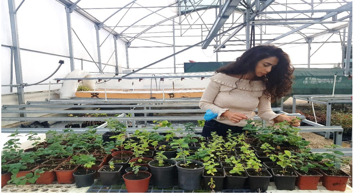
Şekil 4.1.4. Dış ortama alıştırılmış bitkilerin iki ay sonraki görünüşleri