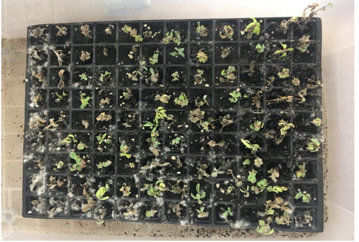
Şekil 4.1.3. B. velikan çeşidinde meydana gelen kontaminasyon