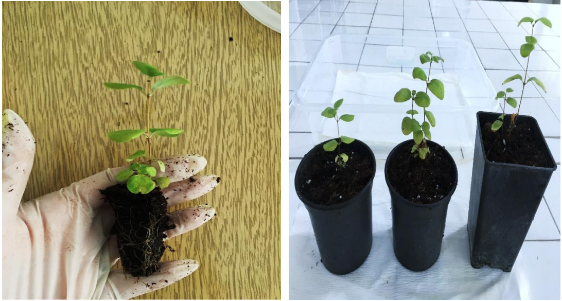
Şekil 3.2.6. Dış koşullara adaptasyonunu tamamlamış bal yemişi çeşitleri