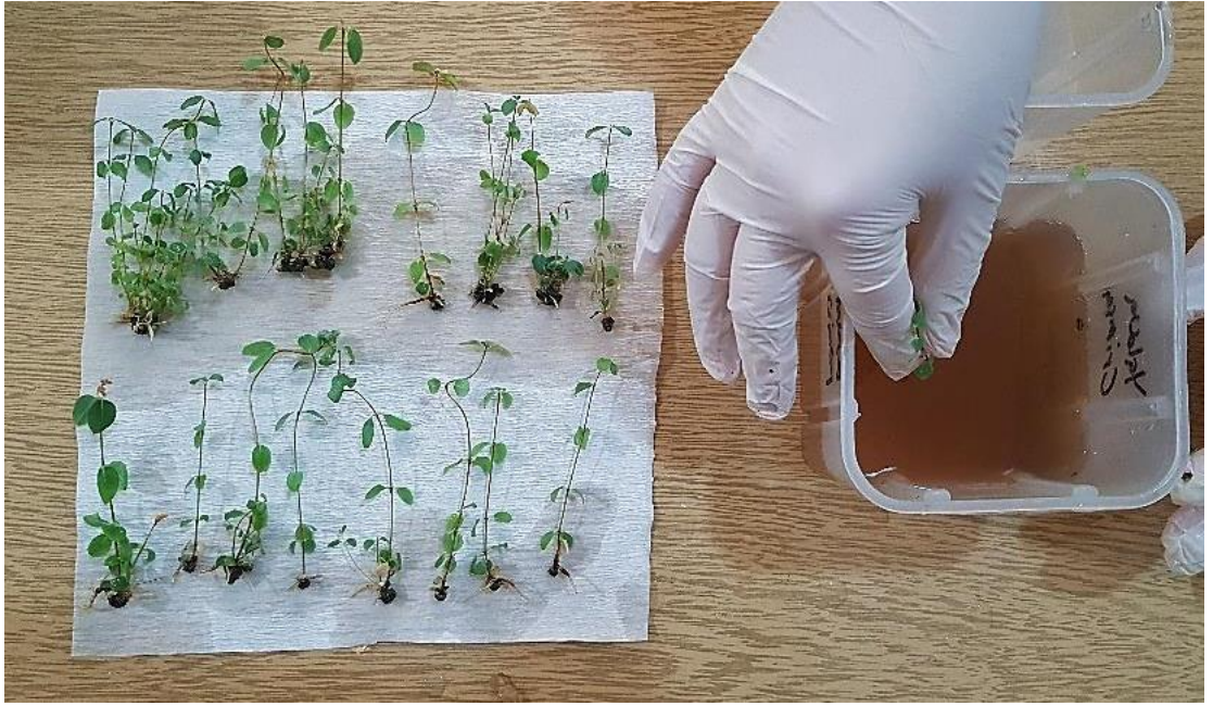
Şekil 3.2.4. Fungusit eriyiğine daldırılan köklenmiş bitkiler

(1:1) ile doldurulmuş 45'lik viyollere dikilmiştir. Dikimin hemen ardından viyoller nem kontrolünü sağlamak amacı ile 50 litrelik saklama kaplarının içerisine konulmuş ve kapağı kapatılmış ardından 25 \pm 1 °C sıcaklıktaki 16 saat aydınlık 8 saat karanlık faza ve ışık şiddetine sahip yetiştirme odasına yerleştirilmişlerdir. İçerisinde bitkicik bulunan saklama kaplarının kapakları 2 hafta süre ile kapalı tutulmuş nem durumu kontrol edilerek aralıklı olarak el spreyi ile su püskürtülmüştür. 2 haftanın sonunda kapaklar kademeli olarak açılarak bitkilerin dış koşullara adaptasyonu sağlanmıştır. Serada rutin bakım işlemlerine devam edilmiştir.