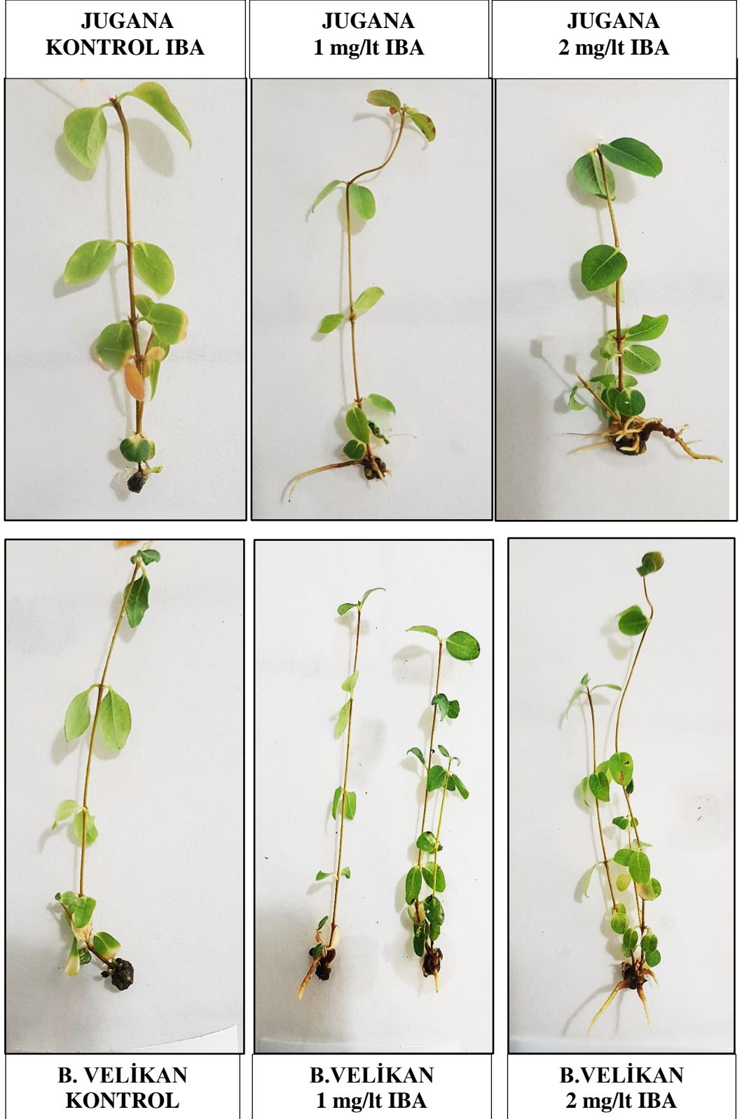
Şekil 4.1.2. Farklı IBA konsantrasyonlarında kültüre alınan bal yemişi çeşitlerinin haftalık gelişme periyodu sonundaki genel görünüşleri