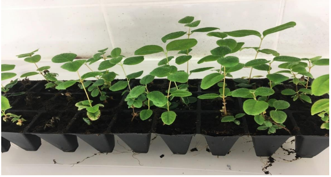
Şekil 3.2.5. Viyollere dikilmiş bitkiler