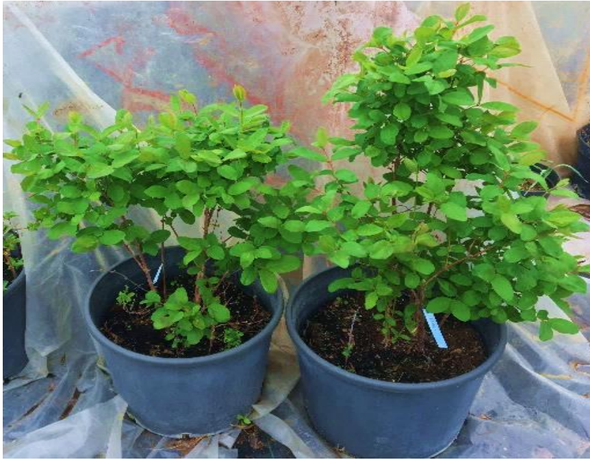
řekil 3.1.1. Jugana ve B.velikan eřidine ait bitkilerden bir görùntù

Bal yemiřinde ( Lonicera caerulea var. kamtschatica .) in vitro olarak gerekleřtirilen denemeler bařlangı, sùrgùn oğaltımı ve köklendirme olmak üzere 3 ařamada gerekleřtirilmiřtir.