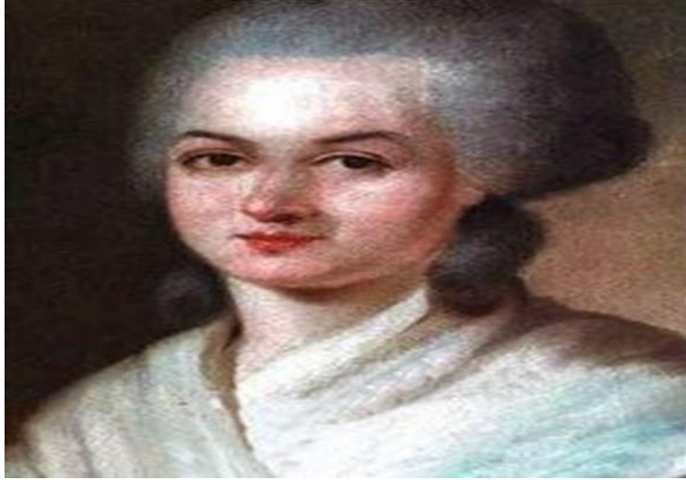
Resim 3.9. Olympe de Gouges

mücadelede bulunmuştur. “Kadının ve Kadın Yurttaşın Hakları Bildirisi” adlı eserinde kadın-erkek eşitliğini savunmuştur. Olympe de Gouges, meclisin çıkarmış olduğu “Erkek ve Yurttaş Hakları Bildirgesi” yanıt olarak 1791 yılında “Kadın ve Yurttaş Hakları Bildirgesi Metninin” yayımlanmasına öncülük yapmış lider kadınlardan biridir.