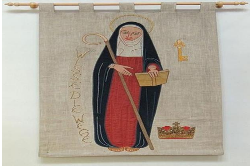
Resim 3.1. Bingenli Hildegard

verebildiğini göstermiştir (“Bilgelik Yolculuğunda Kadın Filozoflar”, https://www.slideshare.net/Basak72/kadin-filozoflar-09032013 (Erişim: 12.04.2017)).