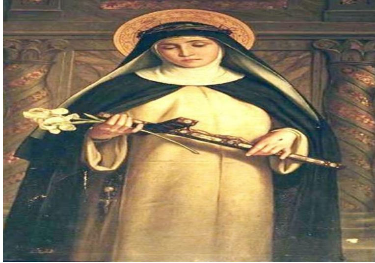
Resim 3.2. Siena'lı Katerina