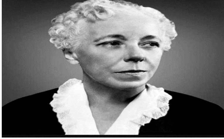
Resim 3.13 Karen Horney

1950 yılında yayımlanmış olduđu “Nevrozlar ve İnsan Gelişimi” isimli yapıtında kendi dünya görüşüne ve savunduđu tezlere detaylıca değinmiş, iki yıl sonra da yakalanmış olduđu kanser hastalığını yenememiş ve yaşamını yitirmiştir.