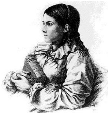
Resim 3.10. Bettina Von Arnim

Bettina von Arnim diğer adı ile Arnim Kontesi 1785 yılında Almanya’da doğdu. Bettina von Arnim nin birçok özelliği bulunmaktaydı bunlardan bazıları; bir yazar olması, beste yapması, aynı zamanda şarkı söyleyip görsel sanatlarla da uğraşmasıydı.