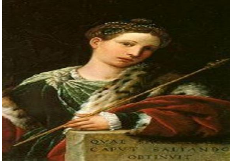
Resim 3.5. Tullia D'aragona

Tullia, 30 yaşına geldiğinde Venedik'e taşınmış ve burada şair Bernardo Tasso ile arkadaşlık etmiştir. Tullia d'Aragona, "Aşkın Sonsuzluğu Hakkında Diyaloglar" adlı yapıtını 1547 yılında yazmıştır. Neo-Platoncu bir kadının cinsel ve duygusal özerk iddiası olarak başlangıçta İtalya'nın Venedik kentinde yayınlanan bu roman, Rinaldina Russell ve Bruce Merry tarafından 1997'de İngilizce olarak tercüme edilmiştir. Bu felsefe kitabı, türünün ilk örneğidir.