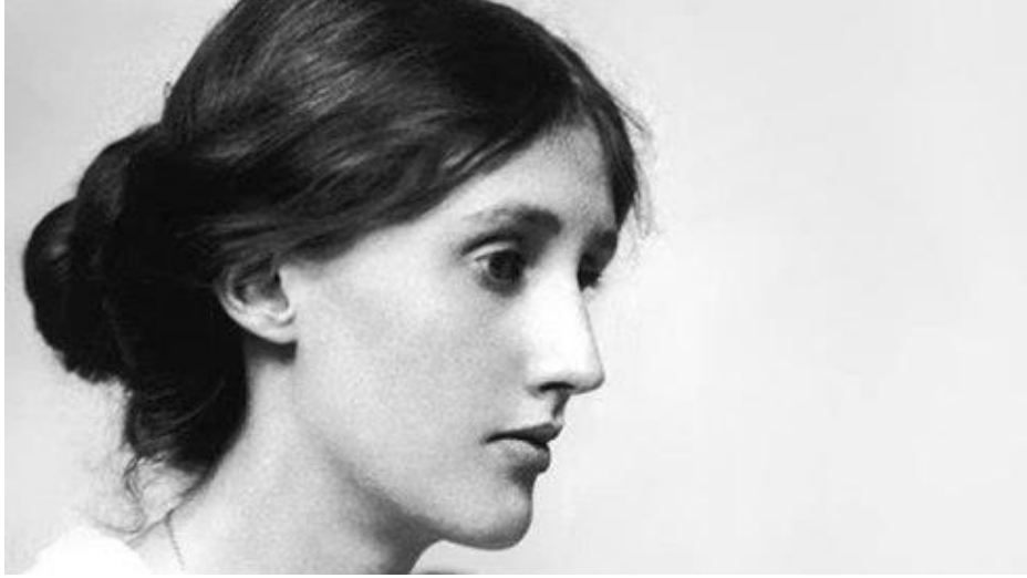
Resim 3.14. Virginia Woolf.

Kadın kocasının mülkiyeti sayılıyordu ve kadının kazandığı parayı dilediği gibi kendine harcama yetisi yoktu ve yasalar da buna izin vermiyordu. Kadının kazandığı her kuruş elinden alınıyordu ve kocası nasıl isterse öyle harcanırdı. Bu yüzden de kadınlar çalışmak, para kazanmak, ekonomik özgürlüklerini kazanmak istemiyorlardı. Çünkü erkekler kadınların parasını istediği gibi yönetiyordu. Bu yüzden de kadın para kazanmak ya da çalışmakla uğraşmak istemiyordu.