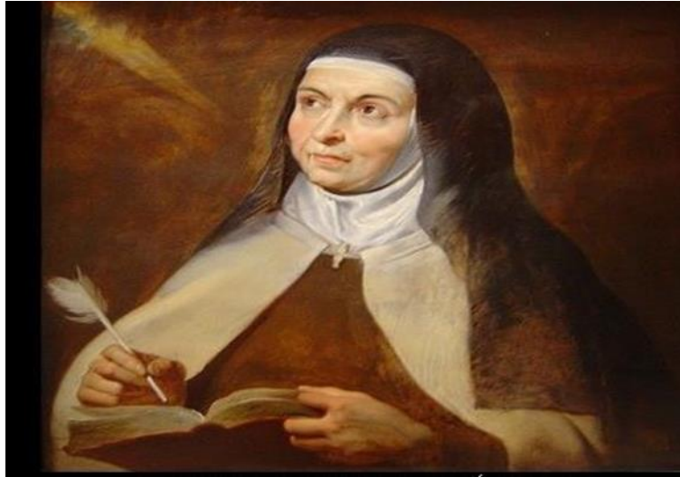
Resim 3.6. Teresa Von Avila