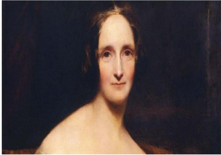
Resim 3.8. Mary Wollstonecraft

geliştirme fırsatı yakalamıştır. Ancak yapmış olduğu bu işi kendisine çokta uygun bir iş olarak görmüyordu. Bu süreçte ailesel sorunlardan yine kurtulamamış bu defa da kız kardeşi Eliza'nın iyi gitmeyen evliliğini sonlandırmasında görev alarak çok sayıda tenkite uğramıştır. Bunun için ise “Biliyorum, ben bir kadının eşini terk etmesine çirkin bir şekilde sebep oldum” diyor. Ancak esasında kadınların yoksulluk içerisinde yaşamamak için eşlerinin yanından ayrılamadıkları bir zamanda, kendisi kadınların planlı ve düzenli bir eğitim almalarını ve bir meslek sahibi olmalarının çok önemli olduğu kanaatindeydi. Öyle ki bu fikirlerini 1787 yılında yayımlamış olduğu Thoughts on the Education of Daughters isimli eserinde de ifade etmiştir.