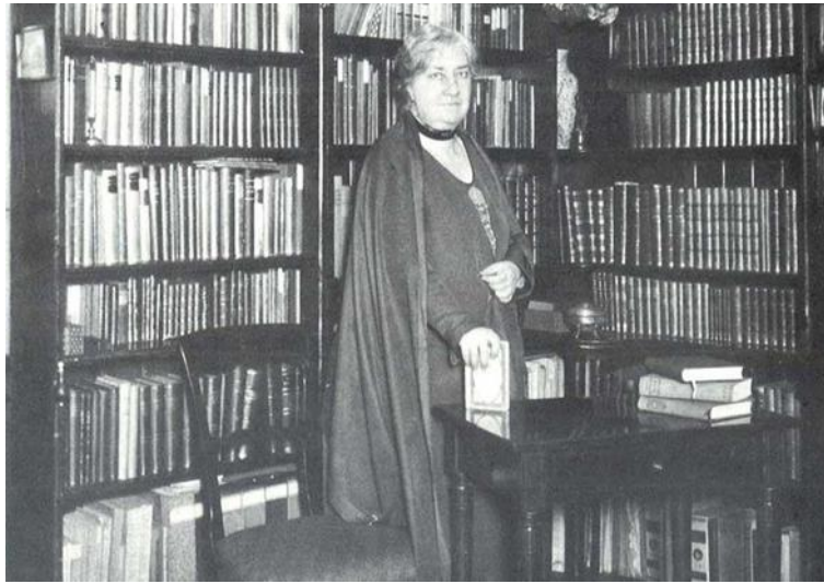
Resim 3.12. Rosa Mayreder

Viyana’da dünyaya gelen Rosa Mayreder, toplamada oniki çocuğa sahip orta düzeyli bir ailenin kızıdır. Mayreder erkek kardeşleri gibi etkin bir okul eğitimi alamamış olmasına karşın, yinde babası onun piyano, resim, Fransızca, latince ve yunanca dersleri almasına imkan tanımıştır.