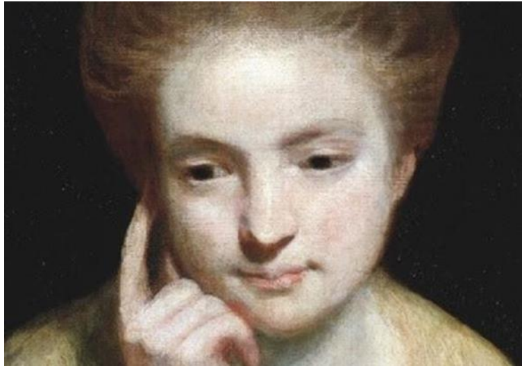
Resim 3.7. Mary Astell