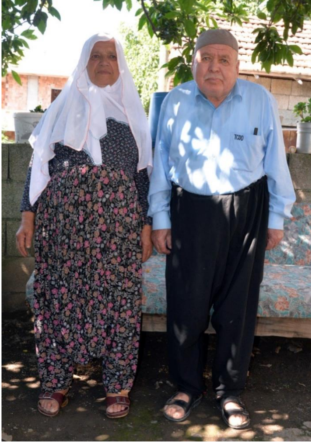
Foto 6. Kuyuluk Köyü'nde geleneksel kadın ve erkek kıyafeti