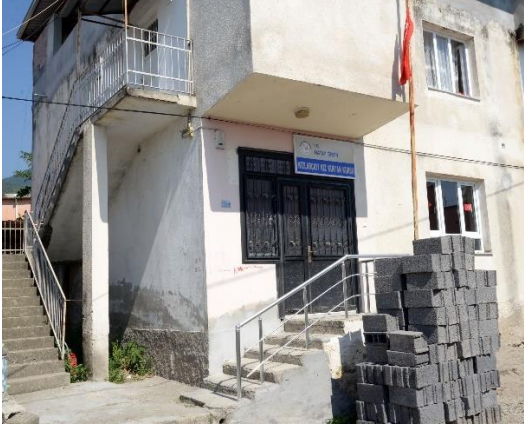
Foto 3. Kırlarçayı Kur'an Kursu

çocuklarına yönelik olarak Erzin Müftülüğü Gençlik Koordinatörlüğü tarafından sohbet, spor, iftar programı gibi faaliyetler yapılmaktadır.