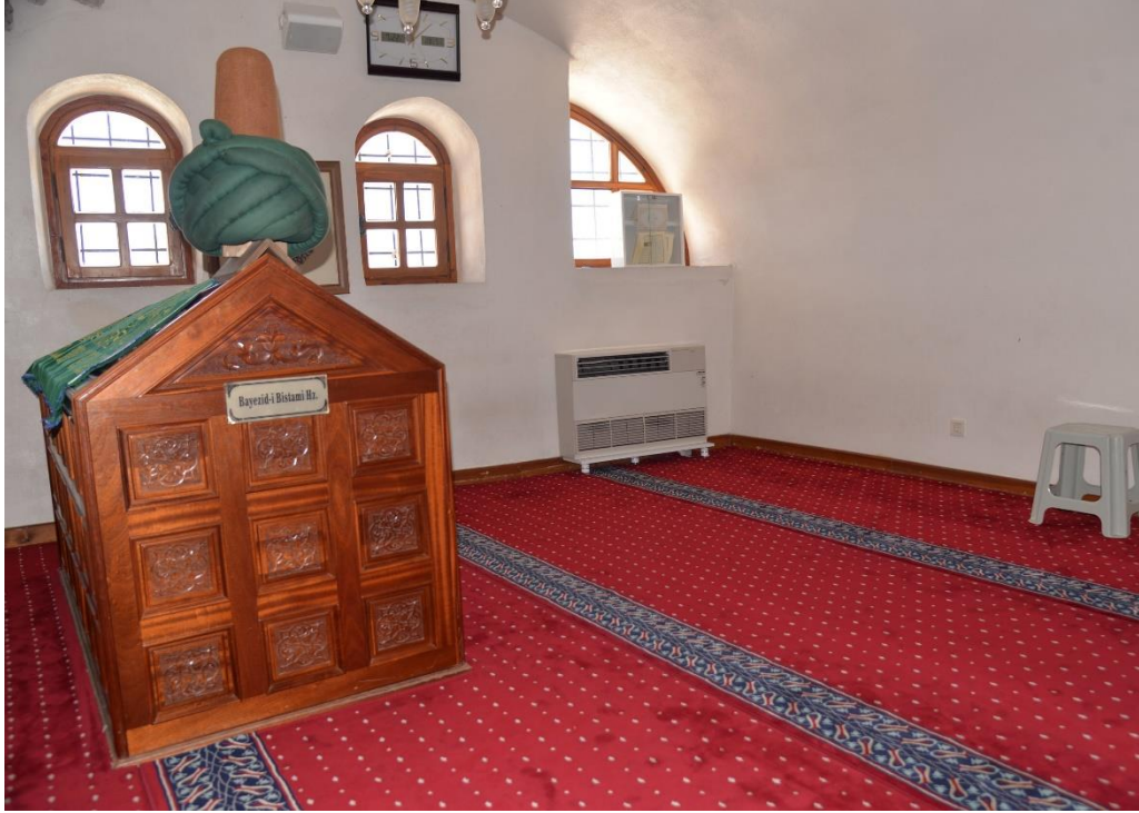
Foto 11. Beyazıd-i Bestami Türbesi

Türbede pazartesi, perşembe günleri ve kandil gecelerinde zikirler düzenlenir. Ayrıca özel zamanlar dışında da sıklıkla ziyaret edilmektedir. Ziyaretlerde Kur'an okunur, dualar yapılır. Mevlit okunur, tespihler çekilir ve hatim indirilir.