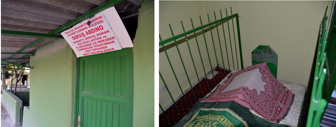
Foto 7-8: Şeyh Abdino Türbesi'nin Girişi ve Şeyh Abdino'nun sandukası

Bu zatın Erzin halkından beklediğı yardımı göremediğı için yöre halkına beddua ettiğı, bundan dolayı manevi faydası ve bereketinden ilçenin mahrum olduğu halk arasında anlatılmaktadır. İlçe'nin dini, sosyal, ekonomik yönden yeterince gelişememe sebebinin bu zata yapılan haksızlık olduğuna inanılmaktadır.