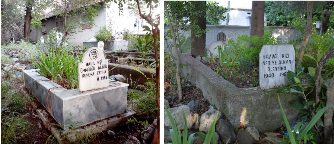
Foto 13-14: Kızlarçayı Köyü'nde köstebek hastalığına şifa veren ocak (solda) ile siğil ve kızilyörük hastalıklarına şifa veren ocak mezarı (sağda)

bilgilerin verildiğine, doktordan ileri düzeyde bir bilgiye sahip olduklarına inanılır. 79 Kızlarçayı ve Kuyuluk köylerindeki muhacirler sarılık, köstebek gibi hastalıklara okuyan ocakların varlığından bahsetmektedir. Bu kişilerin hayattayken “Ben öldükten sonra şifası için okuduğum hastalık kimde çıkarsa o kişiye benim kabrimin toprağından sürün, getirin kabrimin yanına yatırın. Böylece o hasta şifa bulur,” dediği anlatılmıştır. Yapılan araştırmalarda köy kabristanında ocak kabul edilen kişilerin kabirlerine rastlanmıştır. Örneğin sarılık hastalığına yakalanan bir kişi sarılığın ocağı olarak kabul edilen kişinin kabrine gider, dua edip kabir toprağından kendisine sürerse sarılık hastalığının geçeceğine inanılır. Halen daha vefat eden şifacıların kabirleri o kişilerin hayattayken okudukları hastalık türüne göre ziyaret edilip toprağı hasta bölgelere sürülmesi inancı kuvvetli şekilde devam etmektedir.