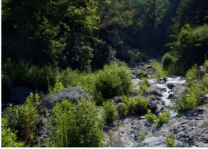
Foto 10. Kuyuluk Köyü civarında ziyaret edilen dere

Muhacirlerin “ziyaret” adını verdikleri yatırlar birkaç farklı yerde bulunmaktadır. Ziyaret denilen mekânların ortak noktası burada yattığı söylenen kişiler hakkında net bir bilgi olmamasıdır. Ayrıca bu mekânlarda tam bir mezar yeri tespit etmek mümkün değildir.