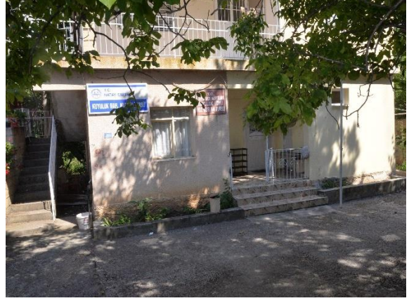
Foto 4. Kuyuluk Kur'an Kursu

Yaz döneminde hemen hemen her aile çocuğunu Kur'an kursuna göndermektedir. Yaz kursuna her yaşta çocuk katılmaktadır. Yapılan gözlemlerde ailelerin kursa çocuklarını gönderme konusunda ve çocukların yaz kursuna katılma konusunda son derece istekli oldukları tespit edilmiştir. Erzin'in sıcak ikliminden dolayı yaylalara rağbet oldukça fazladır. Yaylalara giden aileler buradaki camilere ve kurslara da çocuklarını yoğun olarak göndermektedir.