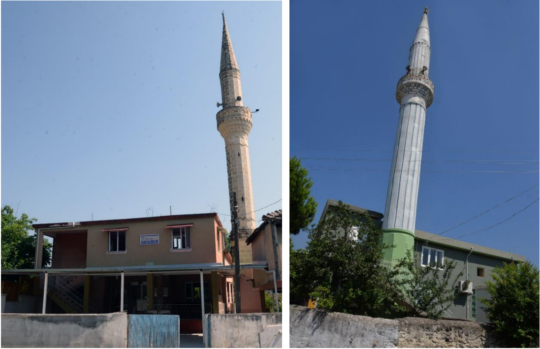
Foto 1. Kızlarçayı Köyü Merkez Camii Foto 2. Kuyuluk Köyü Camii

Kızlarçayı köyünde Diyanet'e bağlı resmi bir Kur'an Kursu ve iki cami bulunmaktadır. Kuyuluk köyünde ise Diyanet'in bir Kur'an Kursu ve camisi mevcuttur. 28 Muhacirler cami ve kurslara gitmekle beraber kendi dini gruplarının da etkinliklerine devam etmektedir. Özellikle Cuma günü, bayramlar ve Ramazan ayında camilere katılım artmaktadır. Dindar olduğunu söyleyenlerin çok az bir kısmı Diyanet'i dini konularda güvenilir bulmadığını söylediği için cemaatle namaza katılmamakta ve eşlerini kurslara göndermemektedir.