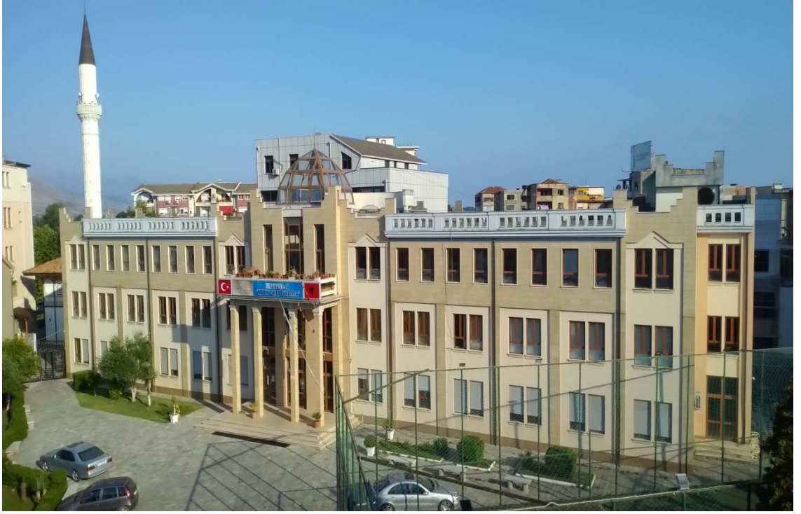
Resim 1: Iřkodra Medresesi ve Caminin Dıř Grnts