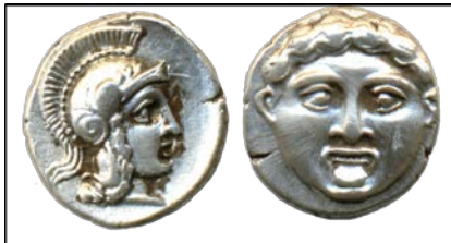
Selge-Psydia Gümüş, M.Ö. IV. Yüzyıl, 10 mm Ön Yüz: Korinth miğferli Athena başı, sağa Arka Yüz: Cepheden Gorgon başı

Bir grubun devamlılığı için temel nitelikler, lider, inançlar gibi konular ve bunların sembollerinin kullanılması da yeterli olmayabilir. Büyük grup belli temeller üzerinde oluşsa da içinde bunlara itiraz eden veya liderin nitelikleri ya da uygulamalarını beğenmeyen, kendi küçük grubunu daha değerli gören, başka grupların değerlerini daha yakın bulan kısaca büyük gruba çeşitli seviyelerde başkaldırmaya niyetlenenler olacaktır. Oysa grubun değerleri en iyisidir, bu grup o değerleri en layığı ile uygulayandır, lider adeta yarı Tanrıdır ve her şeyi bilir, ne yaparsa iyi yapar. Buna rağmen itiraz edenler varsa onlar olsa olsa gafil veya haindirler. Zaten başka gruplar bu grubun parçalanması, yok olması veya kendisine katılması için ellerinden gelen her şeyi yapmaktadırlar. Bu durumda grubun siyasi otoritesinin içte ve dışta rızaya yönelik hikmet dağıtmanın ötesinde cezaya yönelik sembollerinin de olması gerekir. Bunun güzel örneklerinden birisi şekil-21'deki sikkede görülmektedir.