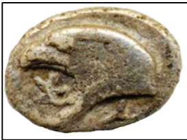
Kyme-Aiolis Gümüş, Helenistik dönem, M.Ö. 450, 8 mm Ön Yüz: KY, Kartal başı, sola

Şekil-17'deki sikkenin ön yüzünde yer alan aslan figürü Ionia'nın Miletos kentine aittir ve bu kent devletine aidiyeti tanımlar. Burada, daha önce açıklanan şekil-1' deki sikkenin ön yüzündeki Sart aslanının burnunun üzerinde bulunan yıldız yoktur ama arka yüzde yıldız betimlenmiştir.