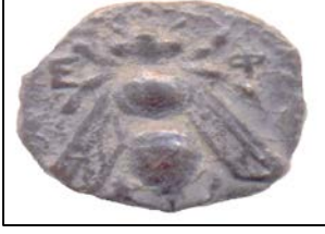
Ephesos, Bronz, M.Ö. 3. yy, 14 mm. Ön yüz : Arı