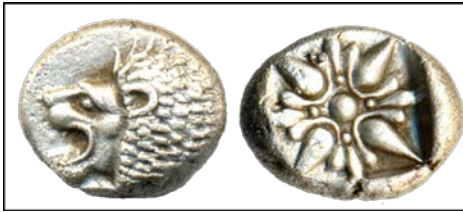
Miletos-Ionia Gümüş, Arkaik dönem, M.Ö. VII.-VI. Yüzyıl, 10 mm Ön Yüz: Aslan başı, sola Arka Yüz: Yıldız, sola

Bu yüzden, benzer sembollerin birden fazla grup tarafından kullanılması sık karşılaşılan bir durumken, gruplar farklılıklarını vurgulama ihtiyacı nedeniyle sembollerin görüntüsünde veya eklenen başka sembollerle birleşimlerinde değişiklikler yapmışlardır. Bu noktada küçük farklılıklar fazlasıyla önem kazanır. Simgelerde bilinçdışı vurgulanan bu farklılıklar, bireylerin ve böylece toplumların kendilerini kendi zihinsel imgelerinde yarattıkları "öteki" lerle karşılaştırmasına ve daha dar anlamdaki "bizlik" kavramının güçlenmesine katkı sağlayarak küçük grup kaynaşmasına hizmet ederler.