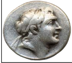
Cappadocia Krallığı, Gümüş, M.Ö. 101-87, 17,5 mm.

Kapadokya sikkelerinin ön yüzünde o dönemin kralının portresi bulunur (Şekil-3, 23-25). M.Ö. 101 ile M.Ö. 36 yılları arasında hüküm sürmüş olan bu 4 Cappadocia (Kapadokya) kralının sikkelerinin arka yüzleri birbirinin aynısıdır ön yüzleri ise değişir (Şekil 22) (47).