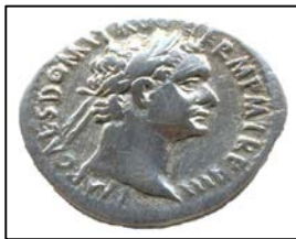
Domitianus, Gümüş, M.S. 88-89 17,5 mm.

Liderlerin başardıklarının Roma sikkelerinde vurgulanması da onların yenilmezlikleri ve dolayısıyla onlara sadakatin önemini vurgulama açısından önemlidir. Örneğin şekil-13'teki sikkede İmparatorun o dönem için çok önemli olan fetihleri konusunda kısaltmalar yer almaktadır.