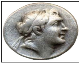
Cappadocia Krallığı, Gümüş, M.Ö. 101-87, 17,5 mm.

Ön yüz: Kralın Diademli başı, sağa (Ariarathes IX, Eusebes Philopator)