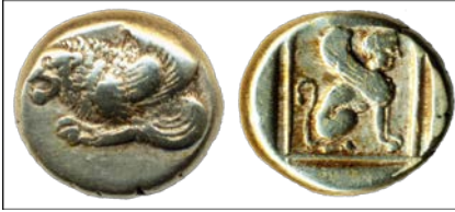
Mytilene-Lesbos Elektron, M.Ö. 412-378, 11 mm Ön Yüz: Kanatlı aslan protomu, sola Arka yüz: Kare incus içinde sphenks, sağa