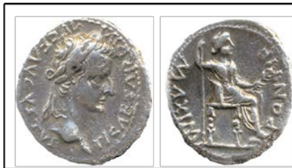
Tiberius, Gümüş, M.S. 14-37, ... mm

Yazının kullanıldığı dönemlerde sikkeler üzerindeki portre ve büstler veya lideri simgeleyen diğer sembollerin ötesine geçilmiş ve liderin kaçınılmaz olarak narsisizme varan veya vardırılan özellikleri yazılar ile de belirtilmiştir. Bu konuda Roma sikkeleri en güzel örnekler arasında yer alır. Bu sikkeler üzerindeki yazılarda da lider inanç ilişkileri ile ilgili birçok ize rastlamak mümkündür.