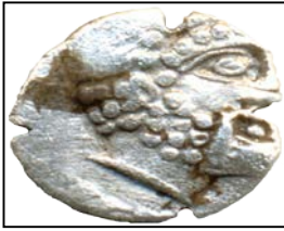
Phoenicia (Fenike), Gümüş, M.Ö. 4. yy, 9 mm.

Toplumların oluşma ve devamlılığına hizmet eden ‘tavan faktörü’ ise genel olarak topluluğun belli bir lider etrafında birleşme sonucu oluşması ve lidere ve/veya liderin sonraki nesillerine bağlılıkla devam etmesi anlamına gelir (32). Bu faktöre işaret etmek üzere imparatoru simgeleyen semboller veya imparator veya kralın kendisinin büst yada portrelerinin sikkeler üzerine işlenmesi sık karşılaşılan bir durumdur. Politik psikoloji açısından bu tür simgelerin özelliği toplumun bir liderin etrafında toplanmış insanlara dayalı ‘tavan faktörü’ çerçevesinde oluşup, onun kendisi veya simgesiyle temsil edildiğini göstermesi olabilir. Bir liderin etrafında toplanarak oluşmuş ve kendisini onunla özdeşleştirmiş olan büyük grup, birçok küçük grubun gönüllü veya zorla katılmasıyla genişlemiş olsa bile kendini kralın kendisi veya simgesiyle tanımlar (Şekil-9 ve 3). Bu tanımlama yaklaşımı Freud’un büyük grubun üyelerinin liderlerini idealize etmeleri, onunla ve birbirleri ile özdeşim kurarak liderin etrafında toplanmaları yönündeki tespiti ile açıkça uyumludur (29).