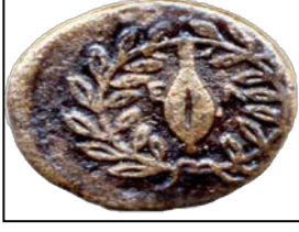
Elaiio, Bronz, Helenistik Dönem, 11 mm.