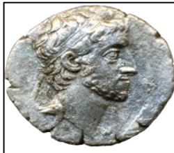
Ariarattes X, M.Ö. 42-36