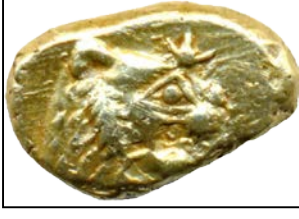
Lidya (Sardes), Elektron, Arkaik Dönem, 13 mm. Ön yüz: Aslan başı, sağa, üstte yıldız