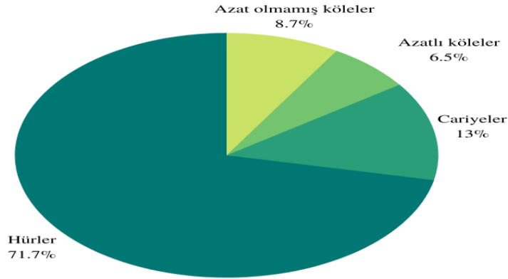
Şekil 3: İlk Müslümanların içinde kölelerin oranı

Köle ve mevâlî (azatlı) arasında haklar bakımından bazı farklılıklar bulunmuştur. Mevâlî, sosyal statü açısından toplumun orta sınıfını temsil etmektedir. 197 Onlar köleler gibi alınıp satılamamıştır. Ancak evlilik ve miras konularında da toplumun asıl temsilcileri gibi de muamele görmemişlerdir. Örneğin onların hiçbiri hür bir kadınla evlenememiştir. Ayrıca onların diyeti hür kimsenin diyetinin yarısı kadardır. 198