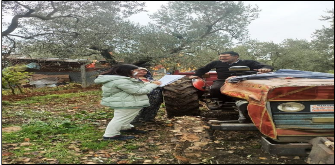
Şekil 3. 1. Zeytin üreticileriyle yapılan anket çalışmaları (2021)

Şekil 3.1’de zeytin üreticileriyle yapılan anket çalışmaları görülmektedir.