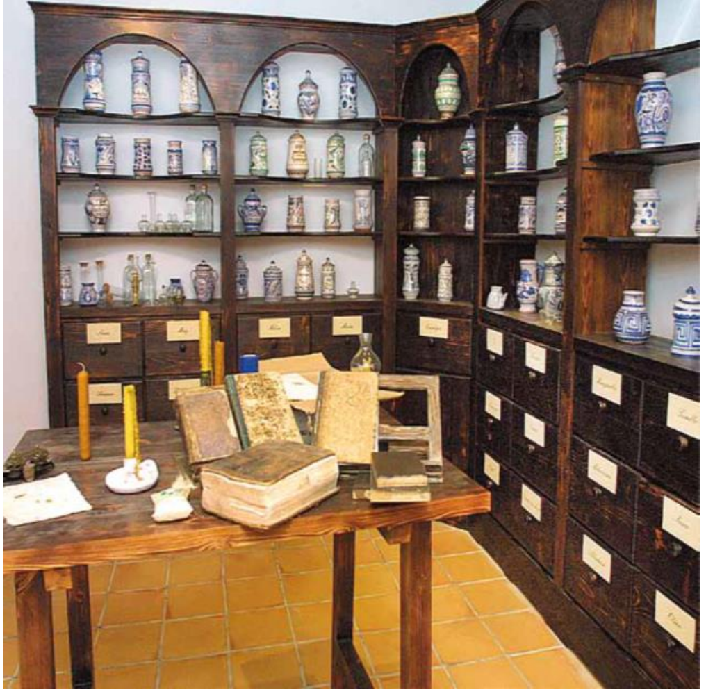
Şekil 6 Servetus'un evinin ikinci katında bulunan, yaşadığı zamanın tipik eski bir eczacı rekreasyonunu yansıtan bir fotoğraf. (Mikel Iturbe Mach (ed.), Miguel Servet: Los valores de un Hereje (Zaragoza: Heraldo de Aragon, 2013, s. 75.)