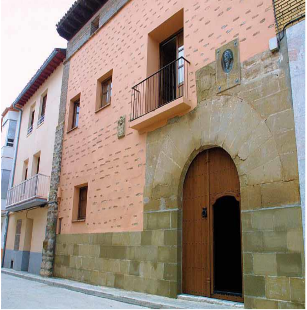
Şekil 1 Servetus'un içinde doğduğu kabul edilen ev. Servetus arařtırmaları için faaliyet gösteren "Instituto de Estudios Sijenenses" isimli kuruluş tarafından bir ev müzesine dönüřtürülmüřtür. (Mikel Iturbe Mach (ed.), Miguel Servet: Los valores de un Hereje (Zaragoza: Heraldo de Aragon, 2013, s. 73.)