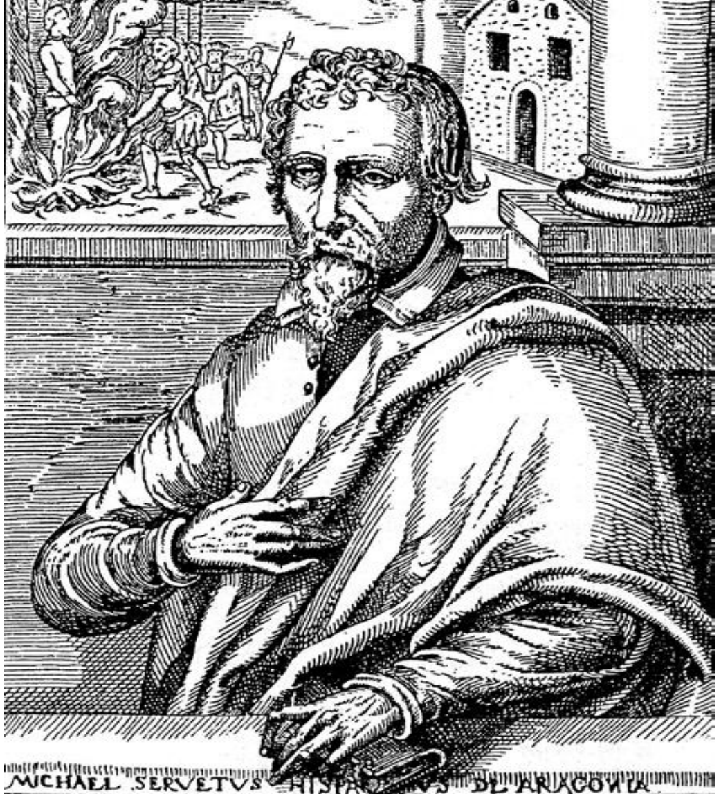
Şekil 2 Cristóbal Siche tarafından yapılan 'Genç adam' (Servetus) gravürü, Ulusal Kütüphane, 1607, Paris. (Mikel Iturbe Mach (ed.), Miguel Servet: Los valores de un Hereje (Zaragoza: Heraldo de Aragon, 2013, s. 9.)