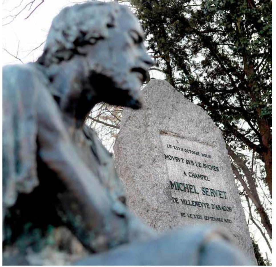
Şekil 5 Servetus'un vefatının 350. Yılında Cenevre'de onun hatırasına 1903'te yapılan ve öldüğü günle aynı anda açılmış bir kitabe. Edipresse, Cenevre. (Mikel Iturbe Mach (ed.), Miguel Servet: Los valores de un Hereje (Zaragoza: Heraldo de Aragon, 2013, s. 40.)