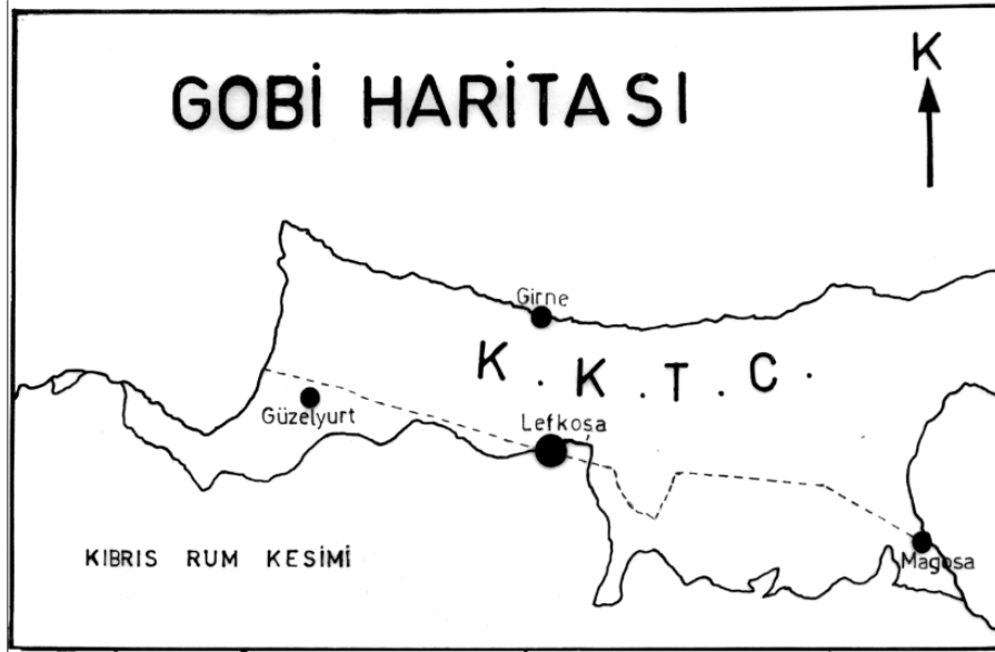
Harita 5: Gobi Haritası

bildirmiştir. Kıbrıs Özel Temsilcisi Gobi, taraflar arasında ortak konuların belirlenmesi ve anlaşmaya varılabilmesi amacıyla 16 Ekim 1981’de “Değerlendirmeler” başlığı altında birtakım öneriler hazırlayıp sunmuştur. Bu öneriler kapsamında, taraflara “Gobi Haritası” 135 veya “Gobi Hattı” 136 olarak adlandırılan bir harita sunulmuştur. Bu haritaya göre Kıbrıs’taki toprakların %62,5’i Rumlara, %27,5’i ise Türklere verilmiştir.