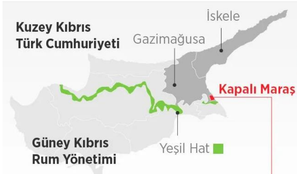
Harita 1: Kıbrıs Haritası

Kapalı Maraş, Kuzey Kıbrıs Türk Cumhuriyeti (KKTC)'nin Gazimağusa şehrinde yer alan etrafı dikenli tellerle çevrili bölgedir. Gazimağusa şehrinin sahil şeridinde yaklaşık 6 km 2 'lik bir alana sahip olan bölge, Ada'yı iki ayıran Yeşil Hat'tın üzerinde bulunmaktadır. Kapalı Maraş, İkinci Kıbrıs Barış Harekâtı sırasında Türk Silahlı Kuvvetleri (TSK) tarafından kontrol altına alınmış ve yerleşime kapatılmıştır. Bölge esasında sadece “Maraş” olarak anılıyorken TSK denetimi altına girmesi ve yerleşime kapatılmasının ardından “ Kapalı Maraş ” 101 olarak anılmaya başlanmış ve dile bu şekilde yerleşmiştir. Kapalı Maraş bölgesinin önemi ve bölgeye dair uyumsuzluğun sebeplerinin anlaşılması için öncelikle bölgeye dair tarihsel arka planın incelenmesi gerekmektedir.