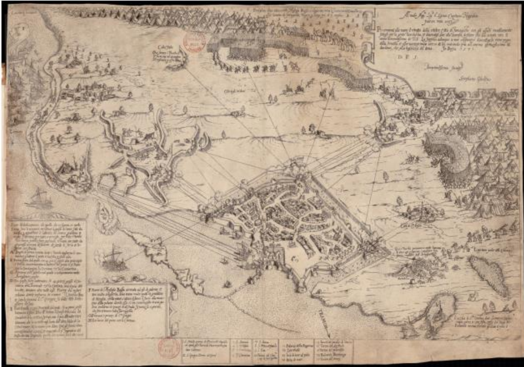
Harita 2: 1571 yılı Mağusa Kuşatması

Osmanlı Devleti'nin 1571 yılında Kıbrıs'ı fethetmesi ile 1489'dan beri adada süren Venedik hakimiyeti son bulmuştur. Mağusa kuşatması, Osmanlı Devleti'nin Kıbrıs'ı fethetmesinde önemli bir dönüm noktası olmuştur. 1570'te başkent Lefkoşa dahil birçok şehir Osmanlı Devleti'nin denetimine girmesine karşın, Mağusa şehri 11 ay süren zorlu bir kuşatmanın ardından alınabilmiştir. Kuşatmanın uzun sürmesinde şehrin oldukça güçlü dev surlarla çevrili olması etkili olmuştur. Mağusa kuşatması 102 öncesi Venedikliler su kaynaklarını arttırmak amacıyla tatlı su kuyuları ve sarnıçlar yapmışlardır. Surların dışında yer alan Maraş (Varosha) bölgesinde bulunan verimli kuyulardan özel kanallar açılarak şehre su taşınmıştır. 103 Kuşatma esnasında Lala Mustafa Paşa orduyu buraya yerleştirmiş ve böylelikle hem ordunun su ihtiyacını karşılamış hem de şehre giden suyu denetim altına almayı başarmıştır. Fethin ardından, Adanın savunmasında stratejik öneme sahip şehrin kalesi onarılmış ve surlar içine askerler yerleştirilmiştir. Bu durum surların dışında yeni bir yerleşim merkezinin oluşturulmasına zemin hazırlamıştır.