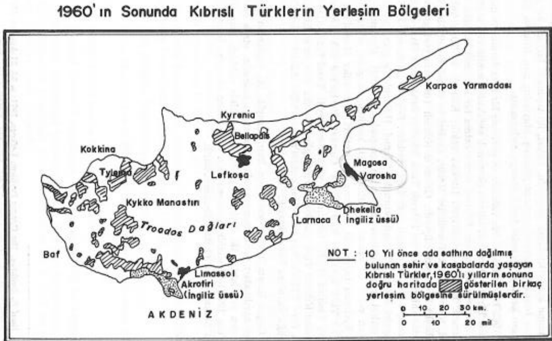
Harita 4: 1960'ın Sonunda Kıbrıslı Türklerin Yerleşim Bölgeleri

kaynaklı şehrin dışına neredeyse hiç gidemez olmuşlardır. 113 Bu durum iletişim, güvenlik ve gıda tedariki açısından önemli sorunlar yaratmıştır. Mağusa’da denizden ve karadan abluka altına alınan Kıbrıslı Türkler güvenlik sebebiyle surlar dışına açılan üç kapıyı geceleri tren rayları ile kapatmışlardır. Kıbrıslı Türkler, Rum ve Yunan askerlerinin Maraş’ın yüksek binalarına yerleştirdikleri ağır otomatik silahların hedefi olmuştur. 114 Surlar içi ve surlar dışında Türklerin yaşadığı Baykal, Sakarya ve Karakol semtlerinin güvenliği nöbet tutan mücahitler tarafından sağlanmıştır. Benzer şekilde 1963 sonrası dönemde Kıbrıslı Rumların surlar içine girişi yasaklanmıştır.