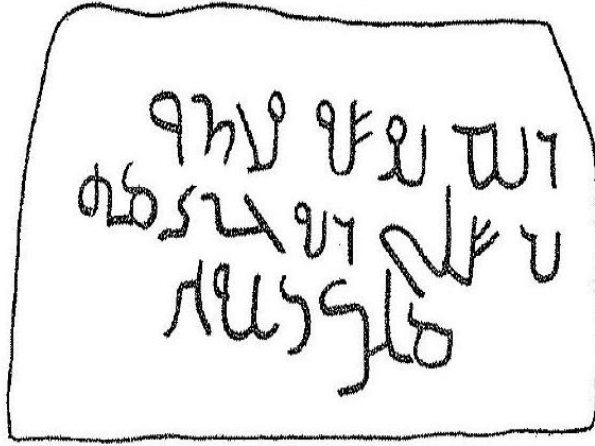
Şekil 5. Ümmü'l-Cimâl, III. y.y. M.S.