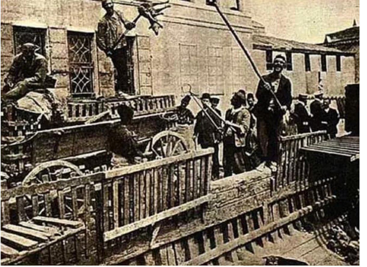
Foto 1. Köpeklerin Toplatılma Anı