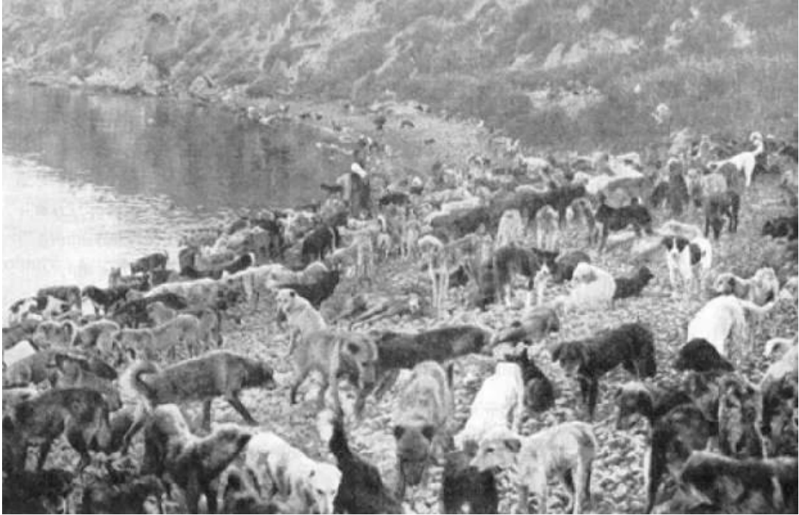
Foto 4. Köpekler Geldikten Sonra Hayırsız Ada