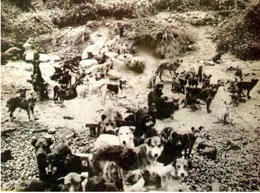
Foto 3. Hayırsız Ada'da Bulunan Köpekler