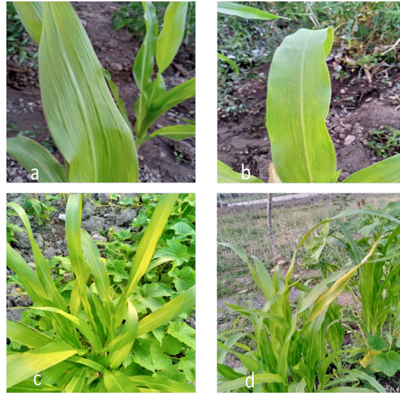
Şekil 1. Mısır bitkilerinin yapraklarında (a) şekil bozukluğu (b) şerit şeklinde çizgi ve mozaik (c) sararma ve bodurlaşma (d) şerit şeklinde çizgi ve sararma belirtileri