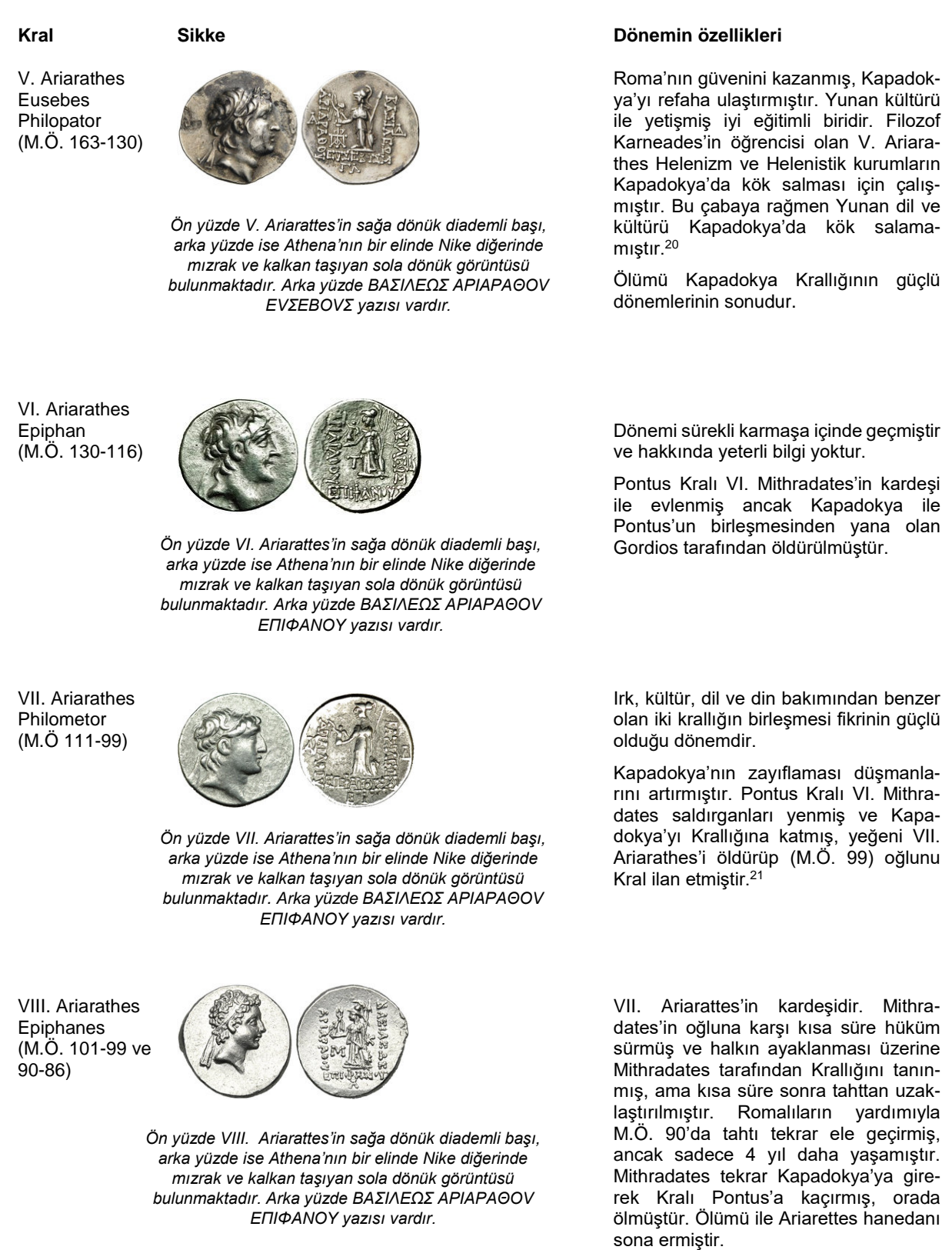
Tablo 3. V. Ariarattes (M.Ö. 163-130) - VIII. Ariarathes (M.Ö. 101-99 ve 90-86) Dönemi