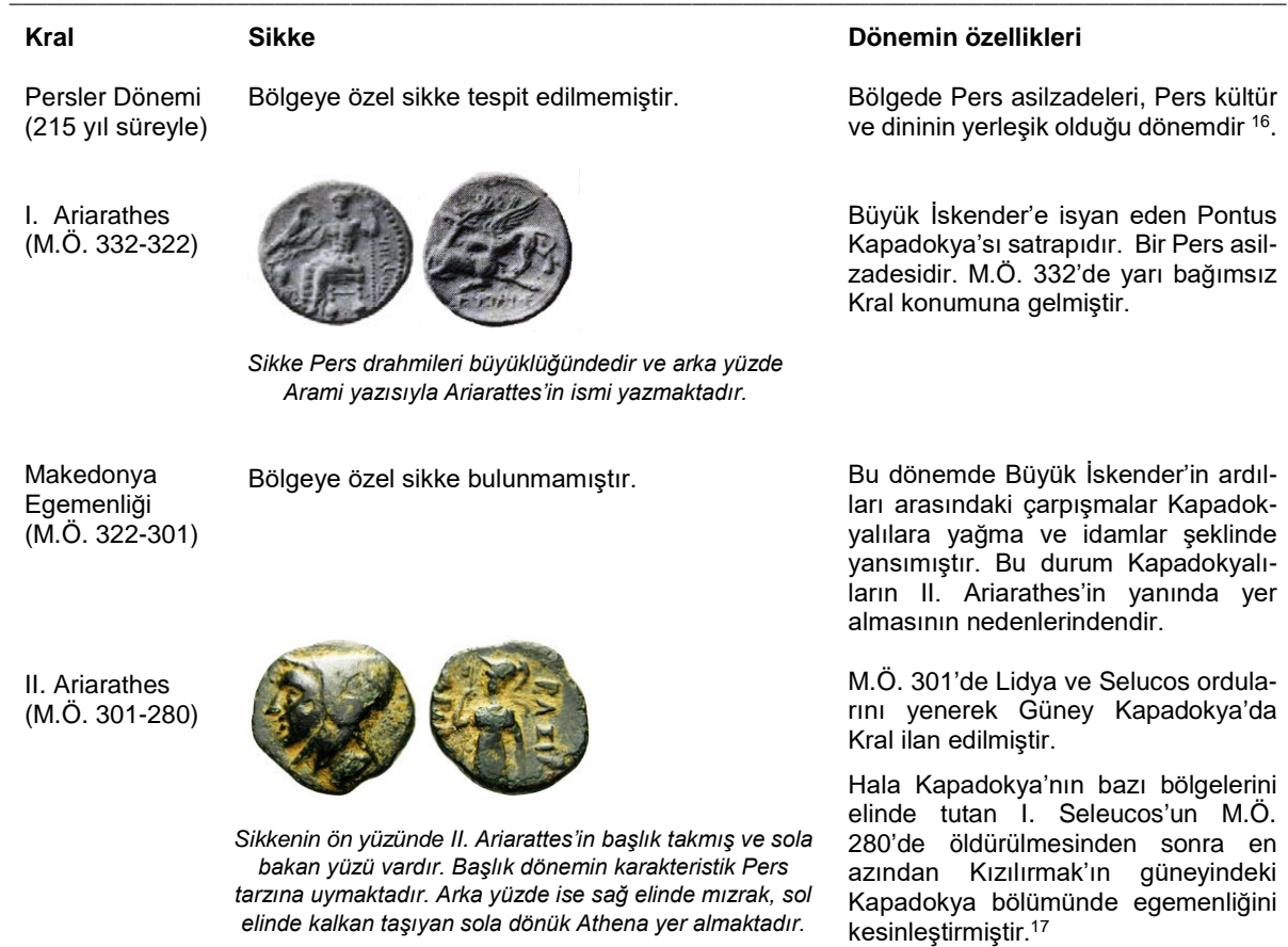
Tablo 1. Persler dönemi - Ariarathes II (M.Ö. 301-280) dönemi

Sikke Pers drahmileri büyüklüğündedir ve arka yüzde Arami yazısıyla Ariarathes'in ismi yazmaktadır.