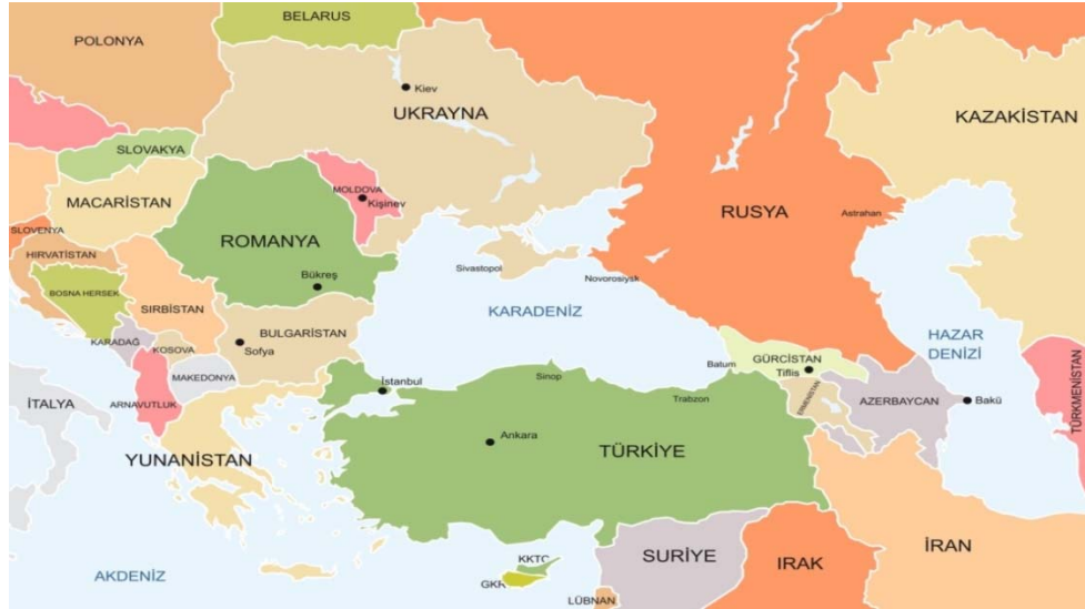
Harita 1: Karadeniz