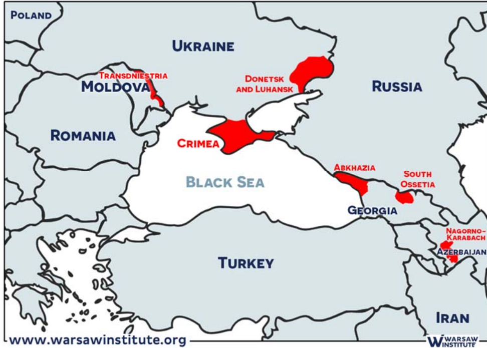
Harita 2: Karadeniz Havzasındaki Donmuş Çatışma Alanları