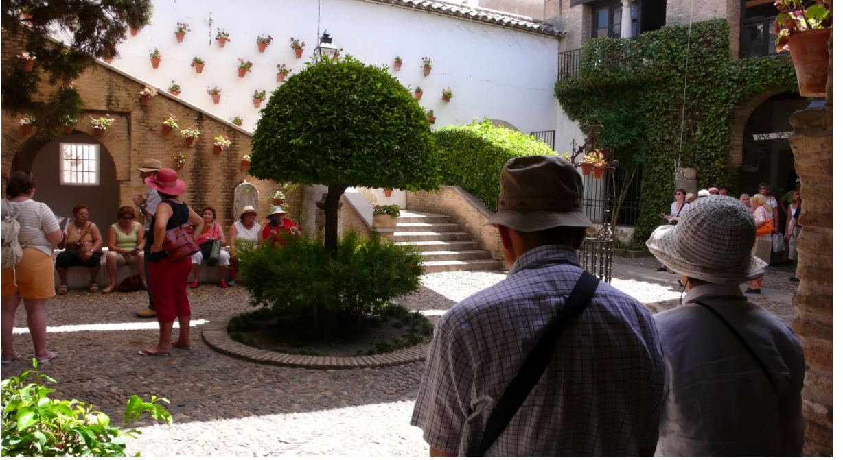
Resim 29: Kurtuba arşısı