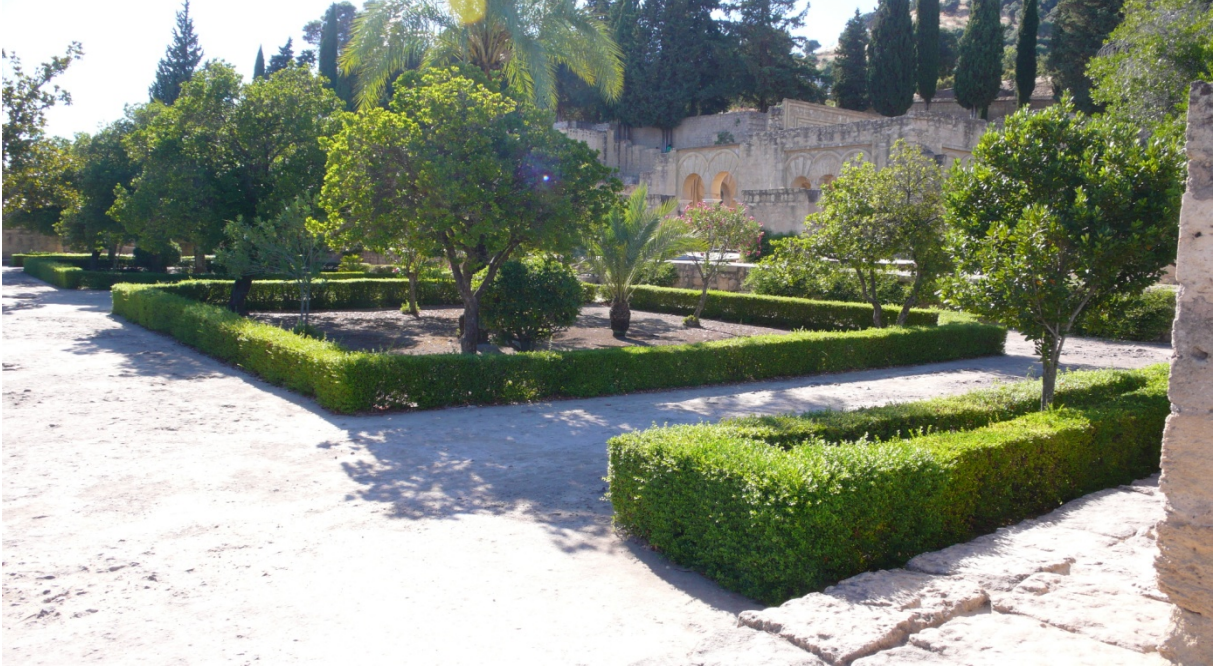
Resim 23: Zehrâ Sarayı bahçesi