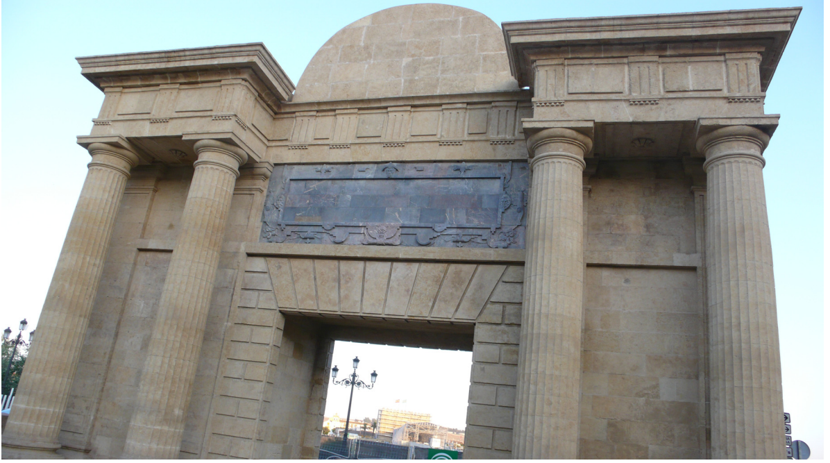
Resim 25: Kantara ve Nâûra