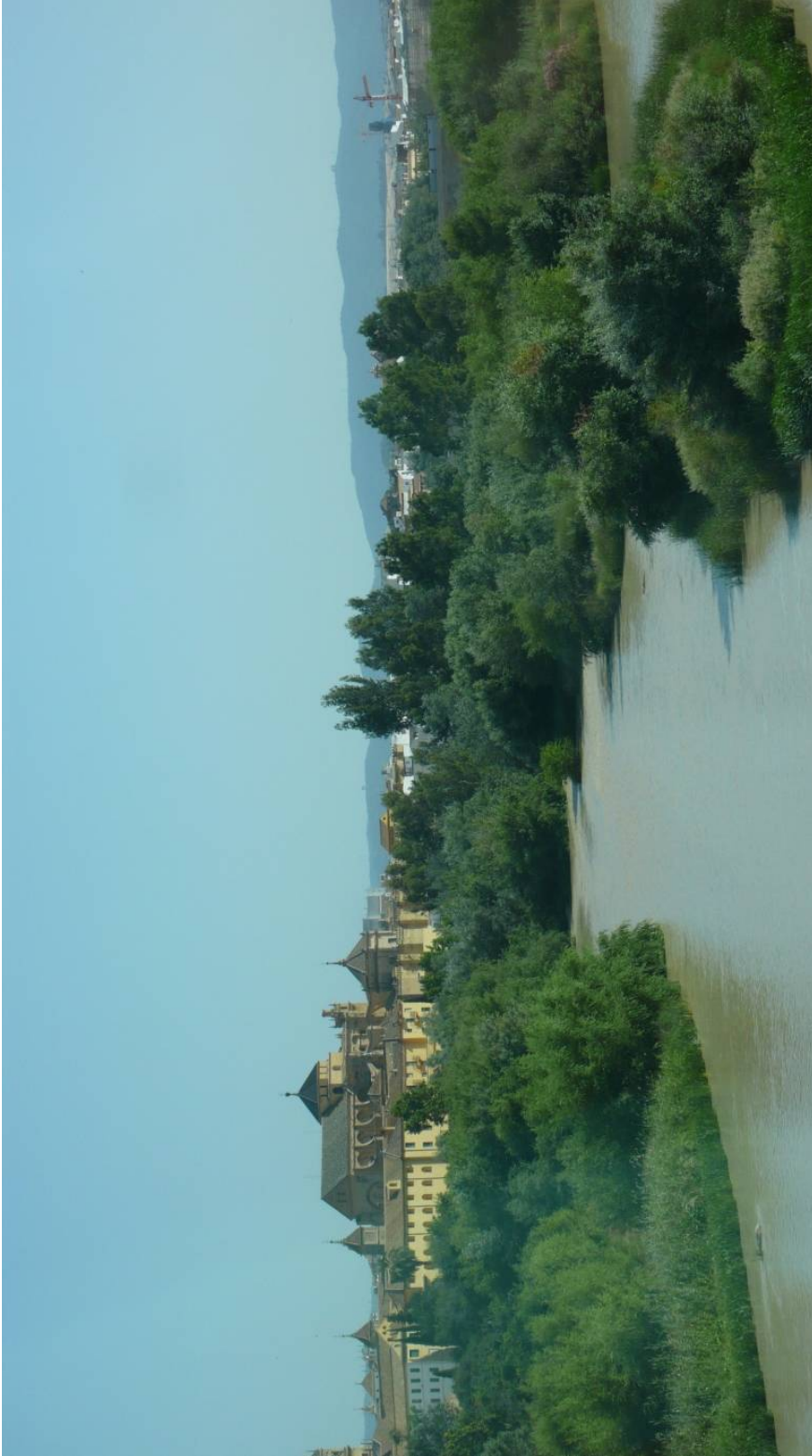
Resim 47. Kurtuba Nehri (Vádi-i Kebîr/Guadalquivir)