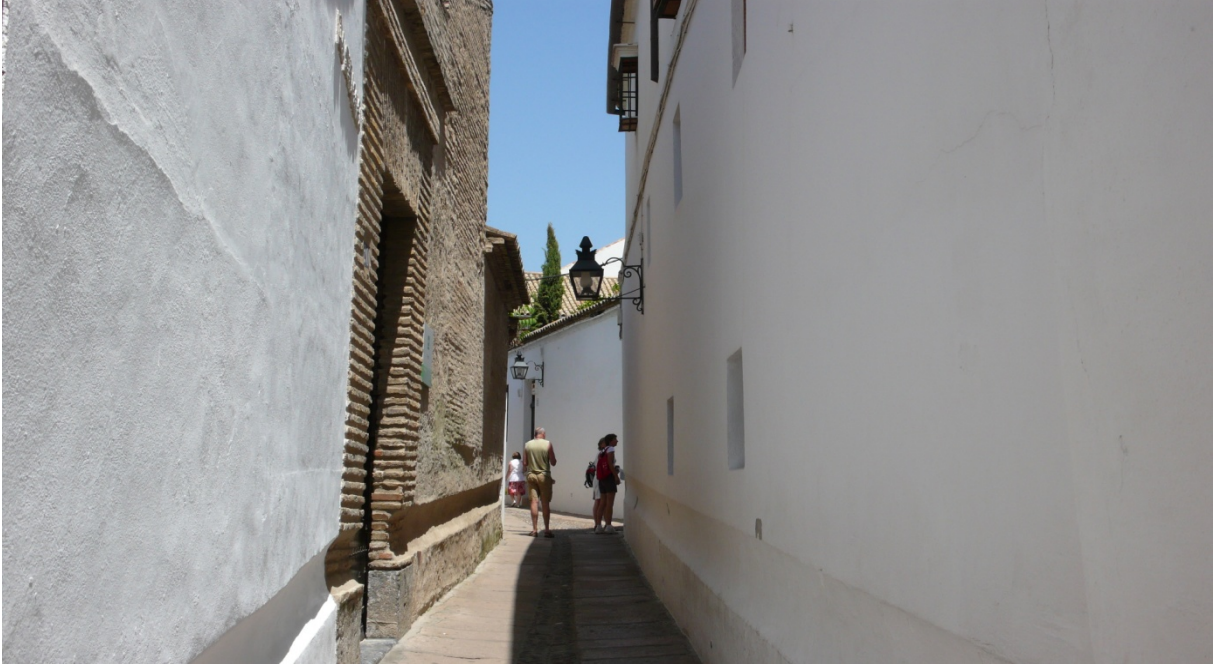
Resim 39: Şehrin sokakları