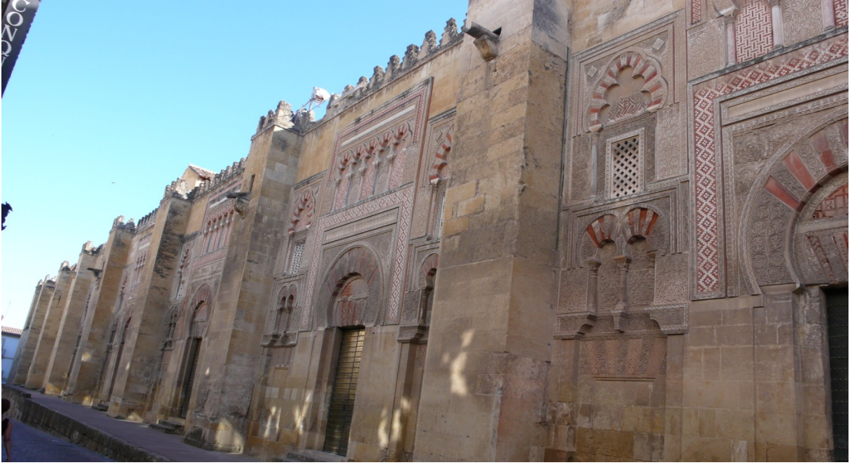
Resim 4: Kurtuba Camii dış detaylardan bir görüntü