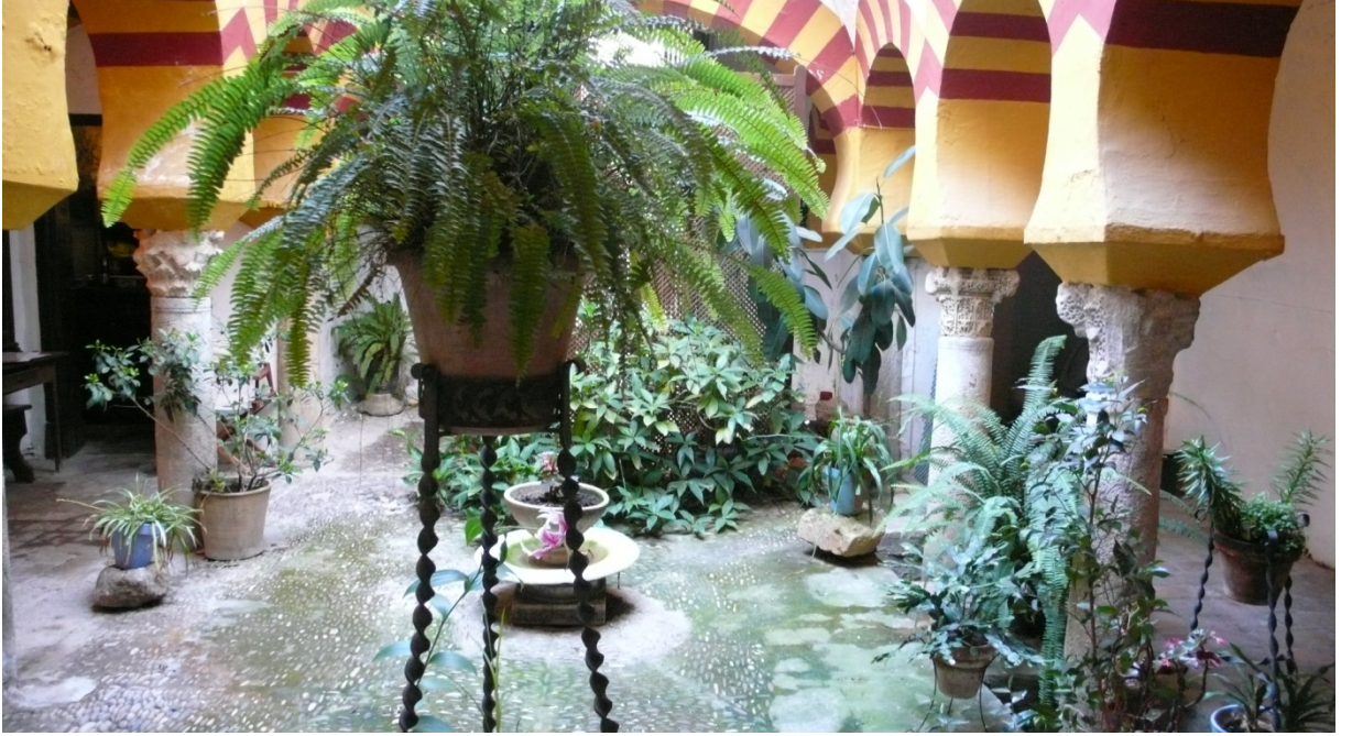
Resim 37: Bir Endülüs Hamamı