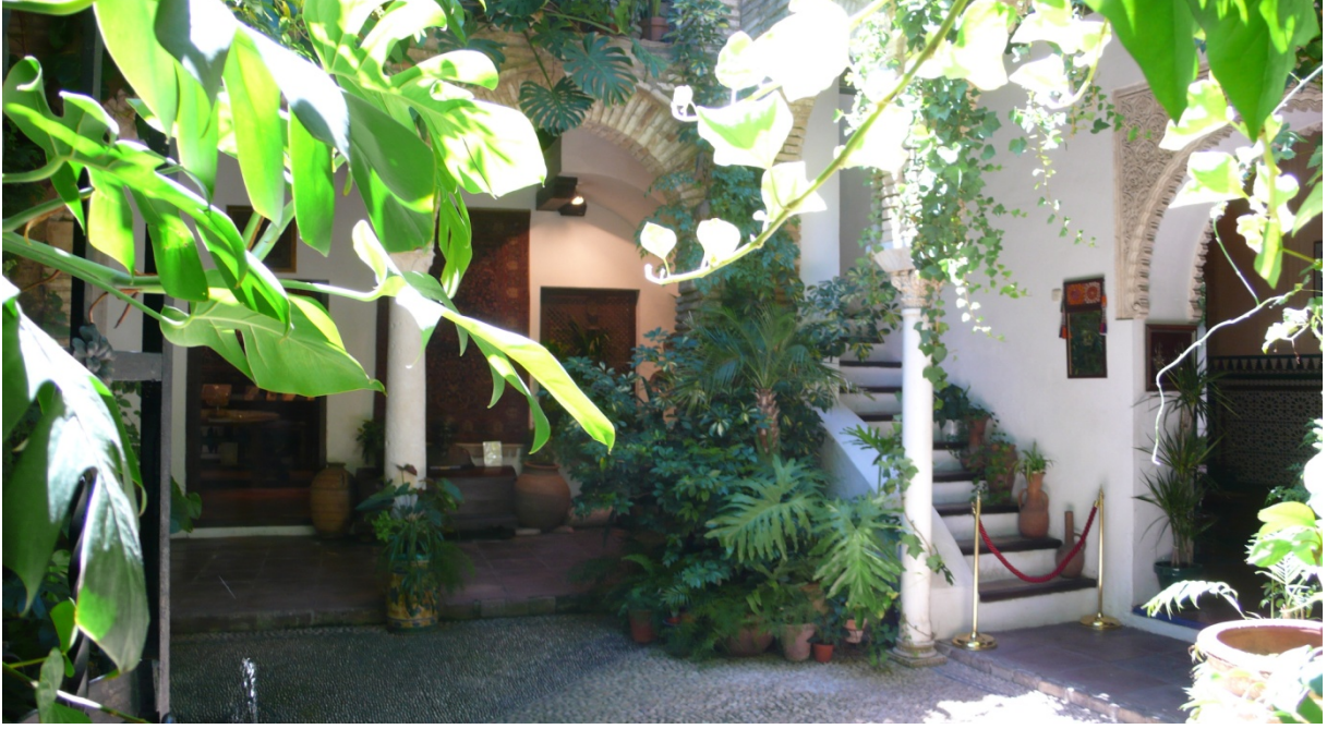
Resim 41: Bir Endülüs Evi detay