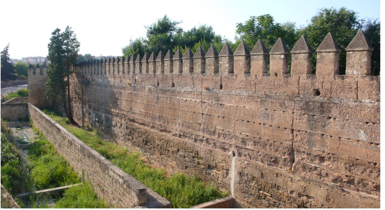
Resim 35: Güney surları