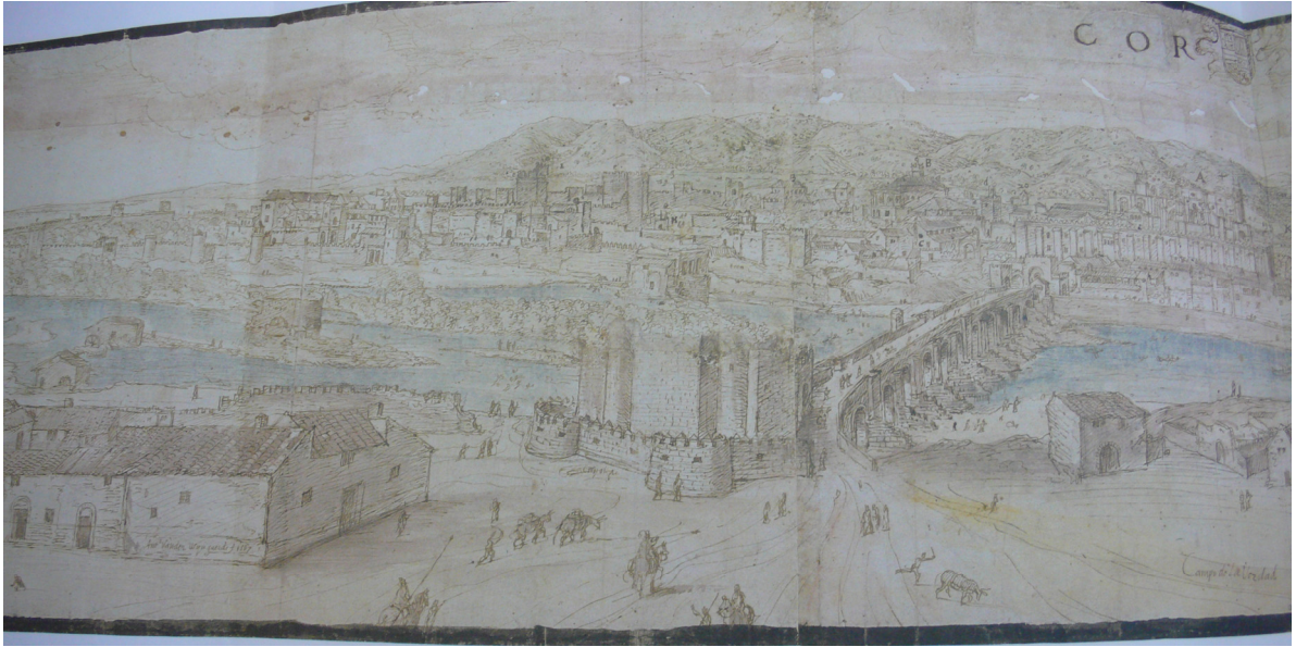
Resim 2: Genel görünüm 17. yüzyıl