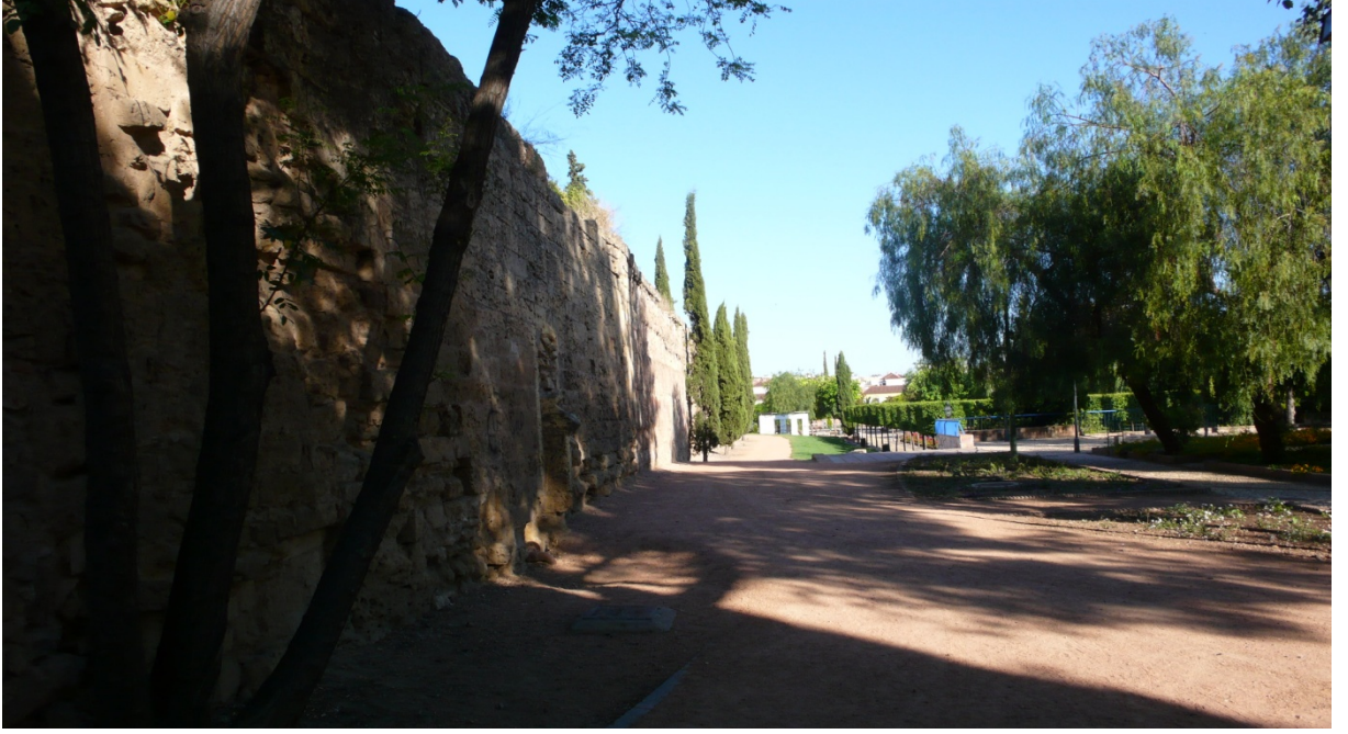
Resim 33: Kuzey dođu burcu