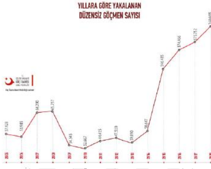
Şekil 1. Yıllara Göre Yakalanan Düzensiz Göçmen Sayısı