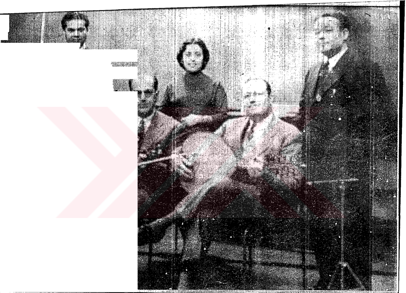
Mustafa Kenan Fasil Heyeti - 1956