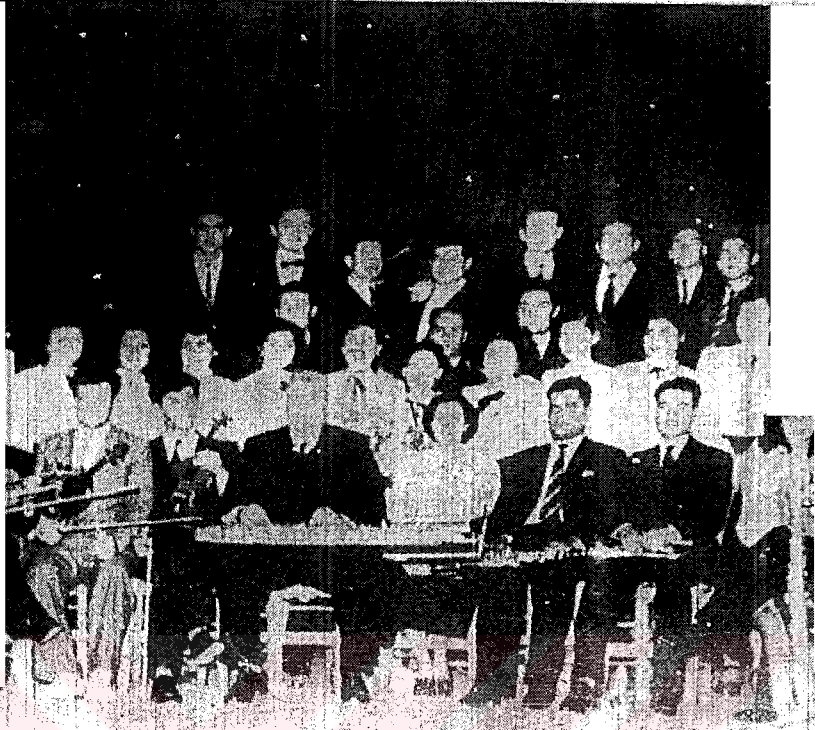
Darülelhan Topluluğu - 1950