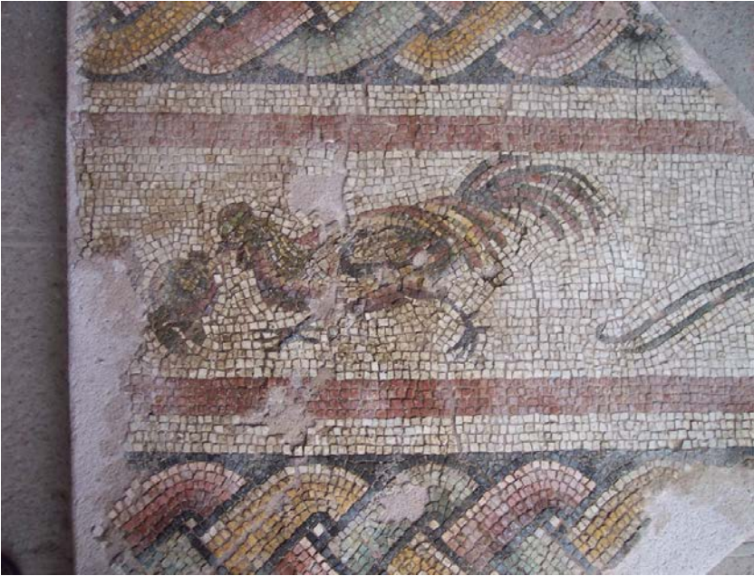
Resim 8 - Zodyak Kuşaklı Mozaik / Nar Didikleyen Horoz Figürü