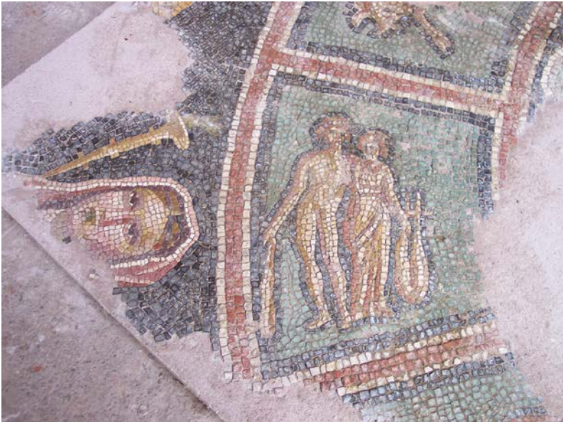
Resim 10 - İkizler Burcu ve Kış Mevsimi (U.Ü. Arkeoloji Bölümü Arşivi)