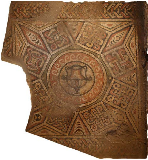
Resim 3 - Yerkapı Mozaikleri / Kantharosu Alan (U.Ü. Arkeoloji Bölümü Arşivi)