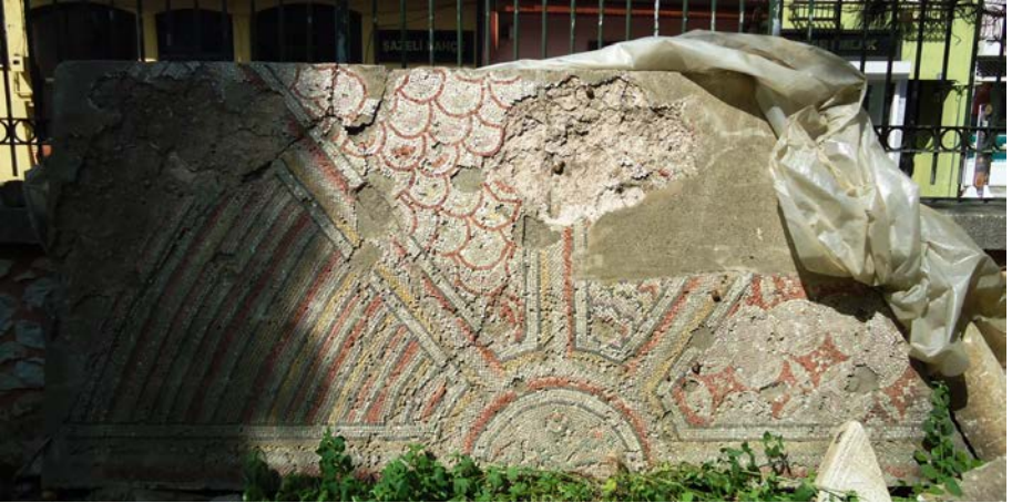
Resim 12 - Muradiye Külliyesi'nin Bahçesinde Korunan Pano