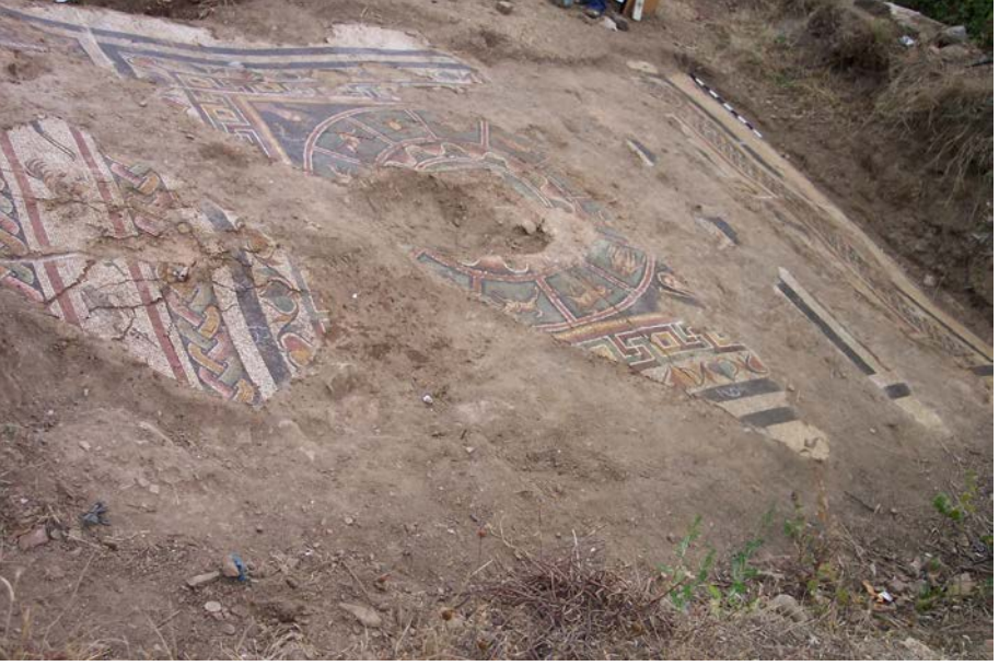
Resim 6 - Zodyak Kuşaklı Mozaik

Mozaik döşeme üzerinde, dairevi bir şeklin içerisinde on iki burcun simgelendiği zodyak kuşak, ortada güneş tanrısı Sol Invictus ve panonun dört bir köşesine kadın olarak kişileştirilen ilkbahar, yaz, sonbahar ve kış mevsimleri yer almaktadır (Resim 7).