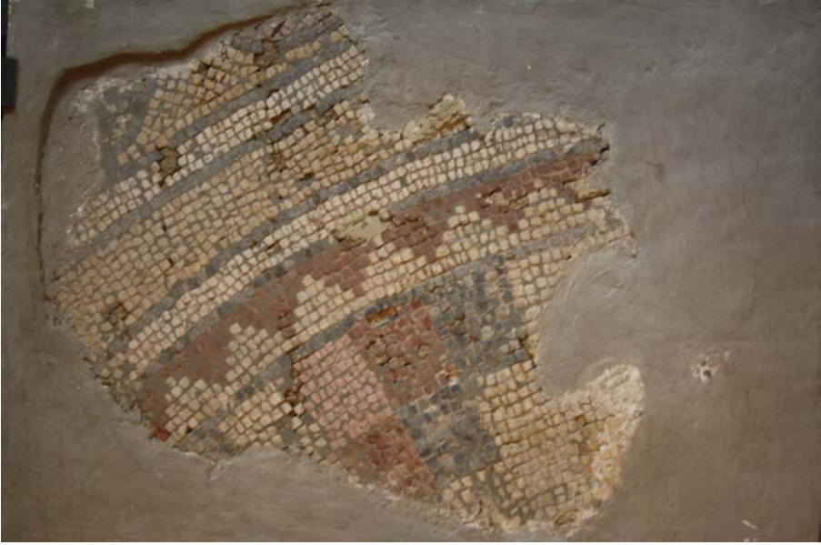
Resim 13 - Bursa Arkeoloji Müzesi 1 Numaralı Pano (Yazar)

2 numaralı pano, yan yana sıralanmış eşkenar trapez şekillerden oluşan radyal bir desene sahiptir (Resim 14). Buradaki pano üzerinde trapezlerden yalnızca üç tanesi seçilebilmektedir. Bunlardan ortada olanı diğerlerine göre daha iyi korunmuş durumdadır, kenardakilerin ise çok küçük kısımları mevcuttur ancak yine de bu trapezlerin içlerine doldurulan motifler anlaşılmaktadır. Ortada yer alan trapez şeklin içi gölgeli işlenmiş balık pulu motifi ile doldurulmuştur. Sol tarafta yer alan trapezin içi gökkuşuğu renklerinde zikzak çizgilerin açılar oluşturmasıyla meydana gelen, dişli sicimlerden oluşturulmuş yüzey motifi ile doldurulmuştur. Sağ taraftaki trapezde ise gökkuşuğu renginde basit sicimlerden oluşan, yüzey motifi işlenmiştir.