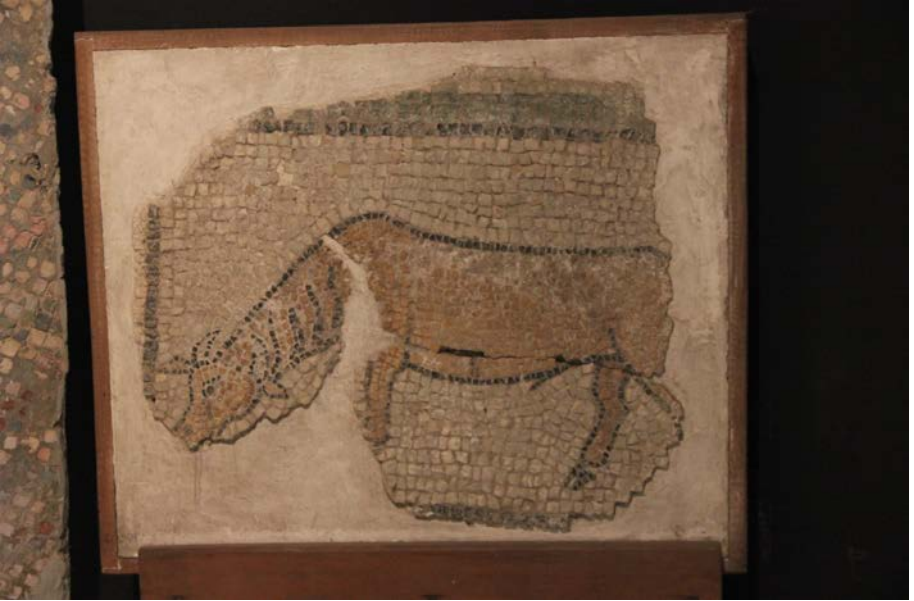
Resim 15 - Bursa Arkeoloji Müzesi 3 Numaralı Pano (Yazar)