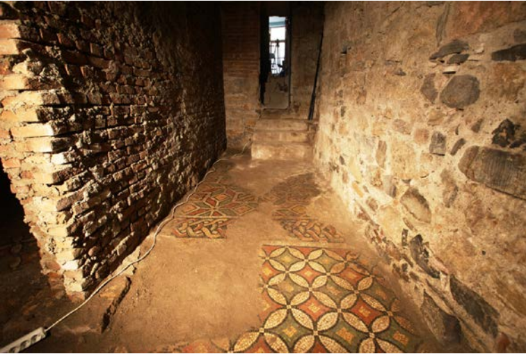
Resim 2- Yerkapı Mozaikleri/Koridorlu Alan

Bodrum katın kuzey bölümünde, koridorlu (Resim 2) ve kantharoslu panolar (Resim 3) güney bölümünde ise kuşlu pano (Resim 4) yer almaktadır.