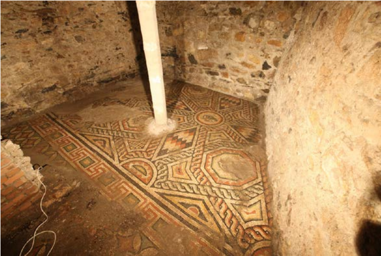
Resim 4 - Yerkapı Mozaikleri / Kuşlu Alan