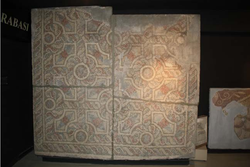
Resim 18 - Bursa Arkeoloji Müzesi 6 Numaralı Pano (Yazar)