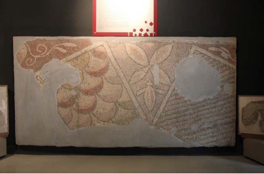
Resim 16 - Bursa Arkeoloji Müzesi 4 Numaralı Pano

4 numaralı pano üzerinde geometrik ve bitkisel motiflere yer verilmiştir. Birer köşelerinden birbirlerine bağlanmış, içleri çeşitli desenler ile doldurulmuş büyük iki karenin arasında oluşan üçgen şekil temel tasarımı oluşturmaktadır (Resim 16). Sağ taraftaki kare şeklin içi yan yana dizili gölgeli balık pulu motifleri ile doldurulmuş olup soldaki karenin içi ise basit sicimlerden oluşan, gökkuşağı renginde yüzey motifi ile doldurulmuştur. Ortada oluşan üçgen şeklin içinde ise dört yapraklı yonca (Balmelle vd., 2002: 42) ve iğ şekilli yaprak (Balmelle vd., 2002: 47) motifleri yer almaktadır. Panonun üst köşelerinde kenarları volütlü, damla formu yapraklı bitkisel desenler bulunmaktadır (Balmelle vd., 2002: 46).