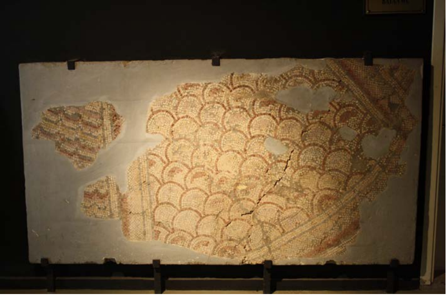
Resim 14 - Bursa Arkeoloji Müzesi 2 Numaralı Pano (Yazar)