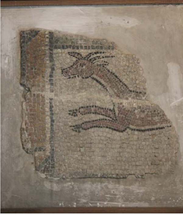
Resim 17 - Bursa Arkeoloji Müzesi 5 Numaralı Pano (Yazar)