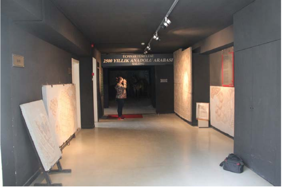
Resim 11 - Bursa Arkeoloji Müzesi – Mozaiklerin Sergilendiği Koridor