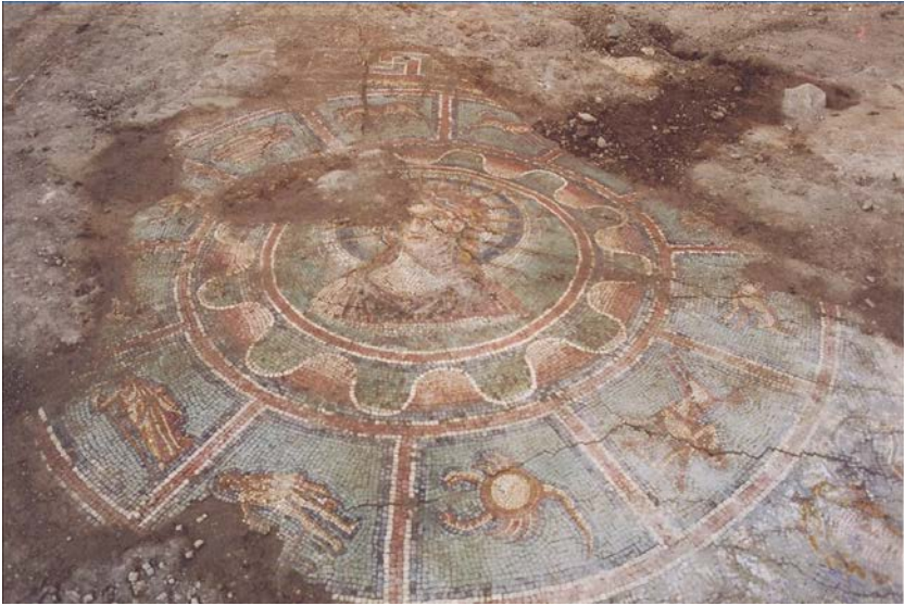
Resim 7 - Sol Invictus ve Zodyak Kuşak