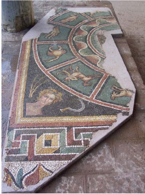
Resim 9 - Zodyak Kuşak ve Yaz Mevsimi