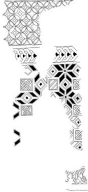
Resim 5 - Yerkapı Mozaikleri / Koridorlu Alan

Kuşlu Alan (Resim 4); bu pano, doğu, batı ve güneyden binanın duvarları ile kuşatılmış ve olasılıkla da beden duvarlarının dışına da taşmaktadır (Okçu, 2009: 35). Bu alanın kuzeyi, aralara kareler yerleştirilen geriye dönüşlü gamalı haçların sıralanmasıyla oluşan meander desenli bir bordürle kuşatılmıştır. Ortasında kuş figürünün yer aldığı bir daire, ana panonun merkezini oluşturmaktadır. Bu merkezi dairenin etrafı uçları dairenin