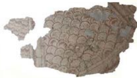
Resim 20 - Bursa Arkeoloji Müzesi'nden 2 numaralı pano ile Muradiye Külliyesi bahçesindeki panonun birleştirme denemesi (Yazar)