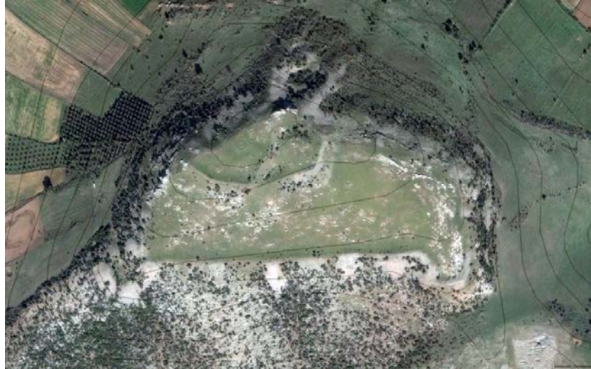
Resim 3: Dedeboyı Hava Fotoğrafi