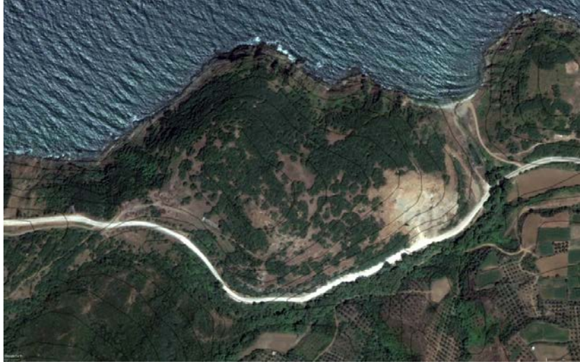
Resim 5: Çalılıburun Tepe Hava Fotoğrafı