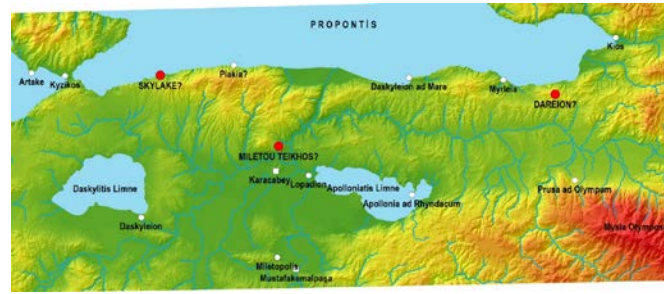
Harita 1: Bölge Kentleri ve Metinde Anılan Lokasyonlar

Propontis çevresindeki Hellen kentlerinin pek çoğunun koloni kökenli olmaları sebebiyle çok kültürlü yapıları ve yaşanan tüm bu siyasi gelişmeler ile Kıta Yunanistan kentlerinden bilinen, model Hellen organizasyonlarının tam manada uygulanmış olamayacağı öngörülebilir. Ayrıca bölgedeki gerek çok kültürlülük gerekse siyasi gelişmeler Hellenler'i ve yapılarını etkilemiş olabileceği gibi tam ters yönde Hellenler dışında kalan Persler ve özellikle kolonizasyon öncesindeki yerli halkı daha da etkilemiştir. Bu bağlamda tüm bu dinamikler, her yerleşme için tamamen özgün bir model oraya çıkarmaktadır. Teorik olarak ortaya konan bu özgün yapı sebebiyle antik kaynaklarda ismi polis olarak geçen bu yerleşmeler, makale içinde kent olarak anılacaktır (Harita 1).