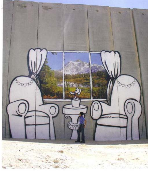
Resim 13: (Banksy, 2005: 117)

Old man You paint the wall, you make it look beautiful Me Thanks Old man We don't want it to be beautiful, we hate this wall, go home