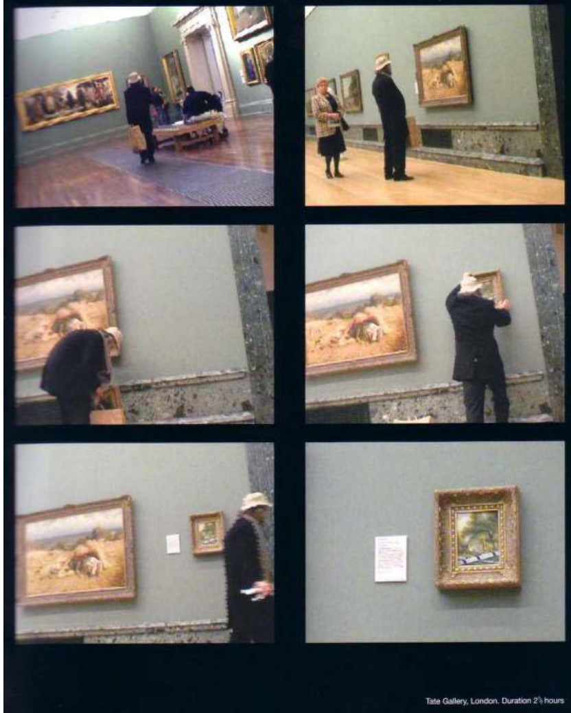
Resim 3: Tate Galeri, Londra (Banksy, 2005: 138)