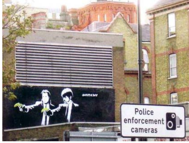
Resim 7: ( http://www.artbanksy.com/famous-artworks.html : e.t. 26.08.2018)