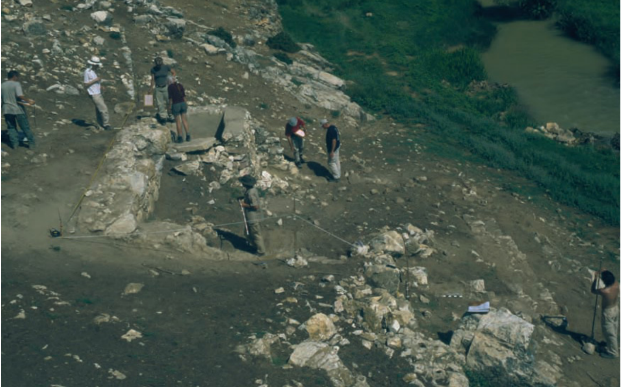
Resim 3. Pepuza yerleşim alanından bir görünüm.