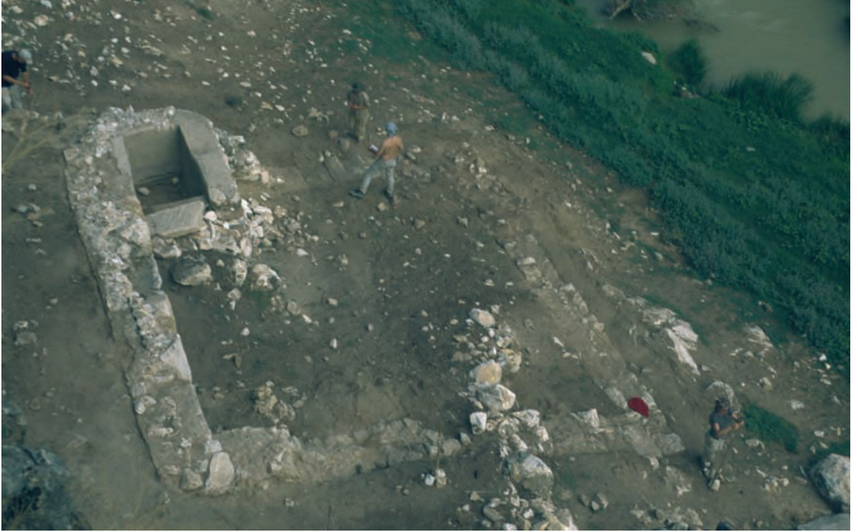
Resim 2. Pepuza kentine ait olduğu sanılan yerleşim alanı.