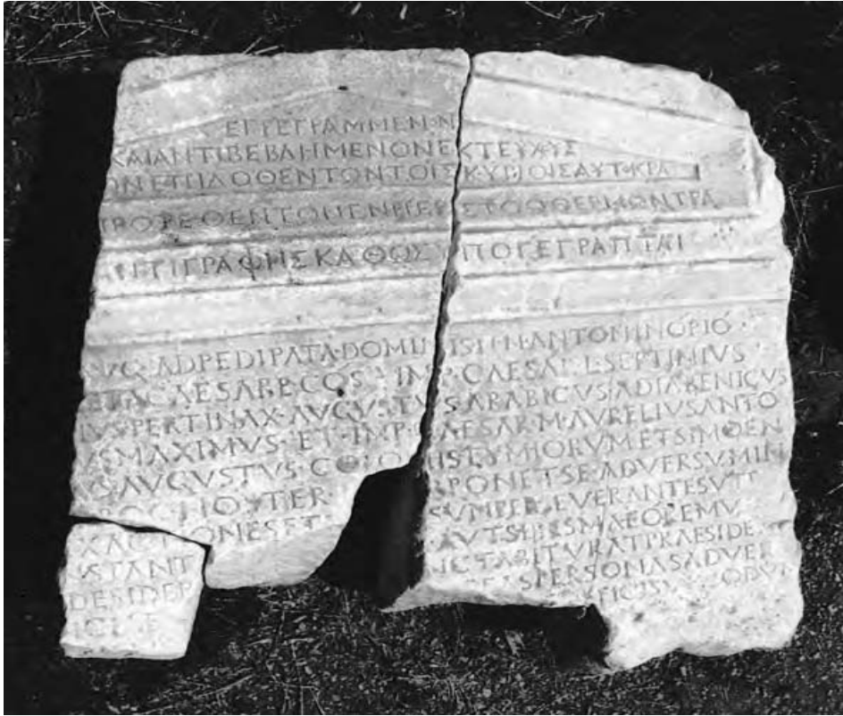
Resim 6. Tymion Yazıtı (Uşak Müzesi)