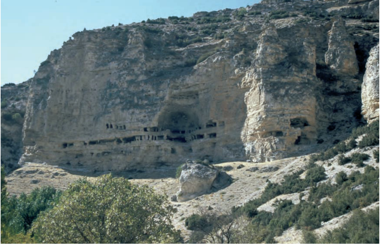
Resim 5. Pepuza Manastırı