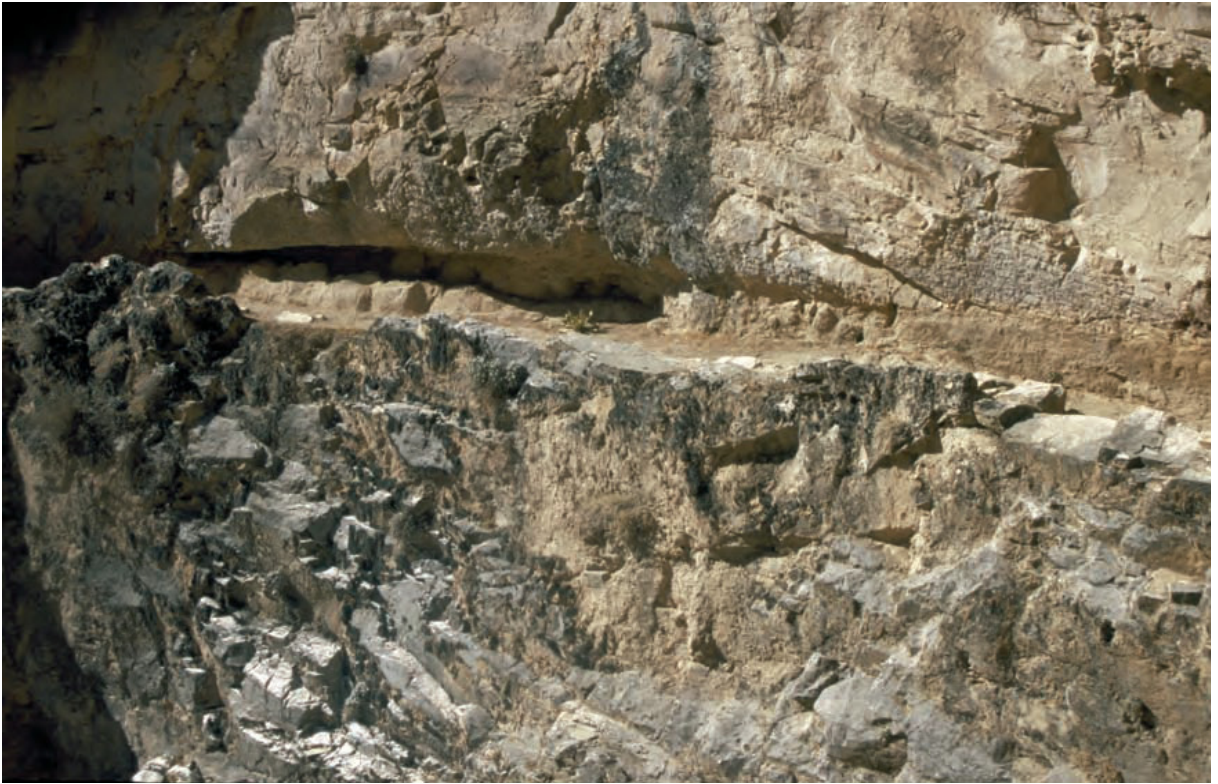
Resim 1. Pepuza yakınlarında, kayaların oyulmasıyla elde edilen patika yol.