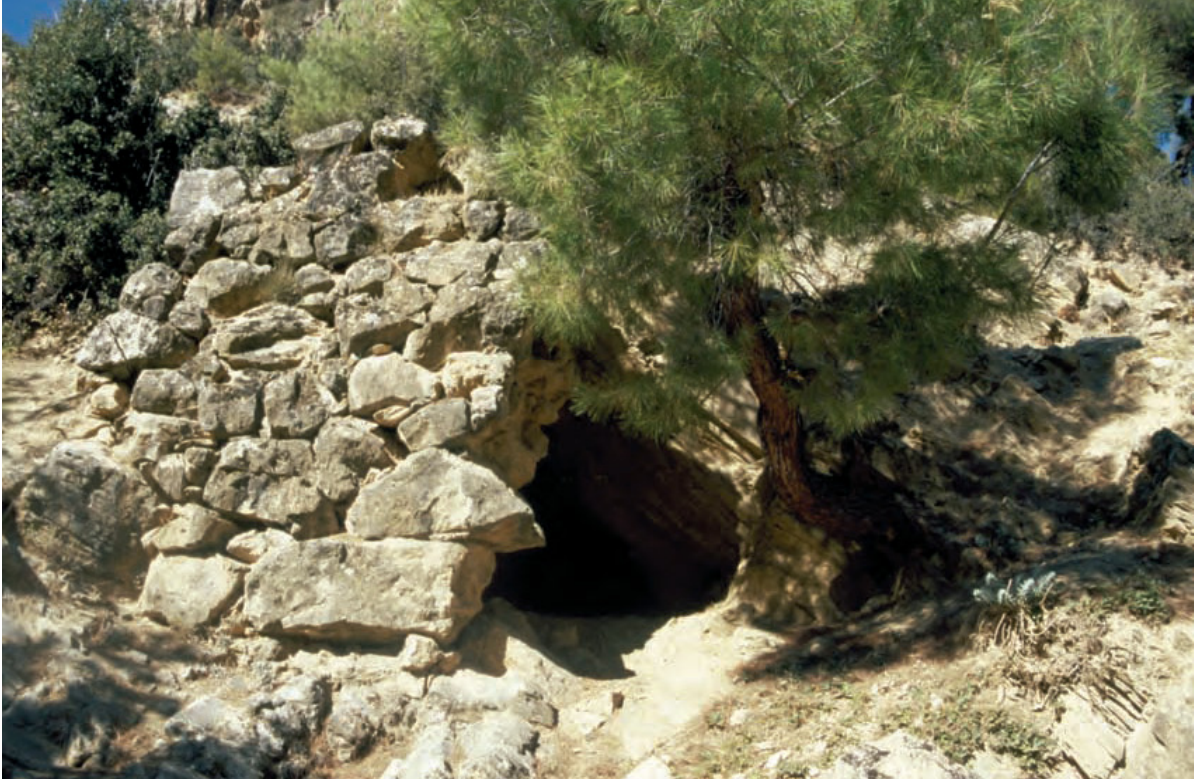
Resim 7. Pepuza yakınlarında bulunan, Montanistlere ait olduğu sanılan mezar.