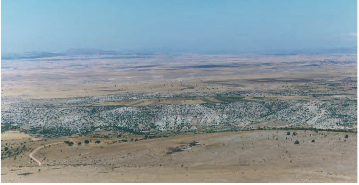
Resim 1. Ömerçalı'dan bir görünüm: Göksel Kudüs'ün ineceği yer olan Pepuza ve Tymion kentleri arasındaki alan.