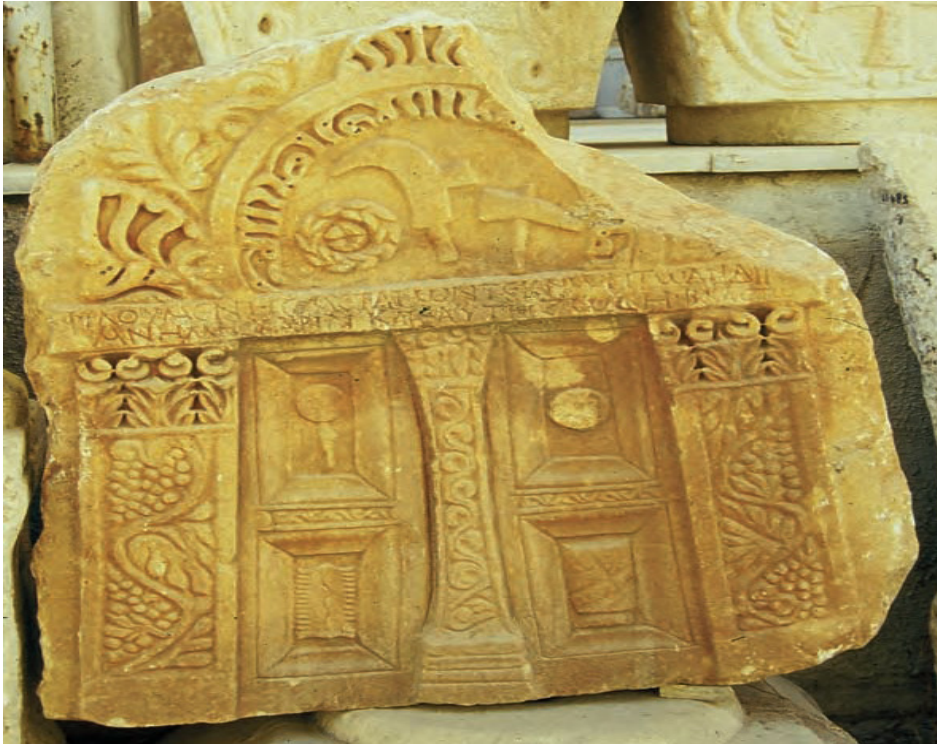
Resim 4. Pepuza yakınlarında bulunan mermer levha.