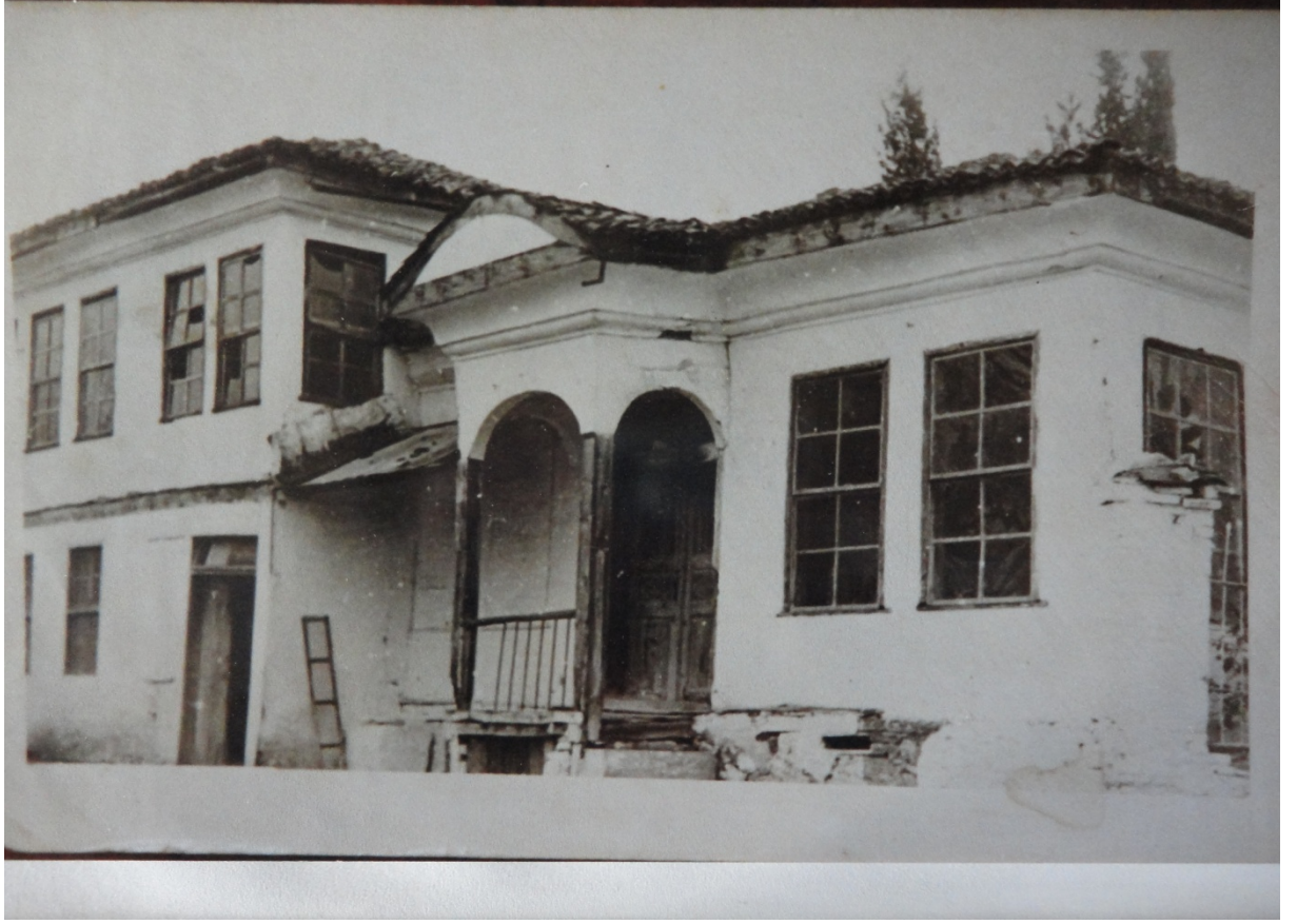
Dergâh'ın 1960'lı Yıllardaki Görünümü