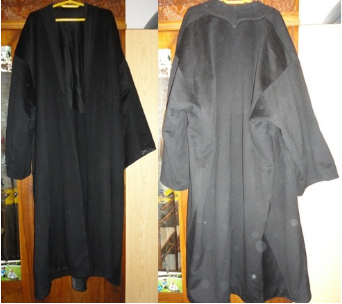
Şeyh Zekeriyya Efendi'nin Cübbesi