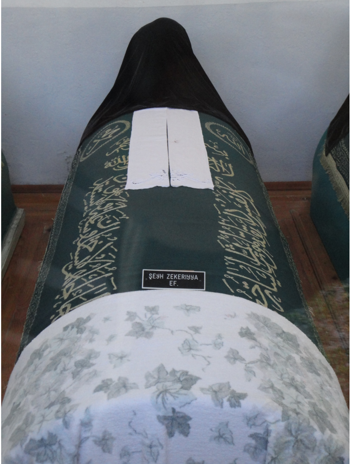
Şeyh Zekeriyya Efendi'nin Sandukası