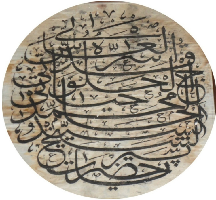
“Ya Hazreti Pir Eş Şeyh Es Seyyid Muhammed Hayati Halveti Kaddesallahu Sırrıhu'l Ali” istifi