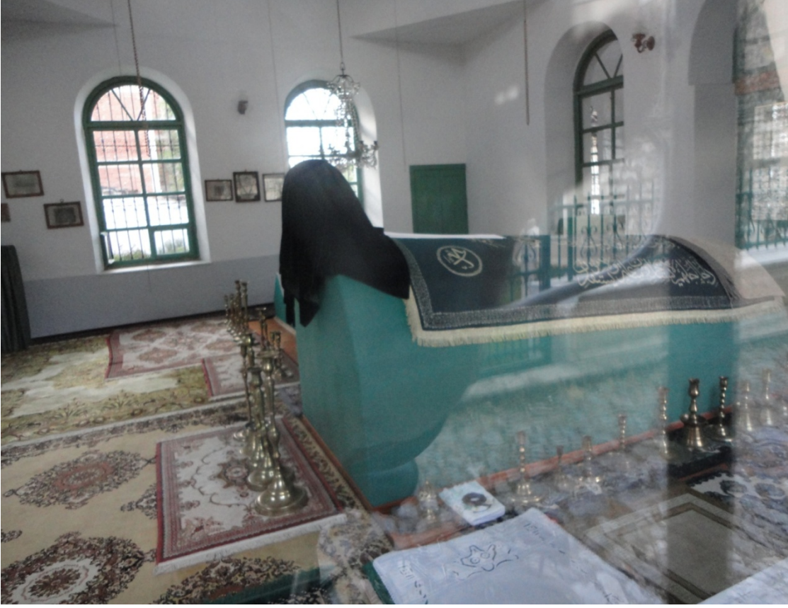
Halvetiyye'nin Hayatiyye Kolunun Kurucusu Pir Muhammed (Mehmed) Hayati'nin Türbe-i Şerif'teki Sandukası.