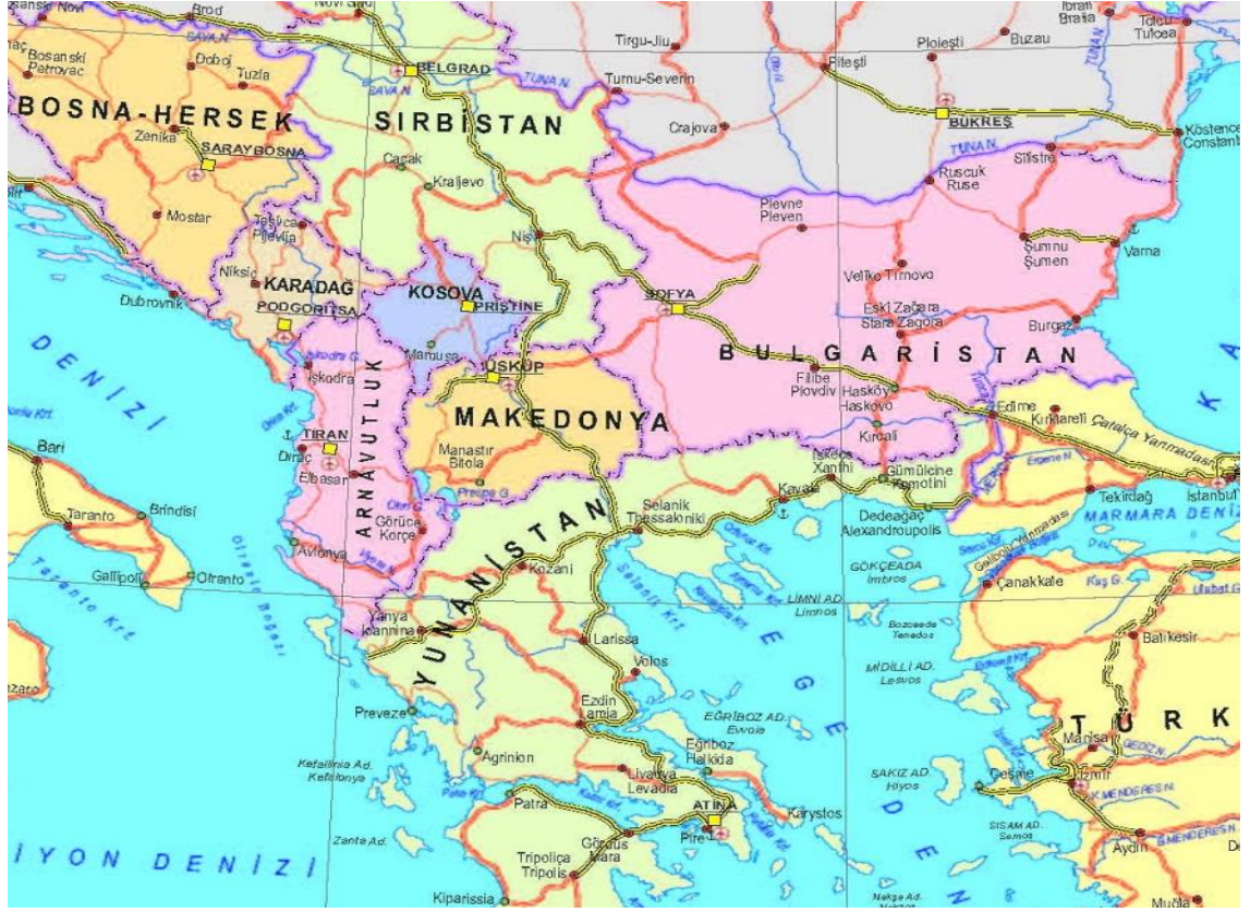
EK. 1: Harita 1: Kuzey Makedonya Siyasi Haritası ve Komşuları 248